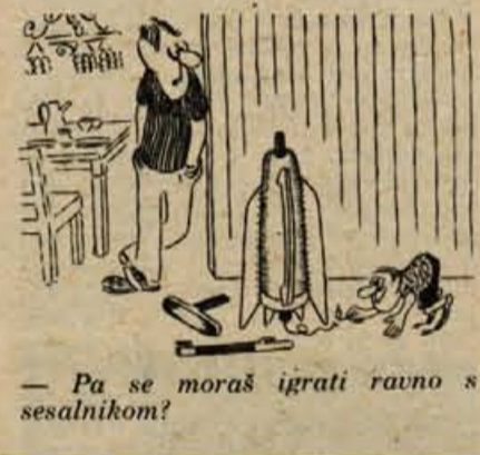
— Pa se moraš igrati ravno s sesalnikom!

Medtem ko je bilo v avgustu letos opaziti močno zvišanje cen v ZDA in Kanadi, pa je bilo včasih cen v Evropi nekoliko zmernejše. V Evropi so se cene v avgustu zvišale v poprečju za 0,4 odstotka, v ZDA za 1,8 odstotka, v Kanadi pa za 1,3 odstotka. V zadnjih dvanajstih mesecih pa so se cene v ZDA dvignile za 7,6 odstotka, v Kanadi za 8,3 odstotka, na Japonskem za 12,6, v Zah. Nemčiji za 7,1, v Italiji 11,7, v Britaniji za 8,9, v Avstriji za 7, v Grčiji za 15,1, v Španiji za 12,3 odstotka itd.