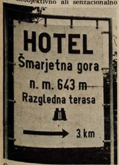
Opozorilna tabla v Stražišču — Nekdo je rekel, da je nesramna provokacija

Molk in zid bi lahko ta hip rekli za objekte na Šmarjetni gori. Molk, ki je tako hladen, da postaja že naravnost odvrten, in zid, ki obdaja hotel in je na srečo še vedno dovolj trden, da ni nevarnosti, da bi kjer koli popustil in povzročil še večjo škodo. Potem je tu še asfaltirana cesta, ki se odcepi na Delavski cesti v Stražišču na vrh Šmarjetne gore. Ni vzdrževana in ponekod po robih močno zaraščena, sicer pa dobra. Kako tudi ne? Saj poleg redkih motoriziranih turistov (največ mladih Kranjčanov), ki se od časa do časa ob večerih umaknejo pred vsiljivimi pogledi na Šmarjetno goro in uživajo v prijetnem šepetanju, ter redkih voz s konjsko vprego, ko lastniki to in ono postorijo v gozdu, cesta sploh ni obremenjena. Takšna je že leto dni Šmarjetna gora, ko so na njej zaprti hotel.