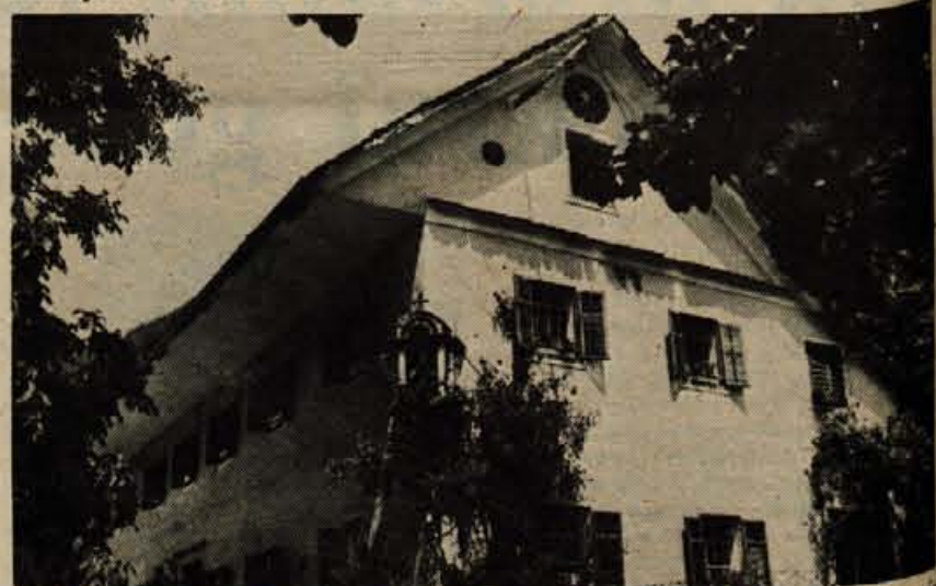
Podgorškova hiša v Gradu št. 43 stoji po ljudski pripovedi na mestu, kjer je stal nekdanji viteški grad, po katerem je vas dobila svoje ime.