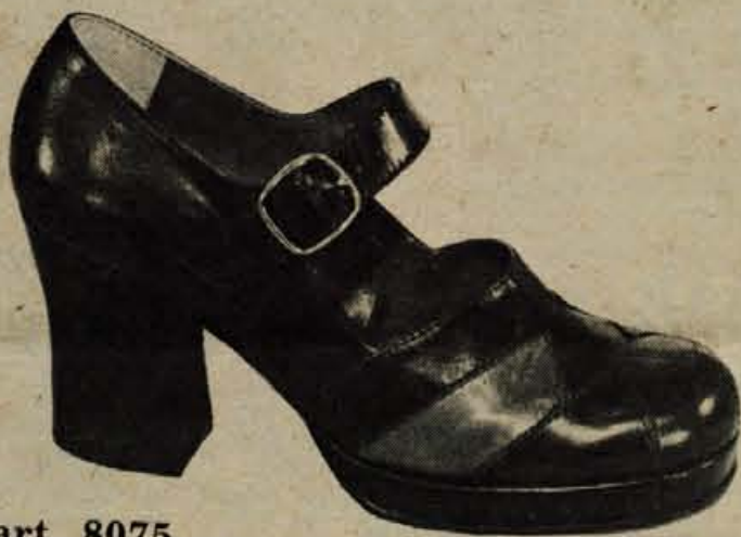
art. 8075 vel. 35—41

Obveščamo interesente za nakup malih traktorjev pasquali - Tomo Vinkovič, da smo zaradi večje proizvodnje skrajšali dobavni rok s 6 na 3 mesece