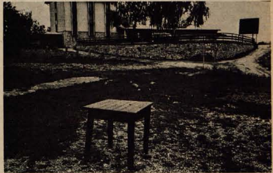
Naključni ali zaradi vabljeve table v Stražišču prevarani prišlek si lahko malce odahne pri mizi, ki v posmeh sameva na vrhu.