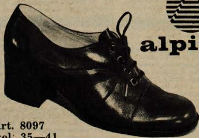
art. 8097 vel. 35—41