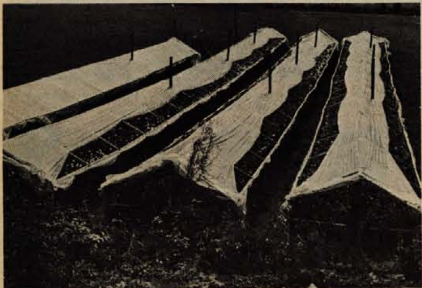
Osem arov velik nasad krizantem nasproti osnovne šole v Podbrezjah