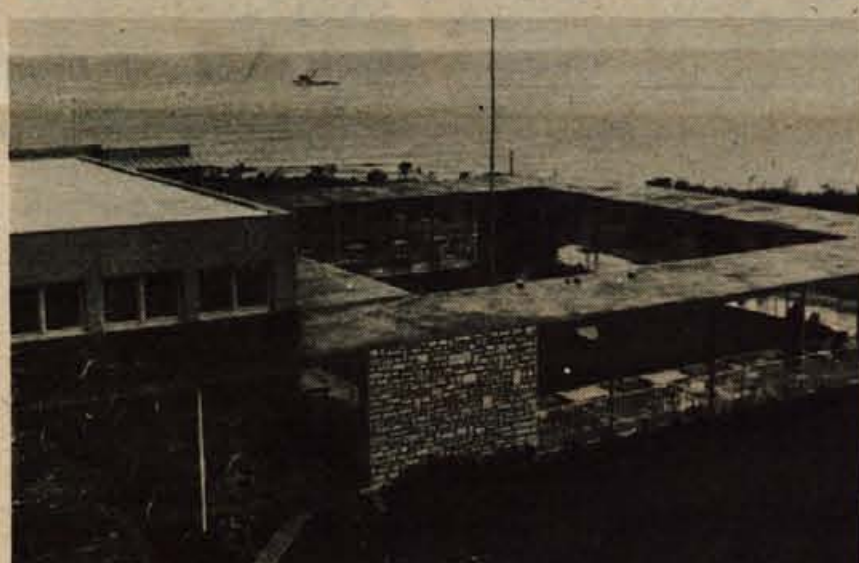
Novigrad-Pineta. — Letovišče za gorenjske otroke.

• VSAKO SREDO • VSAKO SREDO • VSAKO SREDO • VSAKO