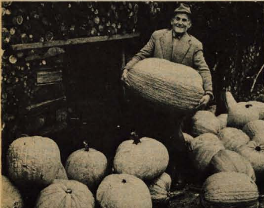
Pri Alojzu Podobniku v Bukovici v Selški dolini smo slikali tele buče. Najtežja je imela kar 40 kg.