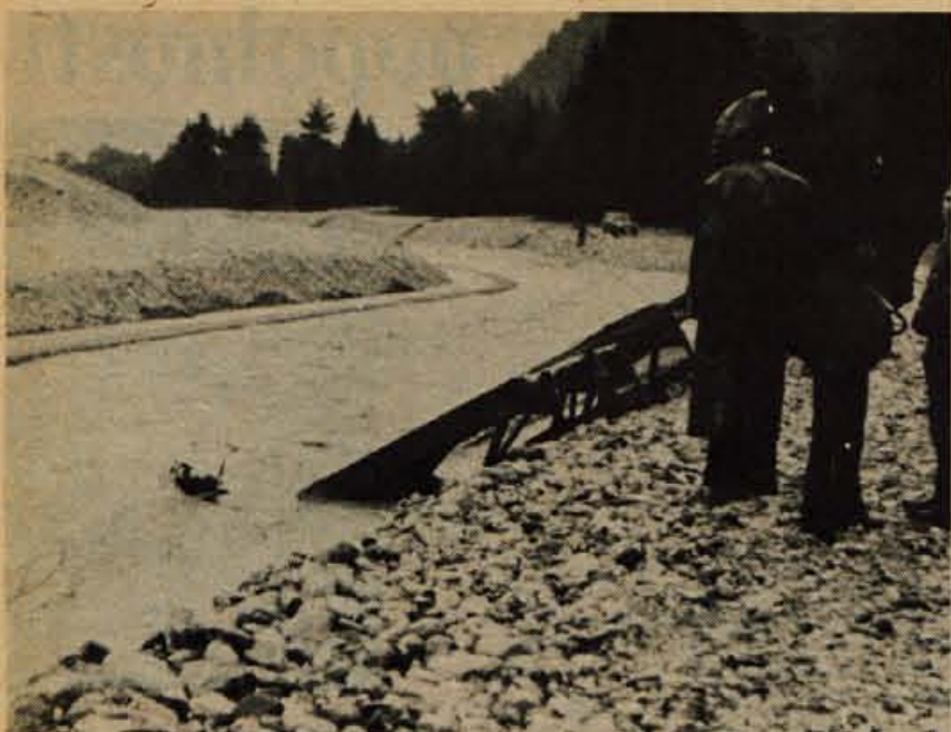
Prejšnji teden je narasla Sava Dolinka naredila precej škode pri regulacijskih delih v bližini Zvagna na Jesenicah. Tu so delavci Vodne skupnosti Kranj pripravili vse potrebno za zgraditev dveh pregrad in naprav za usmerjanje vode pri bodočem izkoriščanju nanosenega peska. Ponovno deževje je uredilo in v ponedeljek pa je še bolj napolnilo savsko strugo. Velika voda je ogrožala del Mojstrane, trgala bregove od Jesenic in ogrožala novo klavnico, tradisovno naselje ter nekatere hiše pod Mežakljo na Jesenicah. Na sliki: ured Zvagnovim mostom