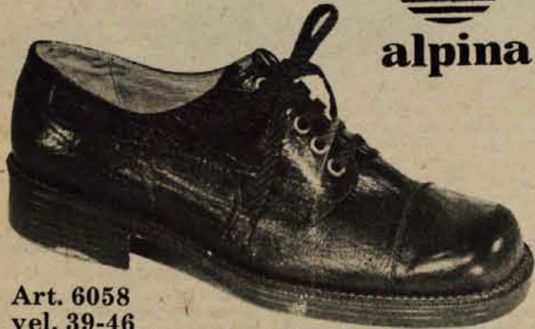
Art. 6058 vel. 39-46