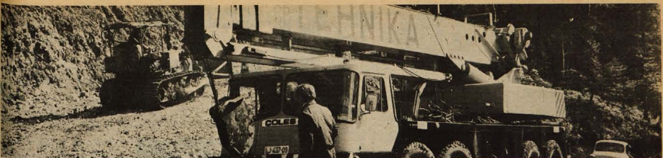
40 TON NA KRVAVEC — Pet ur je včeraj potrebovalo 40-tonsko dvigalo GP Tehnika iz Ljubljane, da je »prilezlo« po 14 kilometrov dolgi poti iz Cerkelj na Krvavec