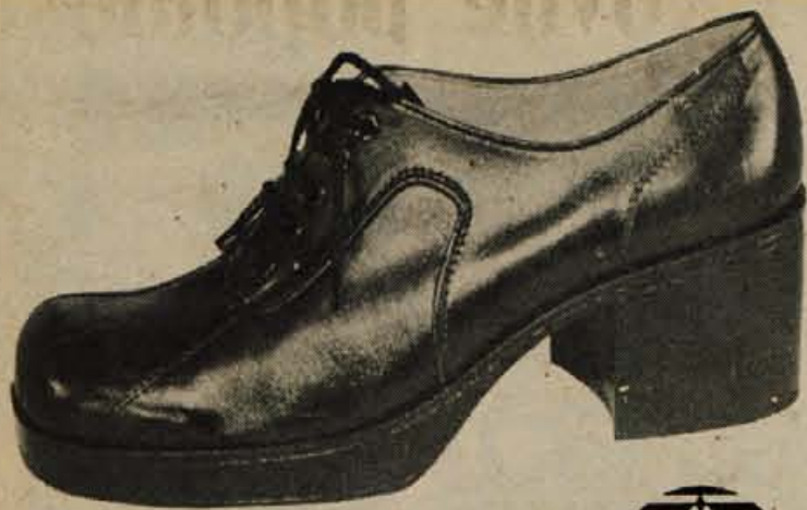
Art. 6052 vel. 38-44