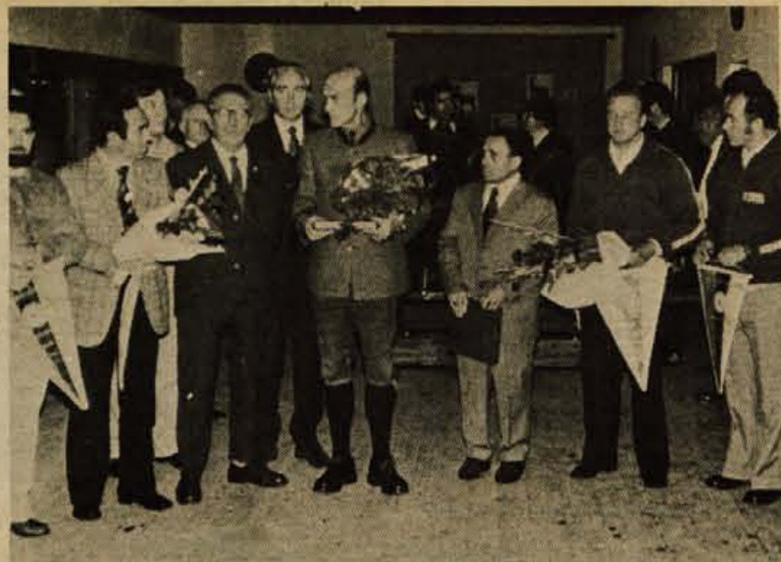
Troboj Koroška : Furlanija : Gorenjska 30. septembra v Št. Vidu na Koroškem. Pristone strelce je na strelišču pozdravil g. Nattmessnig. Na sliki od leve proti desni: kapetana italijanskih ekip, v sredini predsednik strelskih zvez, desno gorenjska predstavnik tekmovalcev ob otvoritvi.