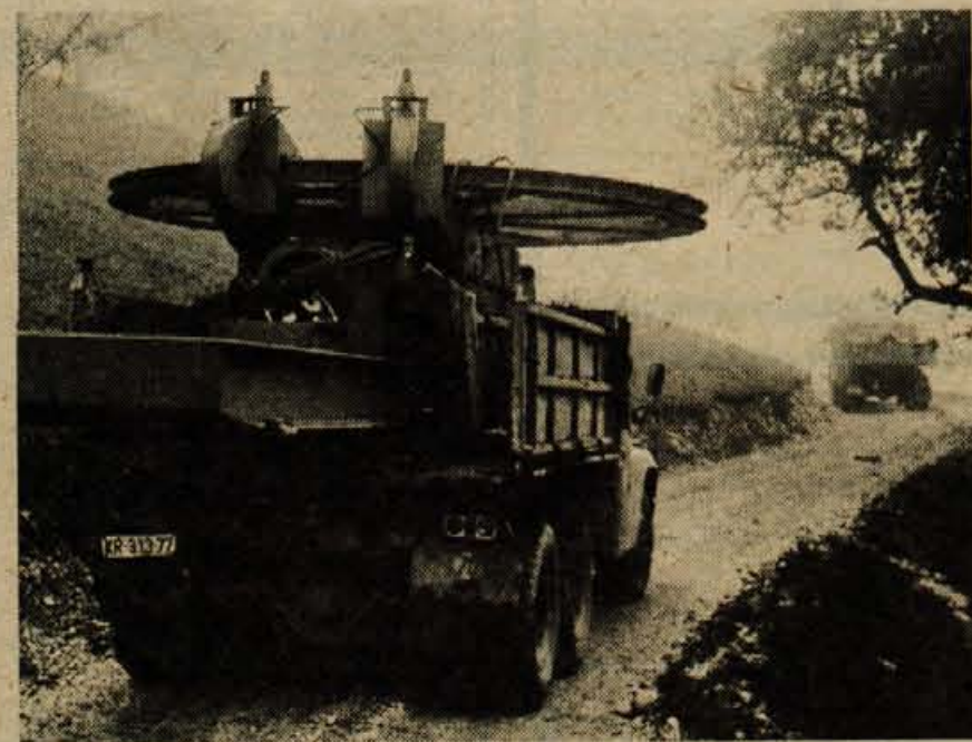
12-tonski pogonski agregat za novo krvavško žičnico, ki bo lahko prepeljala 900 oseb na uro, sta na vrh prepeljala dva kamiona. Na sliki: pogonsko kolo, ki ima 4 metre premera.

bili približno dvakrat manjši. Prevoz agregata z vsemi varnostnimi ukrepi bo namreč veljal okrog 20.000 novih dinarjev. A. Zalar