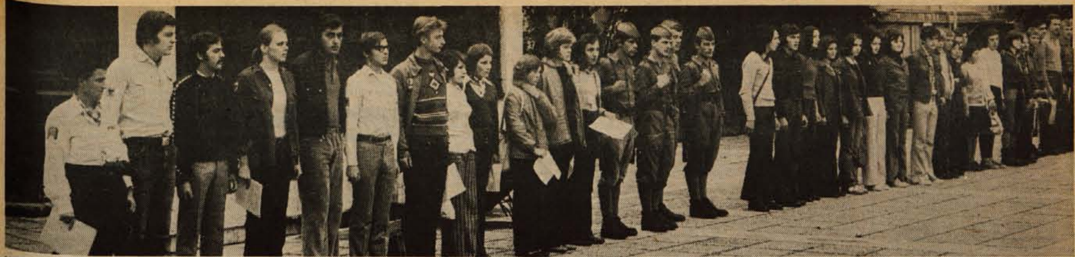
V nedeljo je 100 mladink in mladincev iz kranjske občine odšlo na pohod od spomenika do spomenika. Začetek pohoda (na fotografiji) in zaključek sta bila na Trgu revolucije v Kranju