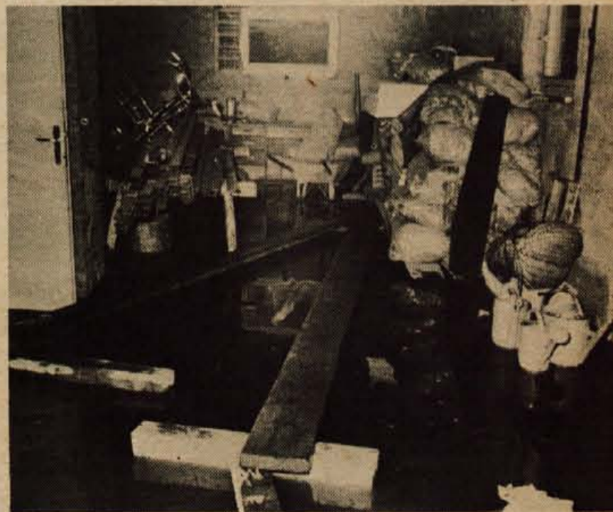
Poplavljen klet Janeza Gradišarja, Zgornje Duplje 70