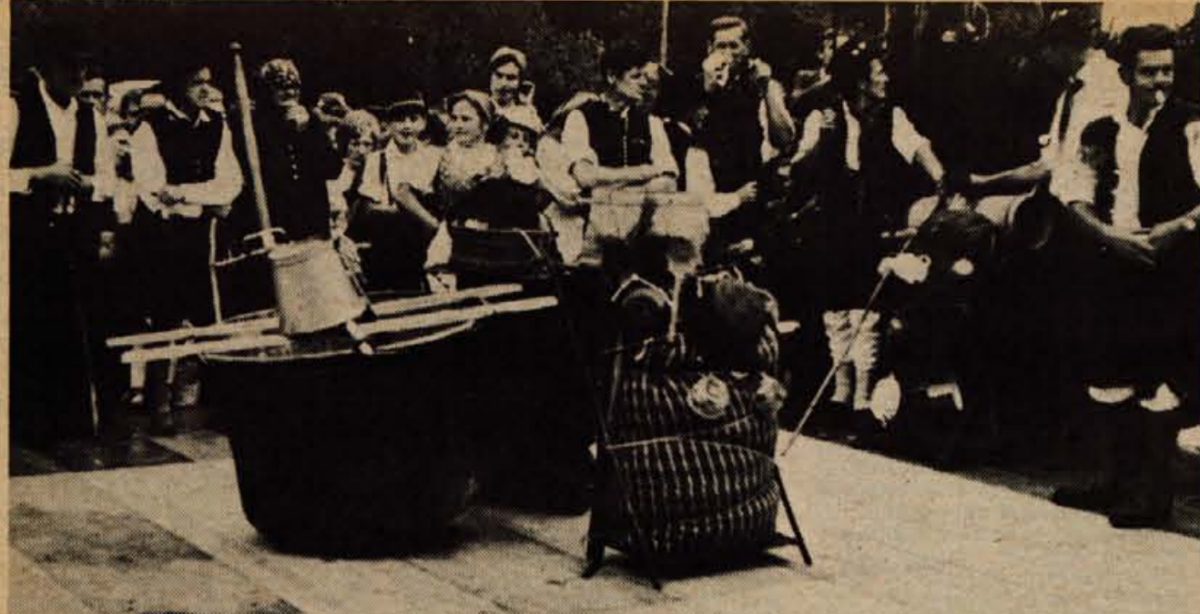
Majerji, majerice in sirarji so prinesli v nedeljo s planin na kravji bal v Ukancu tudi potrebščine in opremo (basngo), ki jo uporabljajo med večmesečnim bivanjem v planinah. Največje pozornosti obiskovalcev je bil deležen velikanski kotel.