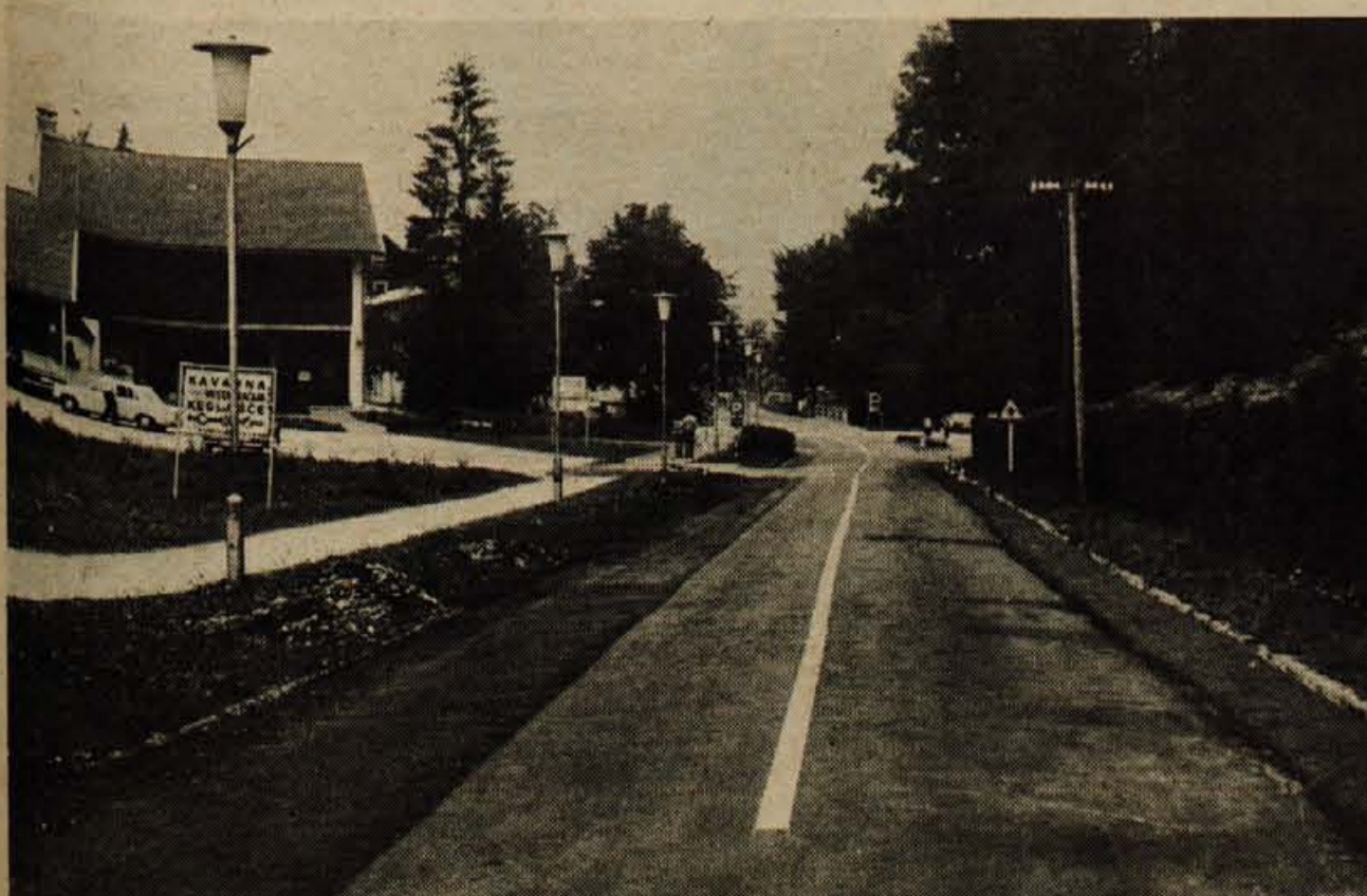
Cestno podjetje iz Kranja je pred kratkim razširilo 800 metrov dolg odsek ceste od hotela Jezero do Ribčevega laza v Bohinju

1100-članski kolektiv ljubljanskega podjetja Tip-top bo prihodnjo soboto v Bohinjski Bistrici, kjer ma podjetje svoj proizvodni obrat, proslavil 20. obletnico obstoja. Predvčerajšnjim pa so v tem obratu v Bohinjski Bistrici, kjer je 119 zaposlenih, podpisali tudi samoupravni sporazum o ustanovitvi temeljne organizacije združenega dela.