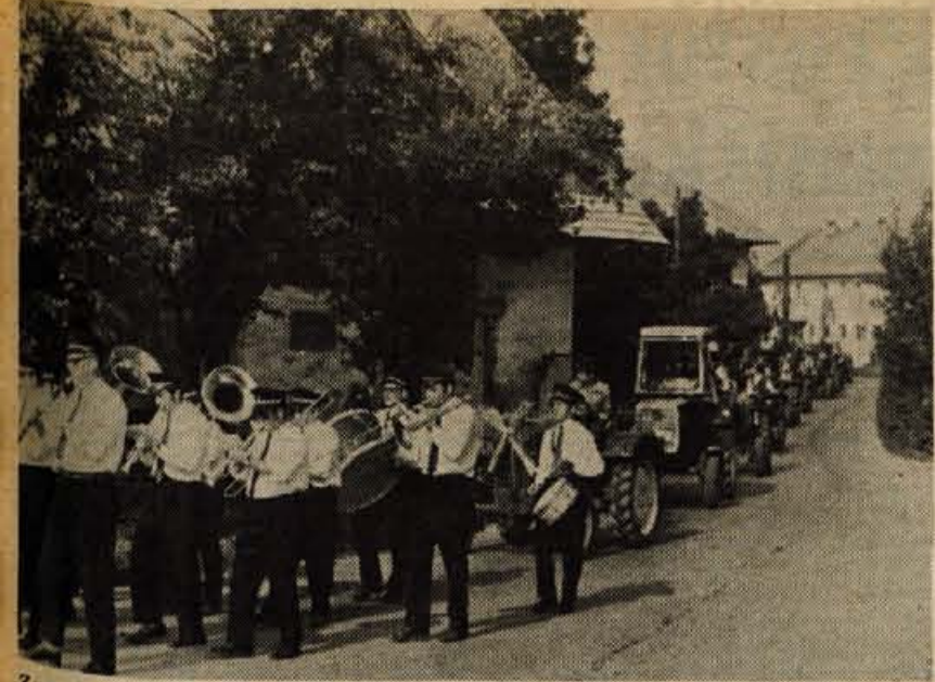
Z. godbo iz Vodice so odpeljali traktoristi in poklicni kmetijski strojniki v sprevidu proti startu za oranje.