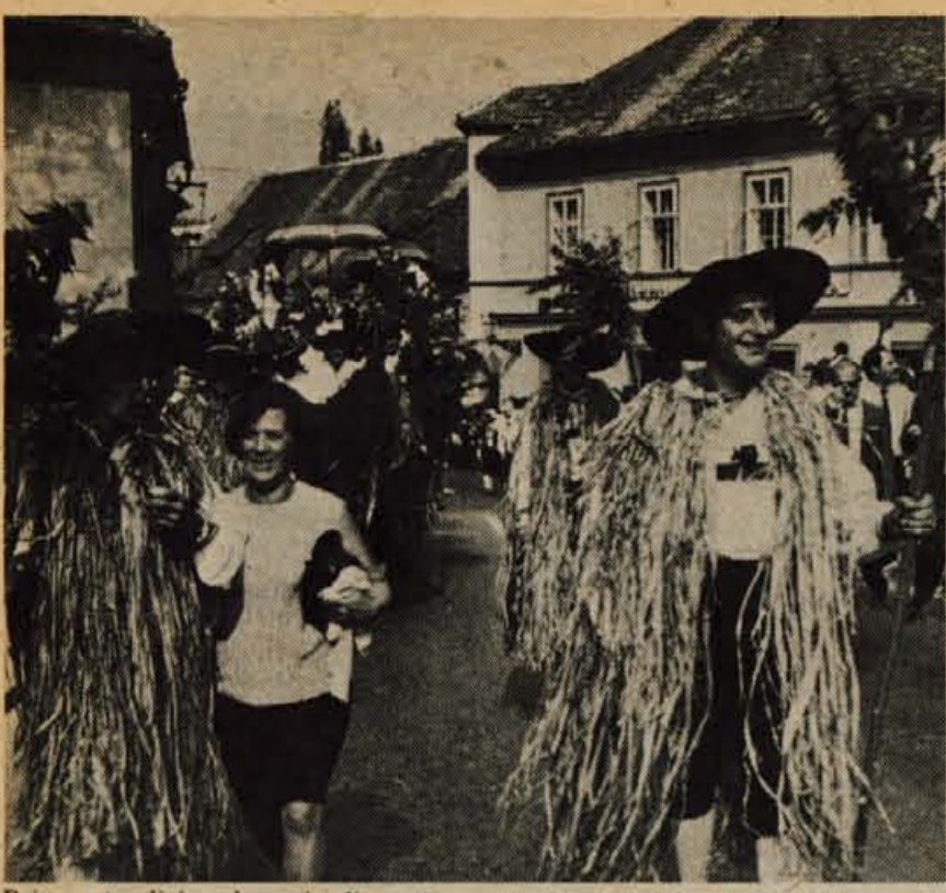
Prizor s tradicionalne prireditve Dan narodne noše v Kamniku.