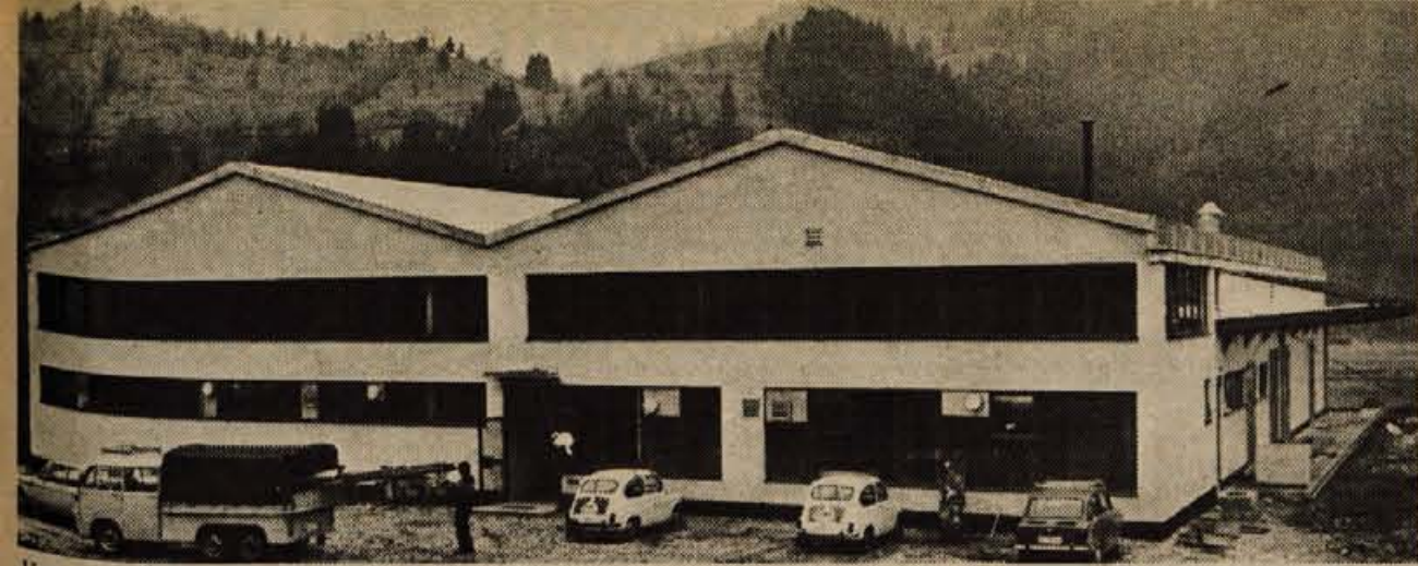
V nedeljo so v Zireh odprli nove proizvodne prostore tovarne Etiketa.