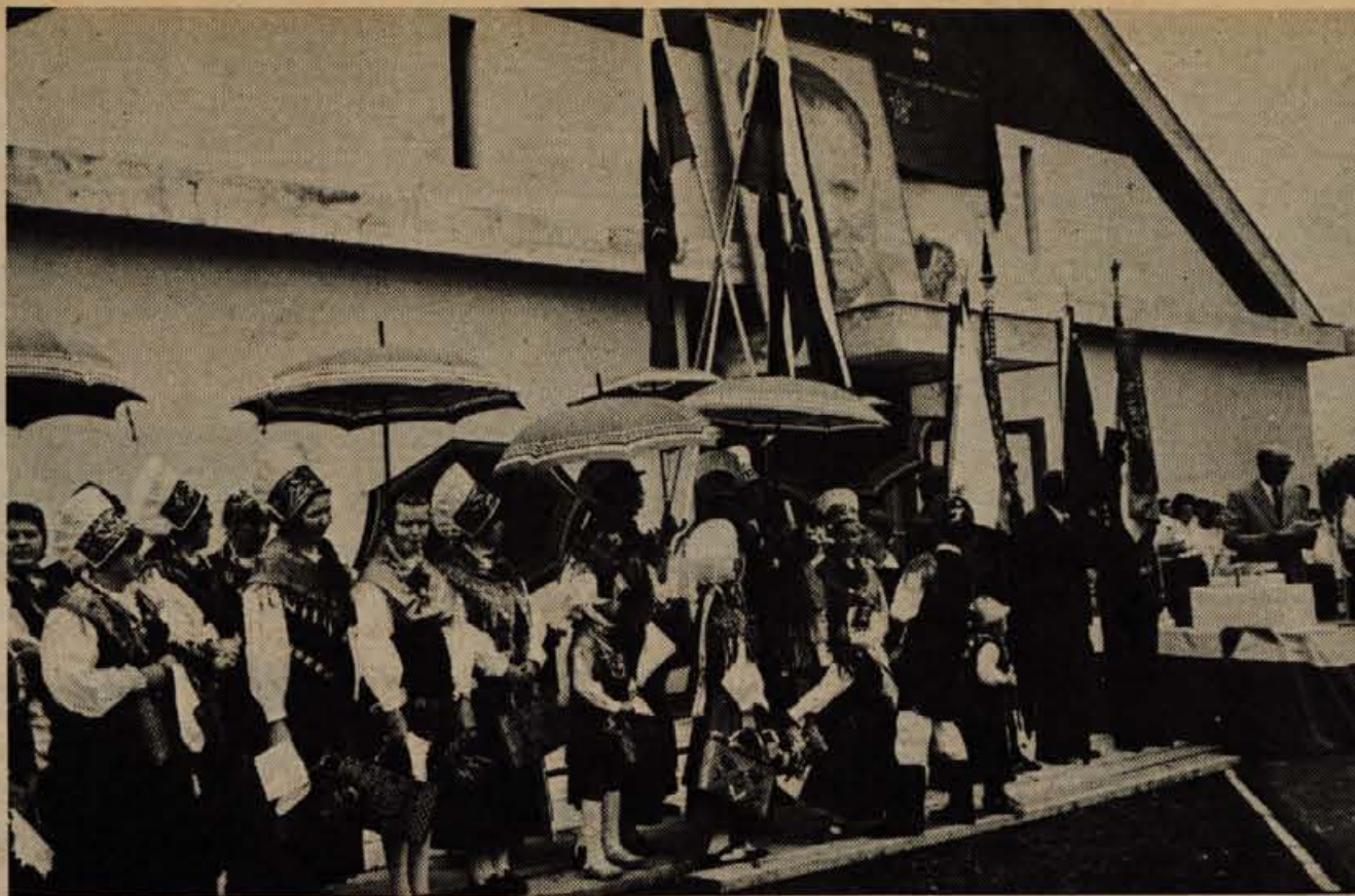
Svečanosti ob otvoritvi nove šole v Naklem so se v nedeljo dopoldne udeležili številni domačini in gostje

Osrednje proslave ob 30-letnici priključitve Istre, Slovenskega primorja, Reke, Zadra ter otokov Cresa, Lošinja in Lastova k Jugoslaviji bodo 29. in 30. septembra letos v Pazinu in Bujah pod pokroviteljstvom predsednika republike Tita. V Pazinu bodo 29. septembra odkrili spomenik istrskemu narodnemu heroju Joakimu Rakovcu. Naslednji dan pa bo v Bujah veliko ljudsko zborovanje, na katero bodo prišli prebivalci Istre, Slovenskega primorja in Reke.