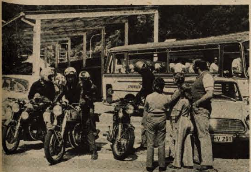
Na šestih gorenjskih mejnih prehodih je v šestih mesecih letos prestopilo mejo v obeh smereh več kot pet milijonov potnikov. Večji del prometa se odvija prek cestnih mejnih prehodov. Na sliki: mejni prehod Ljubelj je z 1,2 milijona potnikov v obeh smereh na drugem mestu med gorenjskimi mejnimi prehodi.

GLASILO SOCIALISTIČNE ZVEZE DELOVNEGA LJUDSTVA ZA GORENJSKO