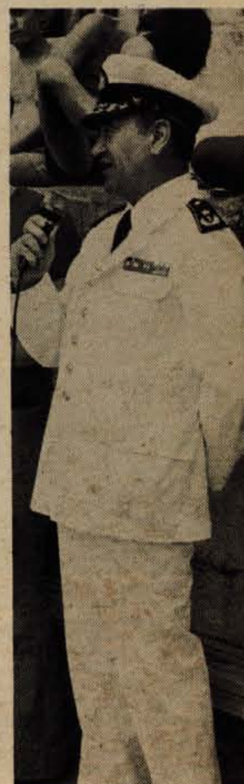
Sobotno svečano otvoritev II. državnega prvenstva v plavanju s plavutmi in potapljanju je pozdravil tudi kontraadmiral Jugoslovanske vojne mornarice Miroslav Radosavljevič.

Ženske — plavanje s plavutmi: 1. Slovenija 64, potapljanje: 1. Slovenija 48, 2. Hrvatska 22, skupni vrstni red: 1. Slovenija 112, 2. Hrvatska 22. D. Humer