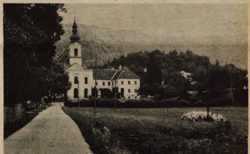
VELESOVO DANES — Primerjava s sliko iz Valvasorjevih časov kaže, da velesovski klošter ni kaj posebno spremenil svoje vnanje podobe; le gradu nad njim ni več