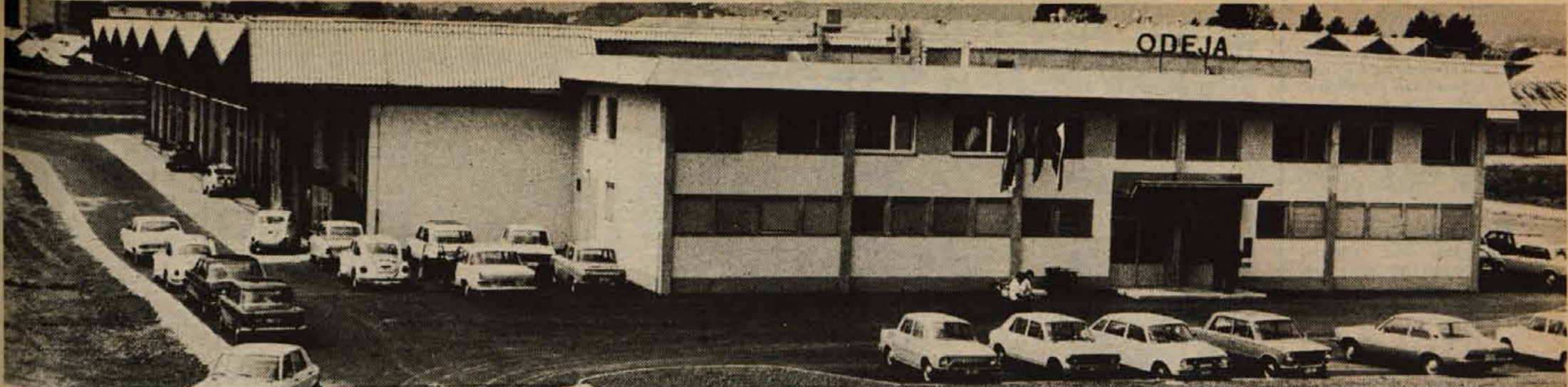
V soboto dopoldan so odprli novo postopje tovarne Odeja Škofja Loka, ki je stalo 8 milijonov dinarjev. Pod nadzorom podjetja Lokainvest ga je gradil domači SGP Tehnik.