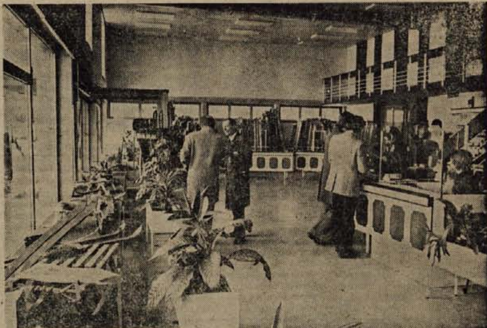
Nova Elanova športna trgovina v Begunjah.

merno z oddaljenostjo od Škofje Loke, torej ob občinskega središča. Vzrok bo najbrž skrit v preskromnem številu inšpektorjev (lani sta nadzor opravljala samo dva) ter v pomanjkljivi obveščeniosti ljudi. Zato odgovorni predlagajo dve novosti: Intenzivno tolmačenje pravic in dolžnosti potencialnih graditeljev ter seveda posledice, ki izhajajo iz neupoštevanja predpisov; formiranje posebnega sklada za rušenje nedovoljenih (črnih) gradenj. A preden bodo strokovnjaki sestavili predlog o višini omenjenega sklada, mora skupščina najprej odločiti, kakšno stališče bi kazalo zavzeti do kršilcev in katere od spornih stavb naj se dejansko podrejo. Cena rušenja naj bi bila okrog 600 din na ku- bični meter prostora. — or