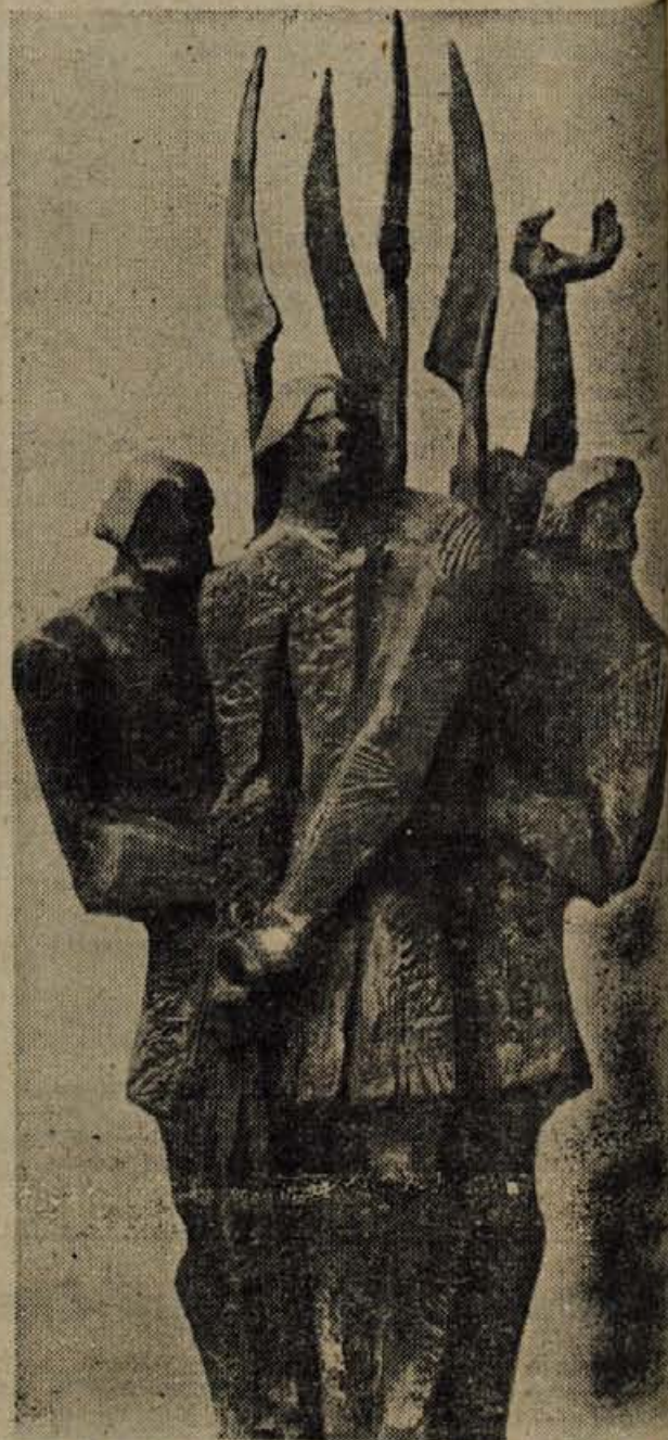
Osnutek Stojana Batiča za spomenik kmečkim uporom, naj bi ga postavili v središču Ljubljane.

Posebna žirija pri odboru za proslavo 500-letnice kmečke vstaje in 400-letnice slovensko-hrvatskega kmečkega punta pregledala osnutke za osrednji spomenik kmečkim uporom, ki naj bi ga letos postavili v Ljubljani. Sprejela je osnutek Stojana Batiča in Draga Tršarja. Ker sta oba osnutka ustrezna, žirija predlaga, da bi v Ljubljani postavili oba spomenika: spomenik Stojana Batiča v središču Ljubljane, spomenik Draga Tršarja pa na ljubljanskem gradu, ko bo leta dokončno urejen.