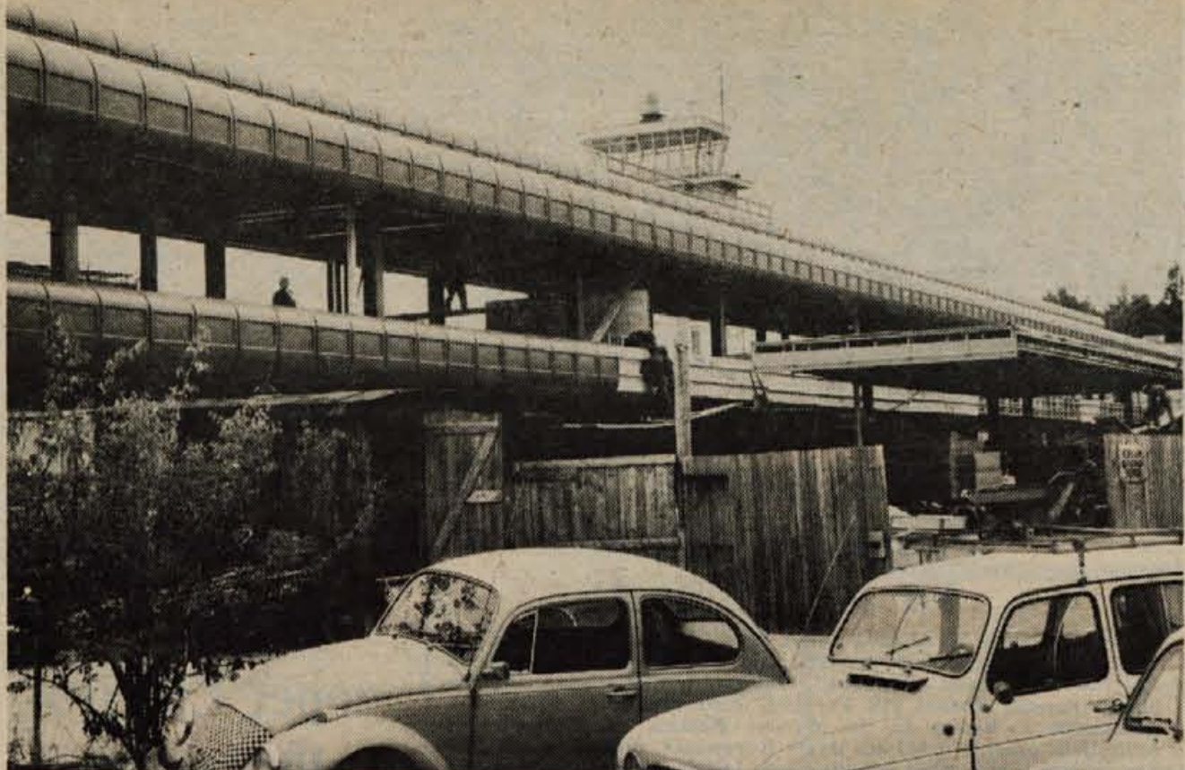
Nova pristaniška zgradba letališča na Brniku že dobiva dokončno podobo. Če bodo gradbena dela potekala še naprej tako kot doslej, bo stavba nared že spomladi prihodnje leto.