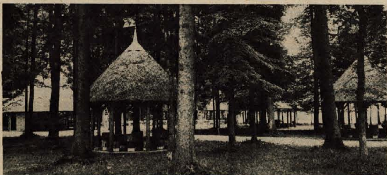
V brniškem gaju bodo odslej vsako soboto in nedeljo popoldne in zvečer družabna srečanja s pikniki, na katerih bodo obiskovalce zabavali znani ansambli.