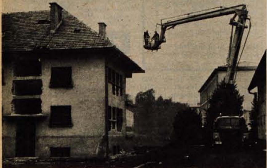
V kletnih prostorih je izbruhnil požar. Stanovalci so se zatekli v višja nadstropja. Medtem ko se gasilci v zaščitnih oblekah približujejo ognju, se hidravlična platforma pripravlja, da bo stanovalce rešila s strehe in jih v posebni košari prinesla na varno. (jk)

gasilca-reševalca več kot 20 metrov visoko. Poklicni gasilci so preizkusili tudi nove azbestne zaščitne obleke. Dva gasilca sta se v takih oblekah sprehodila skozi plamene, ki so nastali zaradi vžiga lahko vnetljivih tekočin. Sredi ognja je dosegla temperatura več kot 800 stopinj, vendar sta se gasilca vrnila nepoškodovana. Vaja je nedvomno dobro uspela. Številni gledalci ter predstavniki delovnih organizacij in ustanov so bili z znanjem in spretnostjo kranjskih poklicnih gasilcev nadvse zadovoljni. -jk