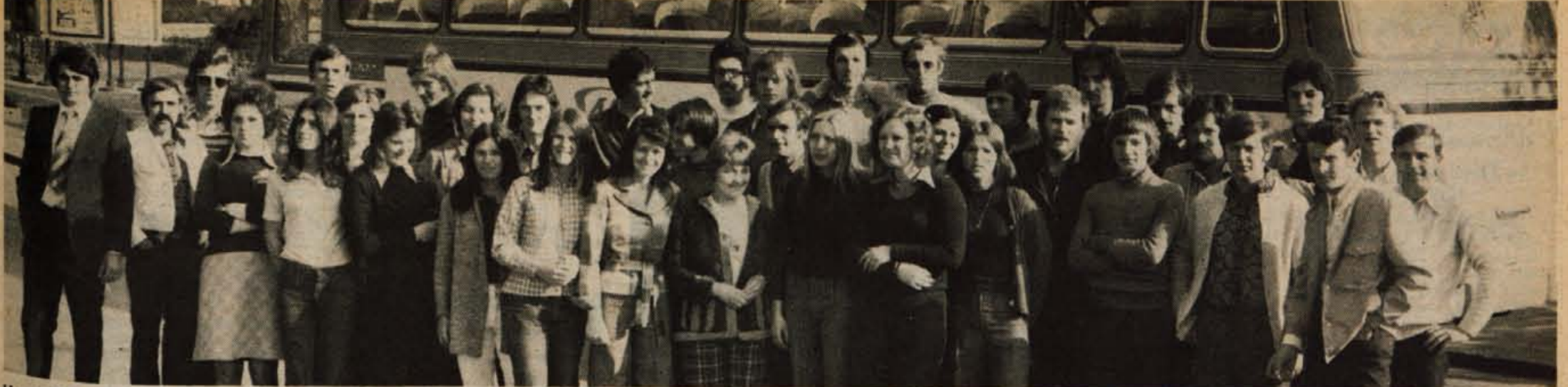
V četrtek je s posebnim avtobusom odpotovala iz Kranja v Bitolo skupina kranjskih mladink in mladincev, ki se bo udeležila 19. festivala Bratstva in enotnosti.