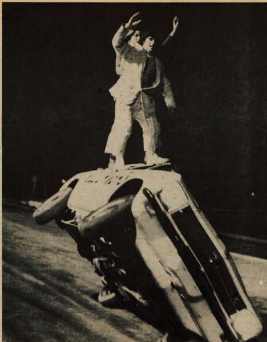
Vožnja po dveh kolesih in še dva na njem — vse skupaj prav gotovo ni enostavna šala