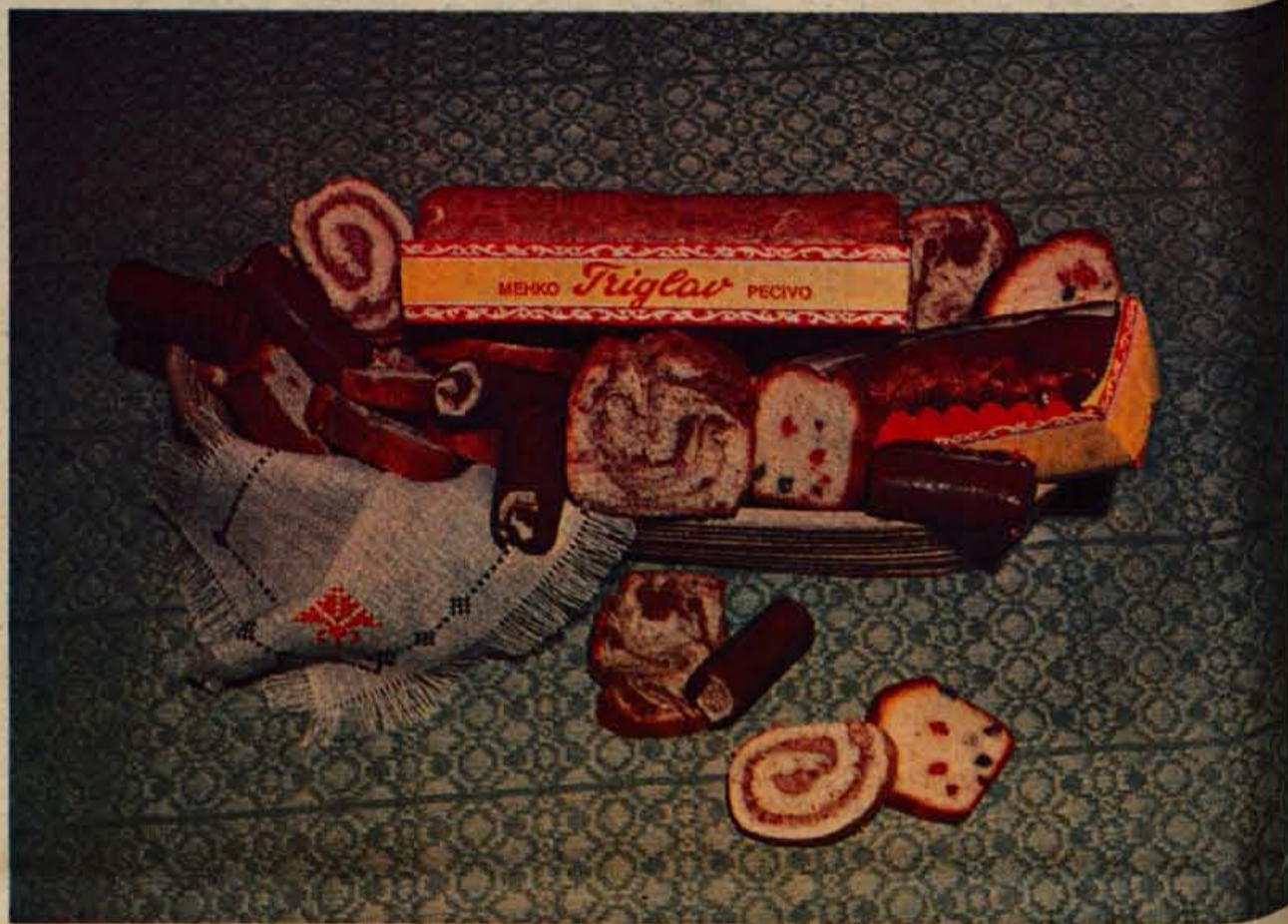
Triglav pecivo, ki ga že vsi dobro poznamo

In kaj vse spada pod TRIGLAV pecivo? To so vse rolade z različnimi nadevi, pa mini rolade s čokoladnim prelivom, tortne podlage, pripravljajo pa še nove posladke, kot so obliti kolački, rožinčki, vetrčki itd. Rok trajanja tega peciva je 15 dni, čeprav bi bil lahko 30. Toda sami so zahtevali krajši rok, ker vsekakor žele obdržati kvaliteto. Pri 30 dneh pecivo sicer organoleptično še ustreza, začne pa izgubljati aromo in sočnost. Poudariti je treba, da uporabljajo za pripravo biskvitnega testa same najboljše sestavine in nobenih umetnih primesi. Vsakokrat zamešajo s svežimi jajci, kajti le-ta dajejo pravo strukturo testa in pecivu pravo vezivo. V podjetju se dobro zavajajo, da jim bo le kvaliteta omogočila razširiti in obdržati tržišče.