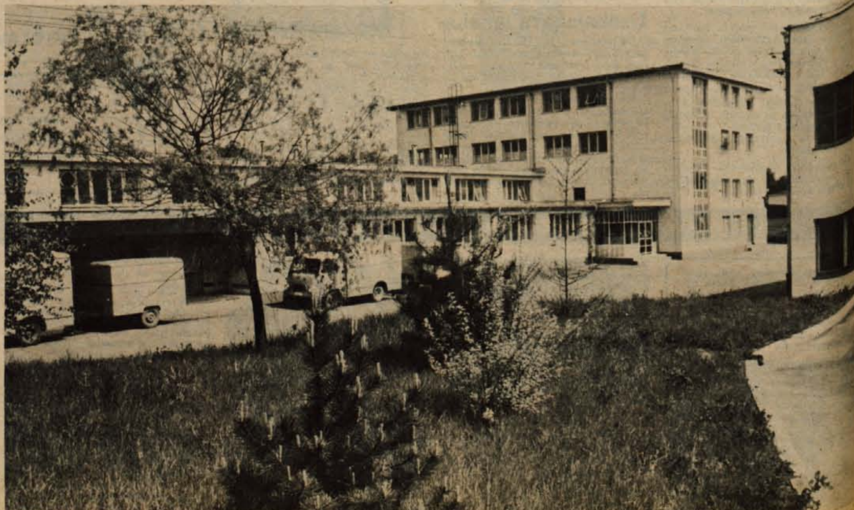
V leščanski pekarni spečejo letno kar 4500 ton kruha

Pekarstvo kot tako je za zdaj urejeno. Radi bi le prešli na pakiranje kruha. Morda za začetek le delno, da bi potrošnik spoznal prednosti takega kruha. Nadaljnji razvoj mehkega peciva pa je neposredno vezan na rekonstrukcijo Tovarne čokolade GORENJSKA, ki je danes že TOŽD ZITA. Imajo zastarelo strojno opremo in lokacija je neprimerena. Niso dosti vlagali v razvoj, sedaj pa imajo v srednjeročnem programu do leta 1975 kompletno rekonstrukcijo s tem, da bodo zidali nov objekt zraven pekarnice in bodo tako tesno povezani lazje in še več proizvajali.