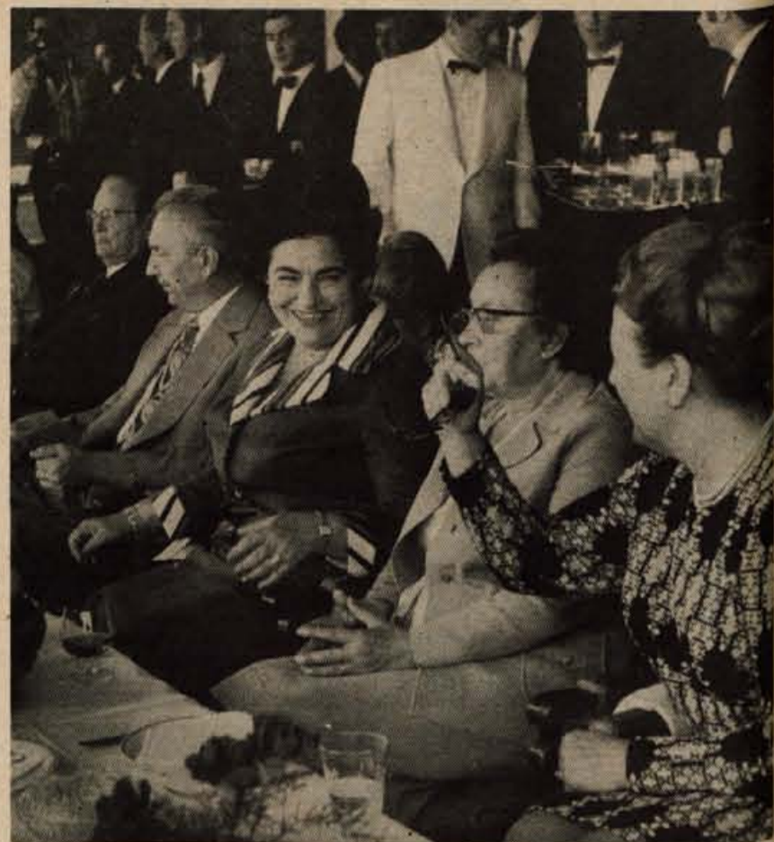
V hotelu Toplice sta se Tito in Gierek s spremstvom zadržala dobro uro