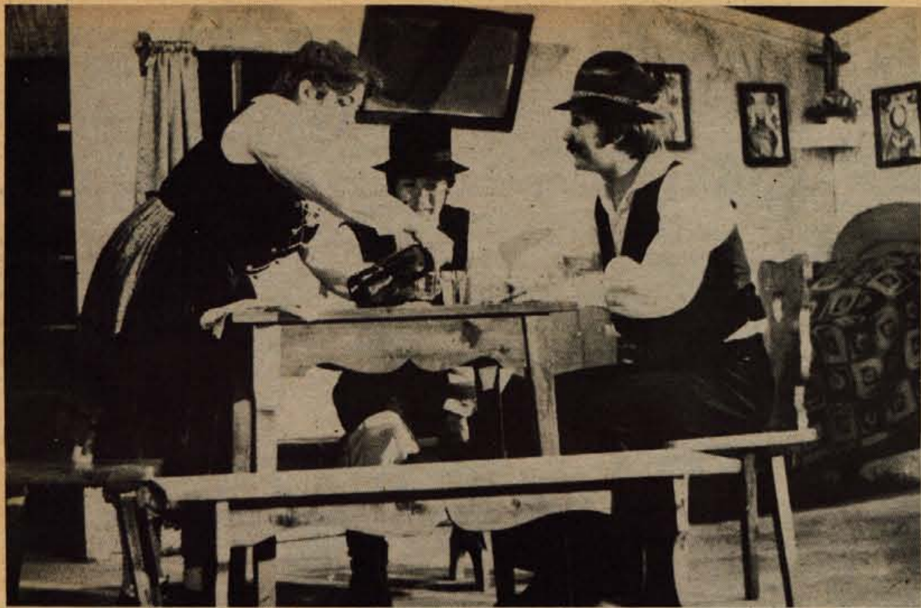
Prizor iz »Vdove Rošlinke« v uprizoritvi Prosvetnega društva Jezerško.