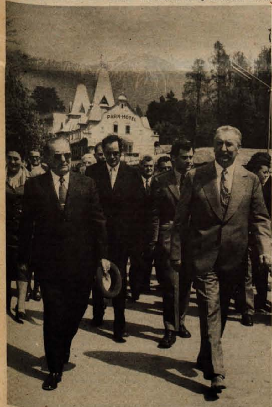
Predsednik Tito in njegov gost s Poljske Edward Gierek sta v nedeljo dopoldne obiskala Bled

Prvi sekretar centralnega komiteja Poljske združene delavske partije Edward Gierek z ženo in spremstvom je na povabilo predsednika SFRJ in predsednika ZKJ Josipa