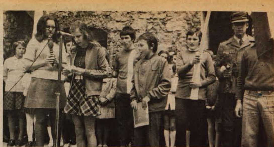
Kranj, Škofja Loka, 8. maja — Sprejem štafete mladosti na Trgu revolucije v Kranju