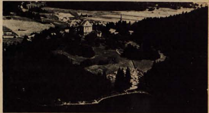
Blatograd (nem. Moosburg), 6 km severno od Vrbskega jezera. Semkaj je pomladi l. 1832 pripotoval Prešeren s prijateljem Slomškom, da bi obiskal pesnika in jezikoslovca Urbana Jarnika, ki je tu župnikoval.