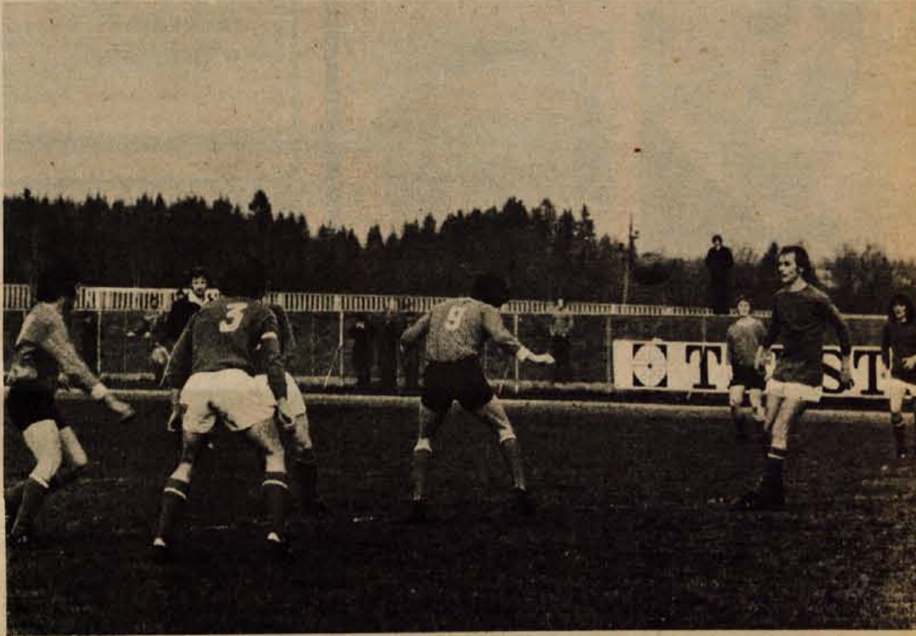
Kranjski republiški ligaš je v nedeljskem srečanju s Slavijo zamudil izredno priložnost za zmago.

Menimo pa, da bodo tudi ta problem rešili, saj so košarkarji Triglava lahko za zgled ostalim klubom v kranjski občini pri vzgoji lastnih igralcev. -dh