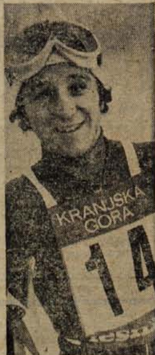
Sloviti španski tekmovalac Francesco Fernandez Ochoa, narodni junak in dobitnik zlatega odličja lanskega olimpijskega slaloma, na letošnji kranjskogorski prireditvi ni imel sreče. Medtem ko je v veleslalomu zasedel šele petnajsto mesto, je v slalomu celo ostal brez uvrstitve. Kljub silovitemu startu ga je že pri osmih vrticah polomil, vrglo ga je s proge.