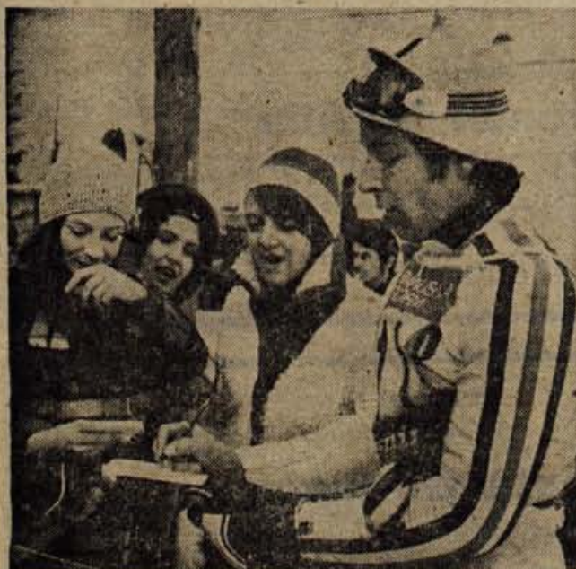
Lanskoletni zmagovalac veleslaloma v Sapporu Italijan Gustavo Thöni je zmagal tudi na vitranškem veleslalomu. Z drugim mestom v slalomu je osvojil letošnjo lovoriko Vitranc. Simpatični carinik je imel po tekmi obilo dela z dajanjem avtogramov.