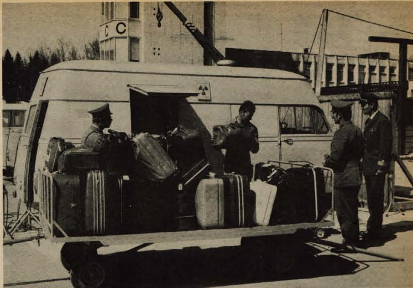
Pregled prtljage na letališču: uslužbenec letališča postavlja kovčke v prostor z rentgensko žarnico.

Zadnje dneve, ko se je pripravljala na razstavo, je delal do treh zjutraj. Bil je komunist in je pobegnil v Francijo po Francovi zmagi v Španiji. Zaklel se je, da ne bo odšel v Španijo, dokler ne bo postala demokratska republika.