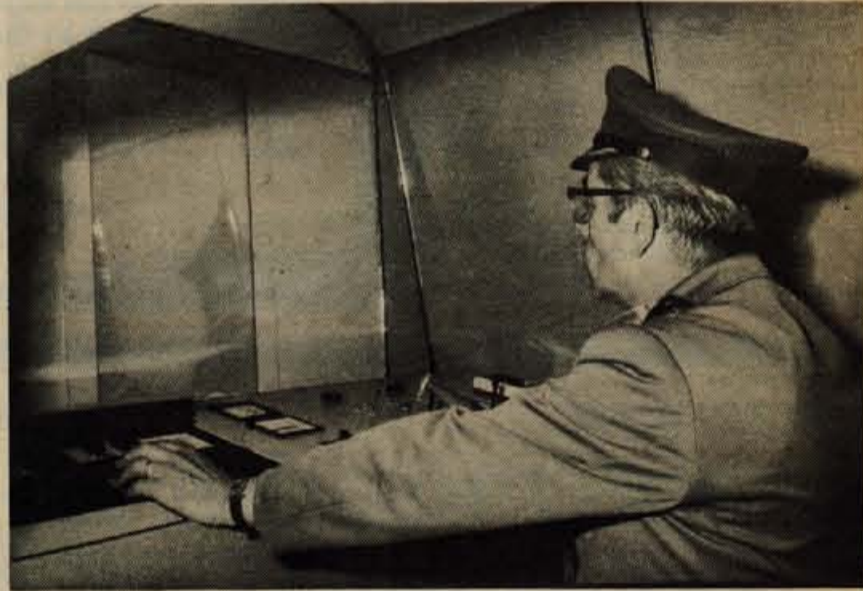
Operaterjevo delo z rentgensko napravo je zelo odgovorno.

Osebnih dohodkov je določen s pravilnikom o delitvi osebnih dohodkov. Kandidati pod 1., 2., 3. in 4. naj pošljejo ponudbe z dokazili o izpolnjevanju razpisnih pogojev in z opisom dosedanjega dela v 15 dneh od dneva objave razpisa razpisni komisiji. Za kandidate pod 5., 6. in 7. velja razpis do zasedbe delovnih mest.