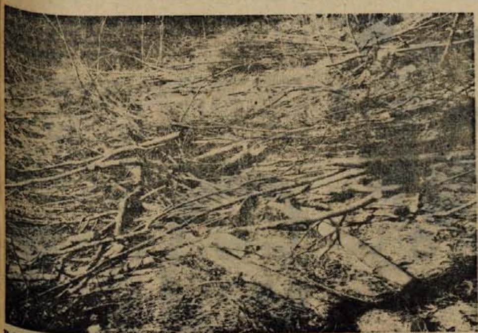
Požar v Kokri se na srečo ni razširil in zato je bila škoda manjša. Gasilci, vojniki in občani so plamene mirili s protipožarnimi metlami, širjenje požara pa so preprečili tudi s sekanjem dreves.