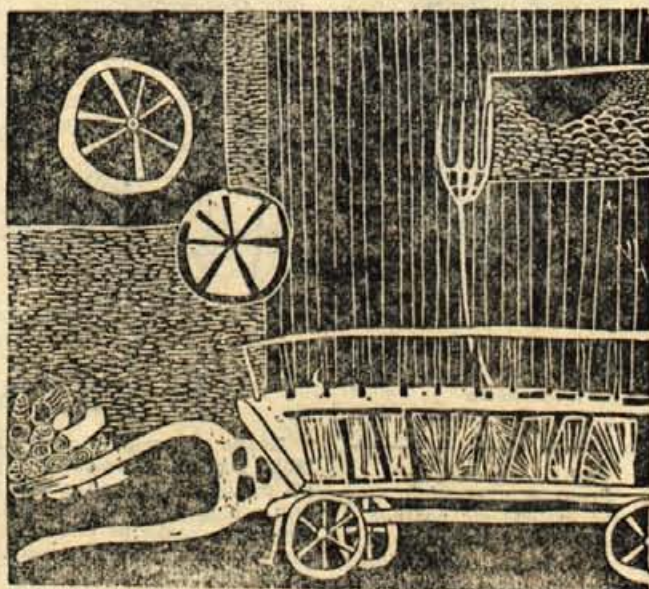
Eva Kodrič: Dvorišče (Center za estetsko vzgojo Kranj)

Najbrž poznate dela ameriškega pisatelja Ernesta Hemingwaya (1898-1961) npr. Starec in morje, Komu zvonit itd. Bil je tudi novinar. Tako mu je ameriška revija Sports Illustrated plačala 30.000 dolarjev. Prispevek je imel 2000 besed in je torej dobil za vsako besedo okrog 250 novih dolarjev.