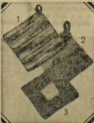
Iz barvastih ostankov bombažne preje so mimogrede nakvačkane majhne prijemalke za vroče lonce

Čeprav nas spremljivo in ne posebno mrzlo vreme čedalje bolj spominja na pomlad, pa nas temperature okoli ničle še vedno opozarjajo, da zima še traja. Se bomo imeli hladne noge, prezeble prste, izsušeno polt in od mraza rdeč nos. Če nos pordeči prav vsakič, ko stopite ven, je res neprijetno. Poskusite z oživiljanjem cirkulacije tako, da zvečer masirate nos s kremo. Zaradi take nevšečnosti še ni treba ob mrazu tihati med štirimi zidovi, pač pa je treba pogumno tudi na mrazu razgibati telo. Preden pa gremo na mraz, kožo na obrazu zavarujemo z mastno kremo. Na nos pa nanesemo kremo, ki vsebuje okoli pet odstotkov ihtiola. Takšna krema, pripravijo jo lahko v lekarni, je imenitna tako za mraz kot za sonce. Pred sprehodom po mrazu zavarujte tudi ustnice z vazelino ali s posebno kremo za ustnice.