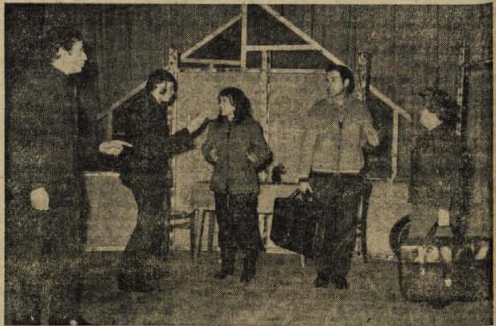
Igralska skupina iz Sv. Duha se bo domačinom jutri predstavila s premiero komedije »Lušno je tam na deželi«. Posnetek smo naredili med eno od zadnjih vaj.