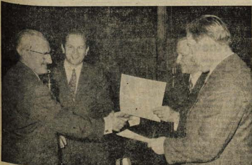
V četrtek popoldne so ob zaključku šestih letnih sindikalnih športnih iger v Kranju najboljšim posameznikom in ekipam podelili priznanja. Na sliki: V balinanju je bila najboljša ekipa sindikalne organizacije v Tekstilindusu.