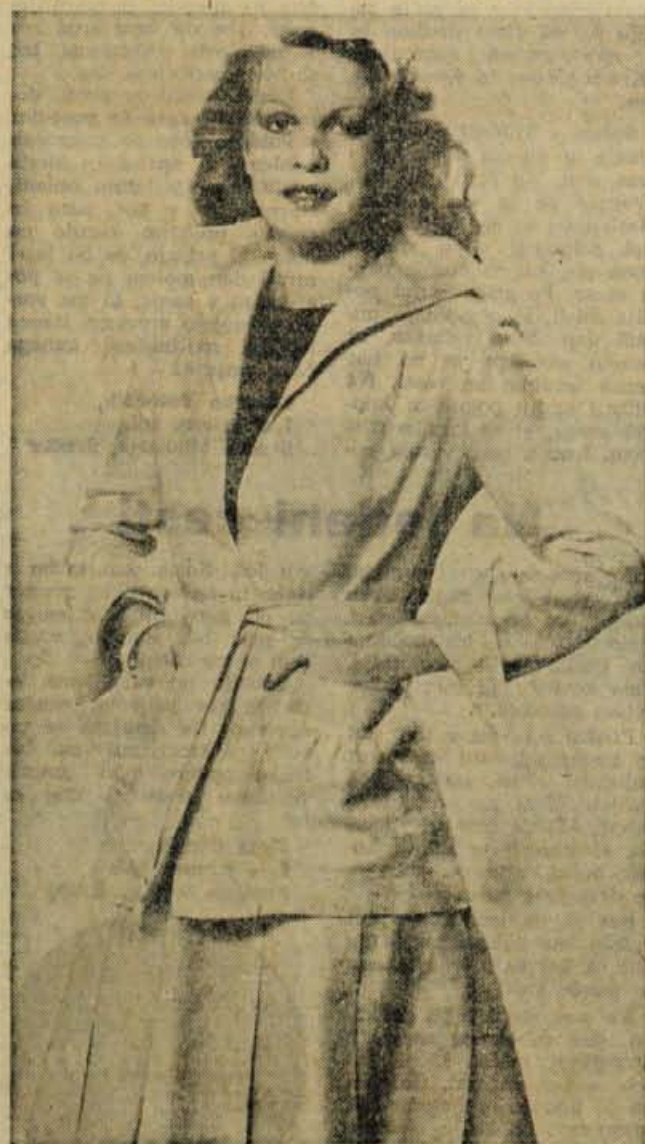
Za vse, ki nestrpno čakajo na prve namige o novi modi: plateni kostim za poletne dni z nagubanim krilom, čez boke segajočo jopico s pasom — in svetle barve.

Ko sejanci dovolj zrastejo in prekrijejo zemljo, jih je treba pikirati. S tankim ostrim lesom vtisnemo sadike v zemljo, lahko tudi po dve tri skupaj. Med sadikami naj bo za prst ali dva razmika. Ob primerni oskrbi bomo lahko vzgojili razne sadike doma, še najlaže v topli gredi.