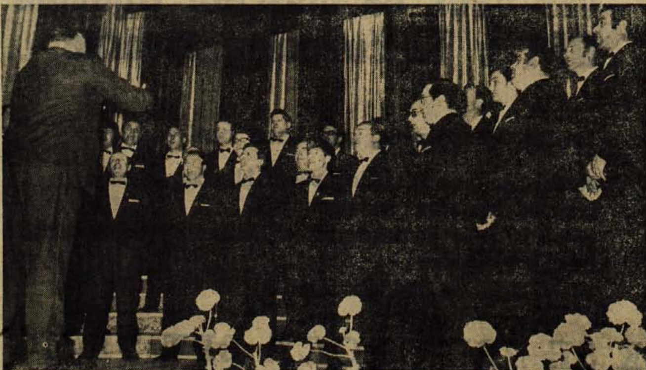
Pevski zbor Vasilij Mirk z Proseka — Kontovelja nad Trstom pod vodstvom dirigenta Ignaca Ota. — Foto: F. Perdan