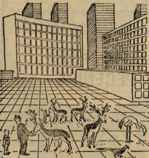
— Tu je bil nekoč park

V požaru, ki je zajel šolo v nekem pariškem okraju, je izgubilo življenje 17 učencev in štiri odrasle osebe. Zdaj so odkrili tudi vzrok te strašne nesreče, kakršne v Franciji ne pomnijo. Dva dijaka, stara 14 let in pol, so obtožili, da sta podtaknila ogenj. Pri požigu je sodelovalo sedem učencev. Za tako dejanje so se odločili, ker je enega od njih učitelj baje brez vzroka kaznoval in zato so zasnovali maščevanje. Starši v požaru umrlih otrok pa bodo tožili odgovorne, ki so dovolili gradnjo šole iz lahko vnetljivega materiala.