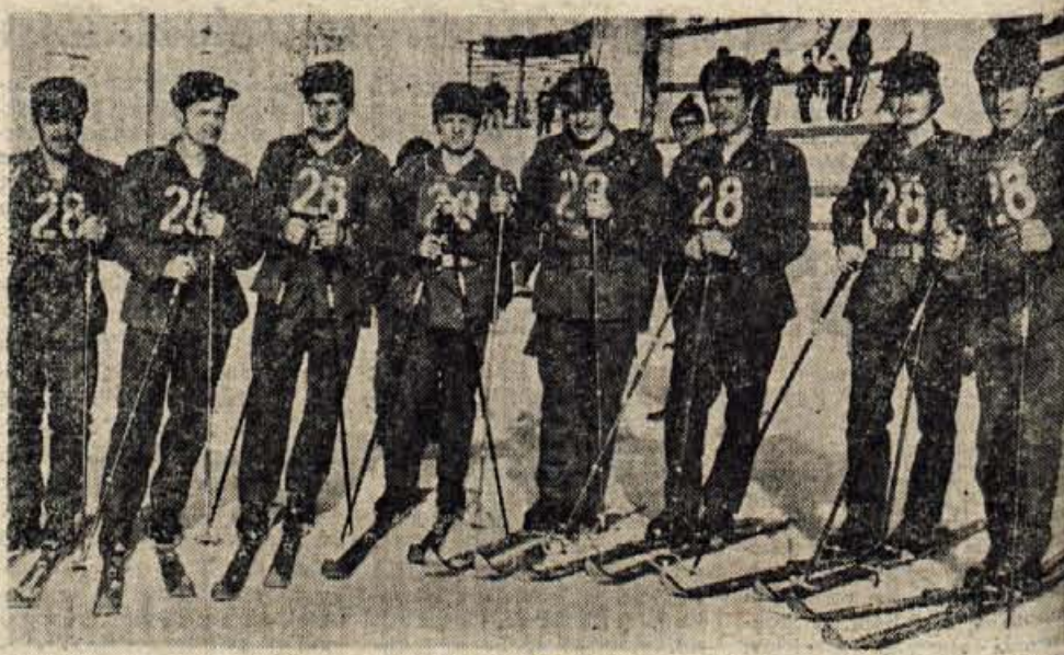
Člani favorizirane patrolje partizanskih enot Radovljica so tokrat popolnoma odpovedali ter osvežili šele 7. mesto.