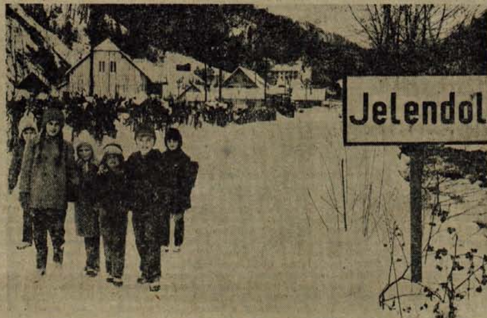
V zgornjem delu se dolina Tržiške Bistrice razširi in odpre. Tu je nastala vasica Jelendol. Vsaka hujša zima povzroča najmlajšim obilo preglavic, saj morajo peš do Tržiča

Mogočna Bornova graščina je pripravljena sprejeti stanovalce, vendar se le redki odločajo za bivanje v tako oddaljenem ter od sveta odrezanem kraju. Vsa stanovanja v graščini tako niso zasedena. Težko je zasukati kolo zgodovine in ljudi pri-