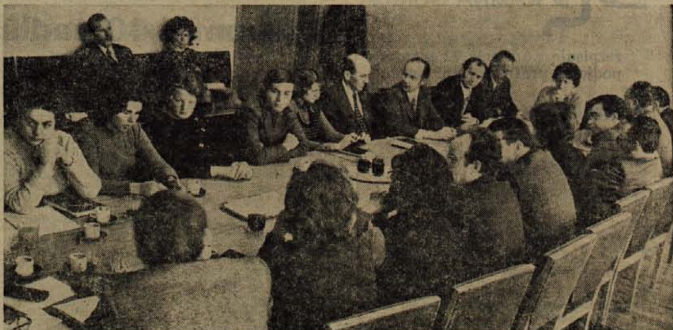
Svet Centra za socialno delo v Kranju je skupaj s povabljenimi predstavniki skupščine občine Kranj in predstavniki drugih družbenopolitičnih organizacij na torkovi slavnostni seji ob deseti obletnici ustanovitve Centra razpravljal predvsem o nalogah tega strokovnega organa pa tudi drugih dejavnikov na tem družbenem področju. Ob tej priložnosti so Centru izrekli priznanje za opravljeno delo.