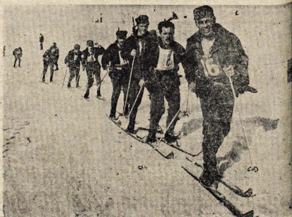
Ekipa UJV Kranj, sestavljena iz predstavnikov postaj milice z različnih koncev Gorenjske. Je kot edino moštvo svoje vrste zasedla solidno 5. mesto.