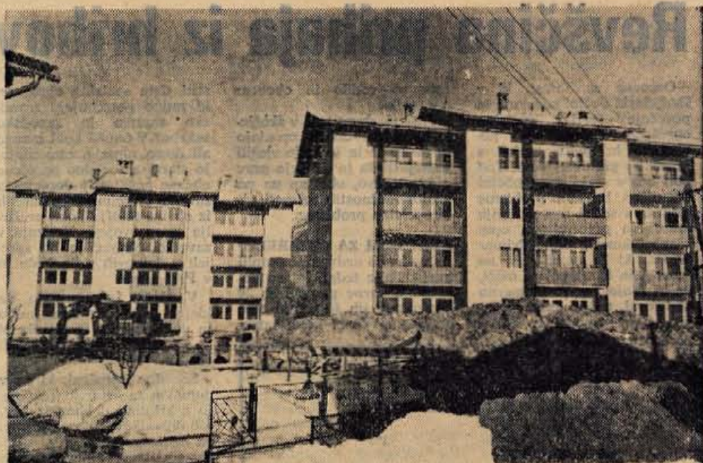
Konec minulega leta sta bila v Lescah vseljena dva stanovanjska bloka. V vsakem je 12 stanovanj. Oba stanovanjska objekta je iz amortizacijskih sredstev, posojila in lastnih sredstev zgradila tovarna Veriga Lesce za svoje delavce.

REKLAMNA PRODAJA IZDELKOV SLOVITE ANGLEŠKE KONZERVNE INDUSTRIJE HEINZ v oddelku Samopostrežba