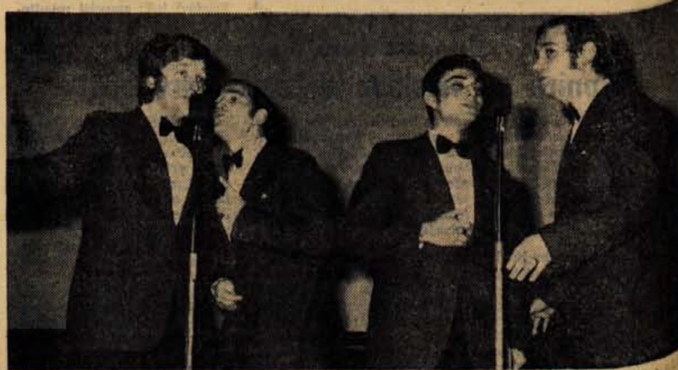
Na petkovi prireditvi za varčevalce v kinu Center v Kranju je med drugim nastopil tudi New swing quartet — Foto: F. Perdan