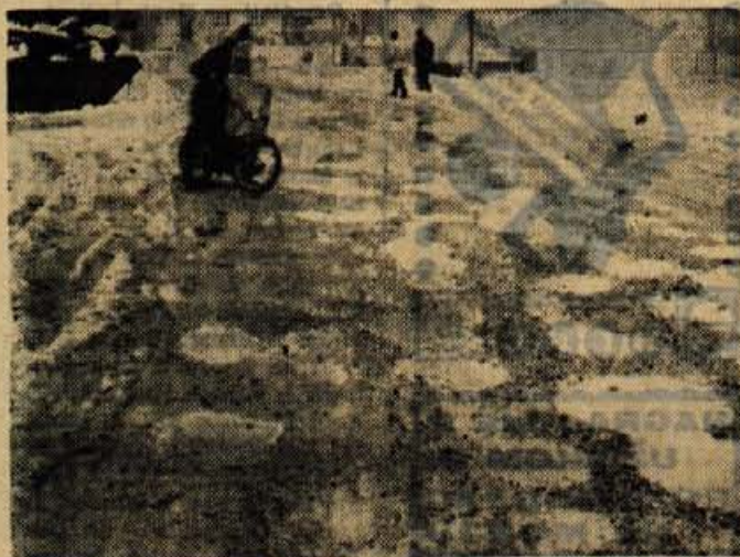
Tuči sneg ni mogel pokriti lukenj na cesti proti Tekstilindusu in Savskemu logu.