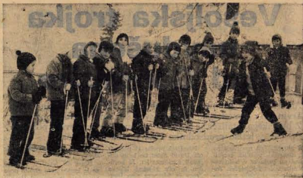
Najmlajši smučarji so popoldansko šolo smučanja vzeli čisto zares.