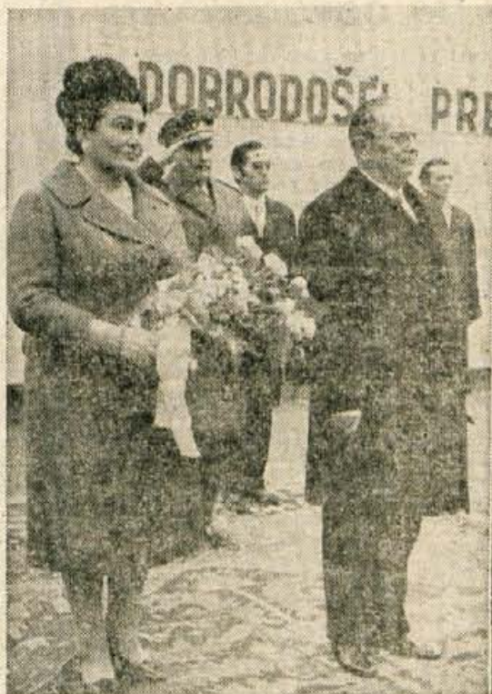
Med igranjem državne himne