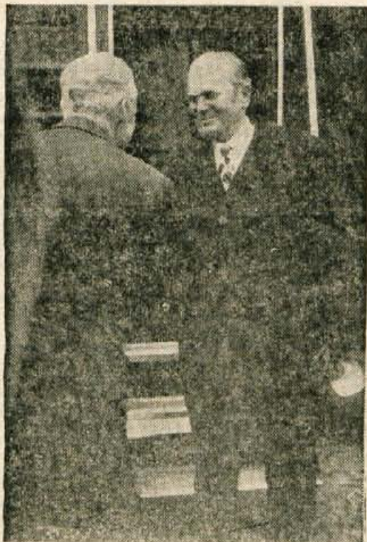
Predsednika Tita je najprej pozdravil predsednik slovenske skupščine Sergej Kraigher