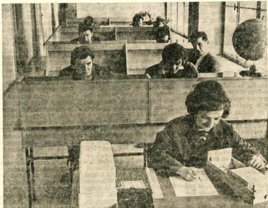
Studijska knjižnica v Kranju.