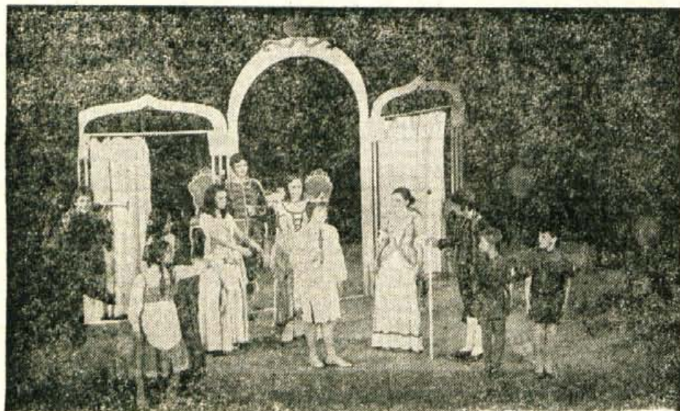
Prizor s predstave CESARJEVA NOVA OBLACILA, ki jo je uprizorila Mladinska skupina Prešernovega gledališča v okviru kulturnega dne na osnovni šoli Davorin Jenko v Cerkljah.