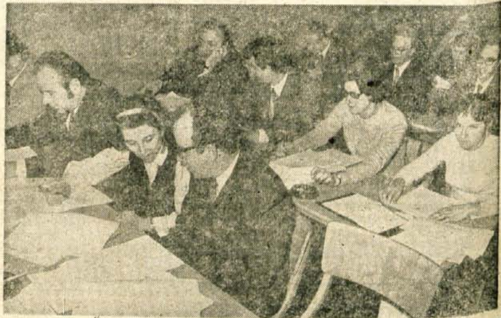
Delegati iz sindikalnih organizacij na konferenci, kjer so razpravljali o stanovanjski politiki v občini.