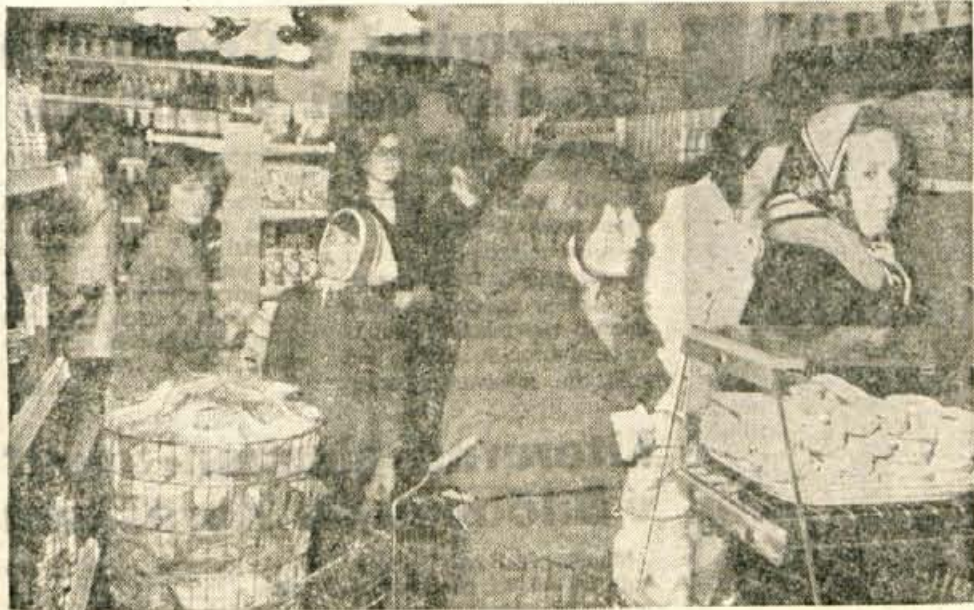
Notranjost prenovljene trgovine v Stražišču.