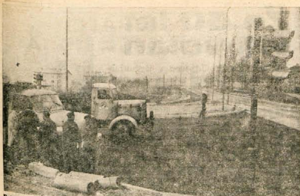
Dela na kranjski obvoznici gredo h koncu. Pred dnevi so delavci položili še zadnje metre grobe asfaltne plasti in postavili v križišču semaforje. Obvoznica bo dobila svoje uporabno dovoljenje seveda šele takrat, ko bo položena še fina plast asfalta. To delo pa se je zaradi trenutnega slabega vremena precej odmaknilo, s tem pa tudi otvoritev tja do konca leta ali še dlje.