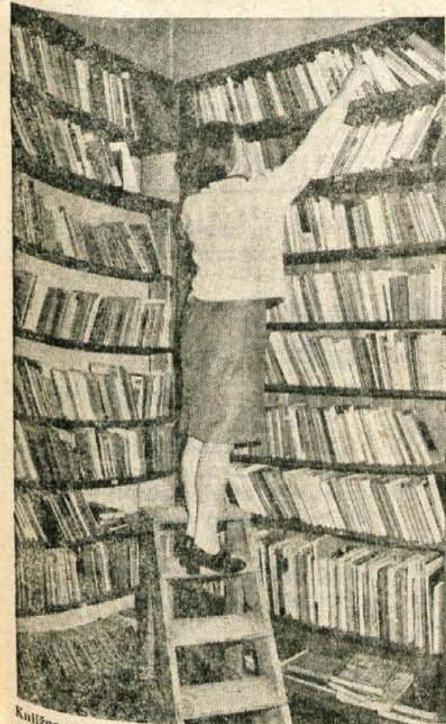
Begunjska knjižnica se stiska v sobici, ki meri komaj 5 kvadratnih metrov. V tem prostoru je natlačeni prek 2000 knjig.

Seveda pa ob tem ne bomo smeli pozabiti na podružnične knjižnice, vendar menim, da bomo uspeli le ob večji zavzetosti krajevnih skupnosti, družbenopolitičnih organizacij in občine.« L. Bogataj