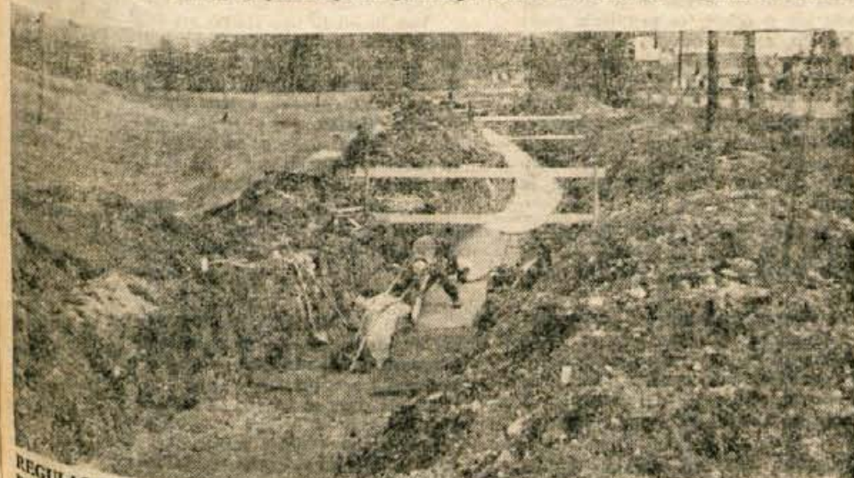
REGULACIJA POTOKA RECICA — Na Rečici pri Bledu bodo uredili strugo potoka Rečica. Potem nameravajo razširiti cesto na Rečici in urediti pločnik. Ta cesta, ki vodi proti Gorjam in Zatrniku, je zadnje čase zelo prometna in preozka. Se večji promet po njej pa pričakujejo pozimi, ko bodo oživila smučišča in žičnice na Zatrniku. Ureditev oziroma regulacijo potoka investira krajevna skupnost Bled. Vrednost del pa bo znašala okrog 180.000 din.