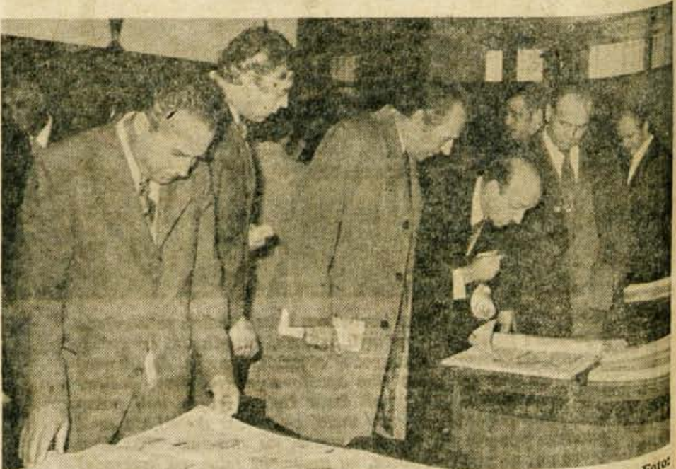
Uredništvo Glasa je v svojih novih prostorih pripravilo tudi priložnostno razstavo.