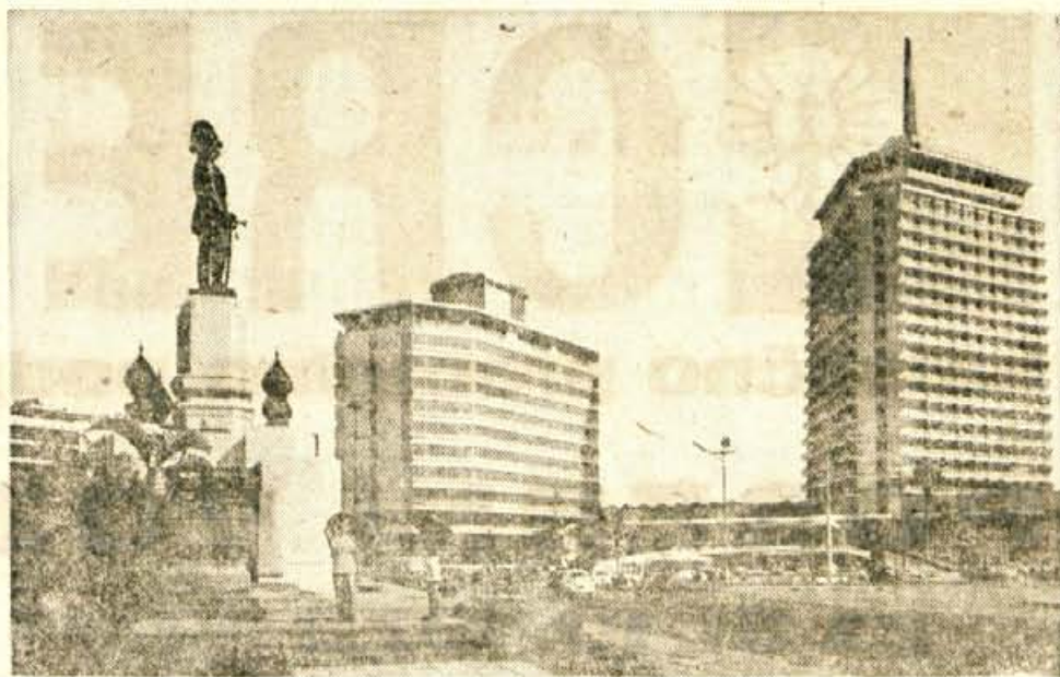
Bangkok ima več obrazov: stare, tradicionalne, s posebnostimi orientalske kulture izpolnjene četrti, predel, poln sanjsko lepih in enkratno bogatih budističnih svetišč in pagod ter seveda naselja novejšega datuma, kjer vplivi zahodne civilizacije in omike nezadržno izpodrivajo tradicionalne azijske poteze in arhitekturo.

Ob prebiranju prejšnjega poglavja ste si bržkone ust-