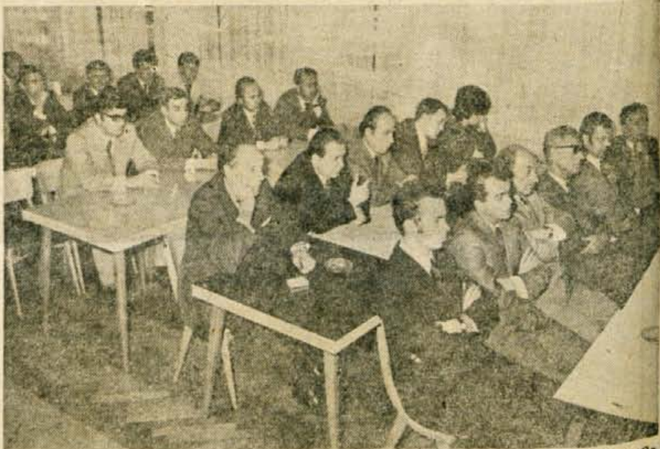
Slavnostne seje delovne enote Glas so se udeležili sodelavci in družbenopolitični delavci Gorenjske.