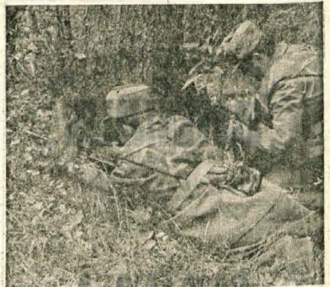
Cez jaso, ki jo je »držal na muhi« tale puškomitraljezec, bi se ne mogla izmuzniti niti miš — kaj šele človek.

»Predvsem smo hoteli v praksi preizkusiti znanje, kondicijo in spretnost posebne protidiverzantske čete — in