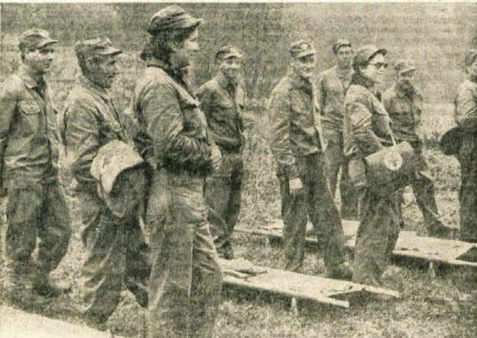
Bolničarji, pripadniki sanitetnega voda civilne zaščite z Jezerskega, v soboto sicer niso imeli pravega dela, v resničnem spopadu pa bi bila njihova navzočnost gotovo nadvse pomembna.