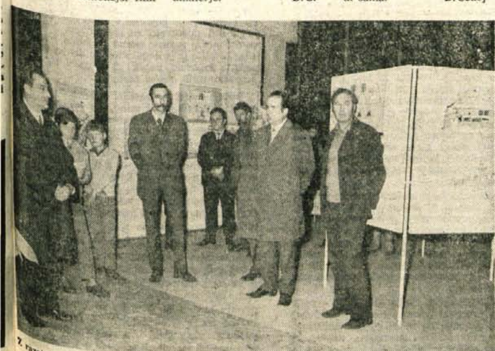
Razstave otroških risb v tržiškem paviljonu NOB. — Foto: F. Perdan

Člani filmske skupine Odeon bodo do konca leta organizirali še več klubskih večerov amaterskega filma. Novembra in decembra bodo pripravili tudi tečaj za kinoamaterje. D. S.