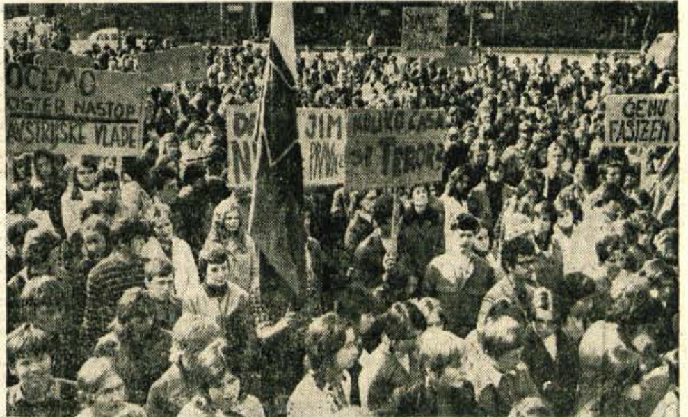
Na včerajšnjem protestnem zborovanju v Kranju se je zbralo več tisoč dijakov ter drugih občanov.