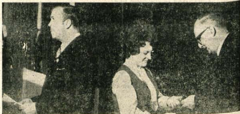
Na letošnji krvodajalski proslavi v Kranju, ki jo je organiziral občinski odbor Rdečega križa Kranj, je prejelo značke 450 krvodajalcev, priznanja za delo pa 12 krajevnih organizacij RK v občini.