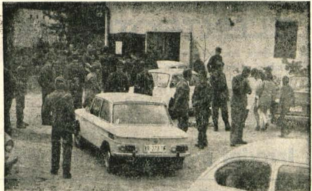
Po končani vaji so se vse skupine partizanskih enot zbrale v prostorih družbenih organizacij v Podljubelju.