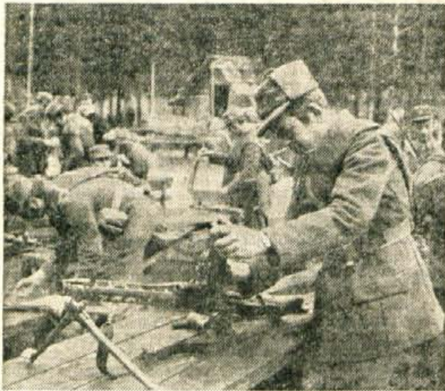
Puška je vojakov najboljši prijatelj in zaveznik, vendar zahteva skrbno nego. Zato ni čudno, da so po končani vaji borci —kljub lakoti in utrujenosti — najprej očistili in namazali orožje. Lastno udobje v obliki čaja in golaža je prišlo na vrsto šele kasneje.