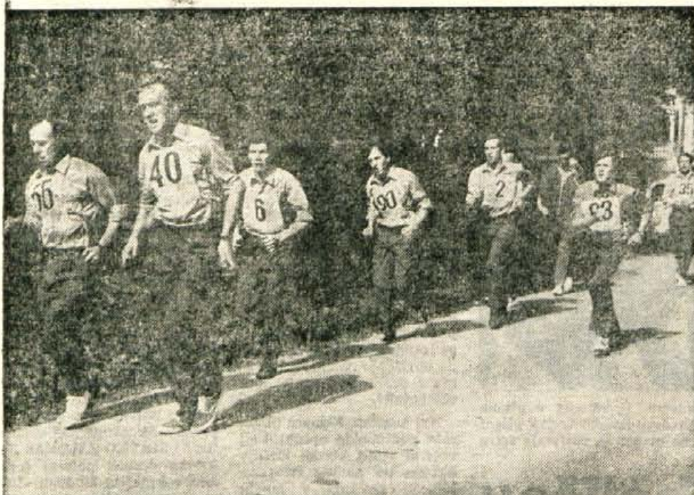
Med najbolj zanimivimi in napetimi tekmovanji na 4. srečanju poštarjev — športnikov iz Kopra, Nove Gorice in Kranja, ki je bilo v soboto na Bledu, je bila hitra hoja okrog jezera. Na 6 kilometrov dolgi progi so bili najhitrejši Koprčani, Kranjčani pa so se morali zadovoljiti s tretjim mestom. Najhitrejši tekmovalce je progo prehodil v 32 minutah in 50 sekundah. (Jk)