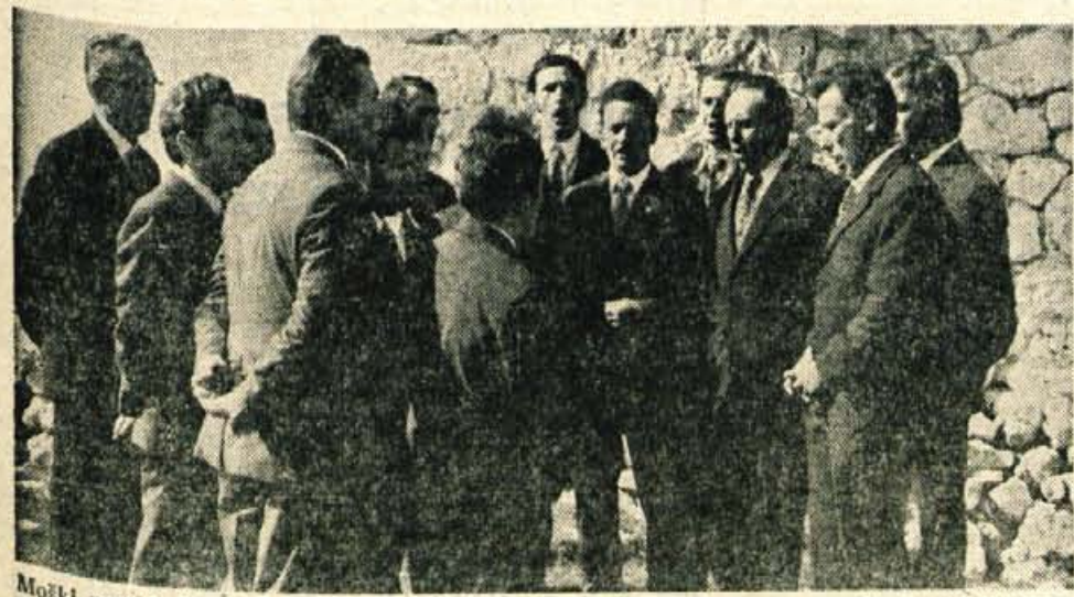
Moški pevski zbor Davorin Jenko iz Cerklj je s svojim nastopom pomagal ustvariti prijetno razpoloženje med gosti.