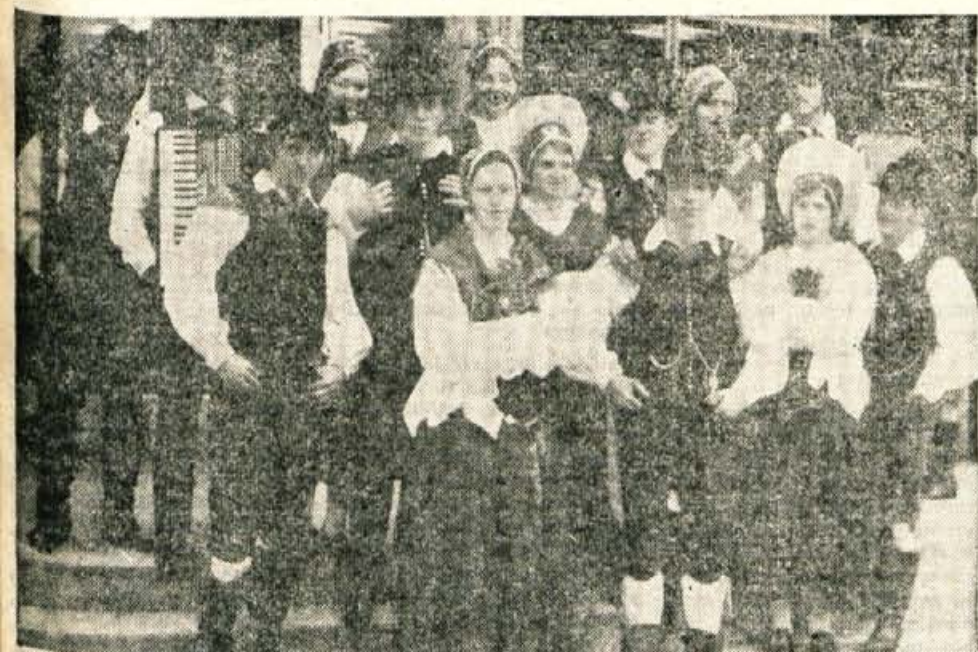
Folklorna skupina iz Gorij je prav gotovo ena izmed najbolj prizadevnih in delovnih folklornih skupin. Letos so imeli že približno 50 nastopov po vseh krajih Gorenjske in drugod. Njihove nastope niso zahtevali plačila, denar pa, ki so ga zbrali iz prostovoljnih prispevkov organizatorjev, so namenili v skupno blagajno. Z njim bodo plačali stroške izleta na Dunaj in Bratislavo.