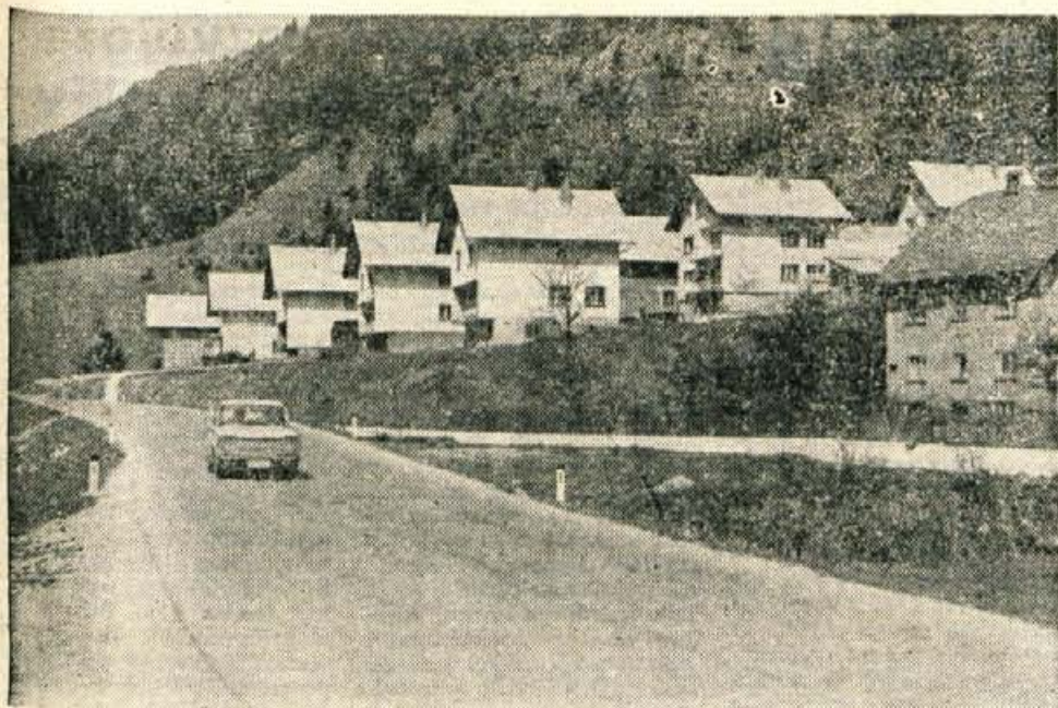
Na širšem območju Jesenic so za zidavo zasebnih stanovanjskih hiš določena področja na Bregu, na Lipcah, Koroški Bell, za progjo, na Pejcah, Zerjavcu in v zahodnem delu Hrušice. Na sliki: na Hrušici je zrastle kar pravo naselje. Prebivalci tega kraja so zadovoljni predvsem zaradi lepe sončne lege in zaradi dobrih avtobusnih zvez.