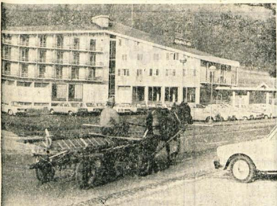
V Kranjski gori je v teh dneh mrtva turistična sezona. Zasebniki in gostinci se že pripravljajo na novo turistično sezono. Na sliki: v vprežnim vozom mimo do sedaj najlepšega hotela Larix v Kranjski gori.