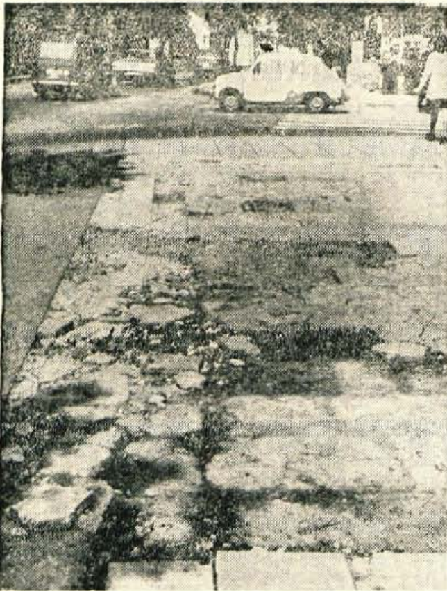
Sneg, mraz in dež so v nekaj letih takole razrahljali del ploščadi na Trgu revolucije v Kranju. Kako jo bodo uredili, je bilo postavljeno vprašanje tudi na eni od sej kranjske občinske skupščine. Odbornik je takrat predlagal, naj ne bi znova položili gladke plošče, ki so pozimi že marsikomu vzele tla pod nogami. Zvedeli smo, da bodo ploščad urejali skupaj s ploščadjo pred blagovnico Globus. Namesto plošč bodo položili asfalt. — A. Z. — Foto: F. Perdan