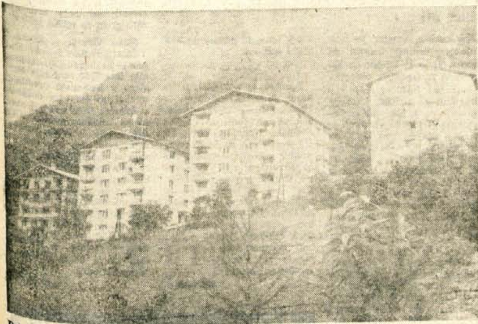
Delavci SGP Sava Jesenice grade na Tomšičevi cesti na Jesenicah že četrti stolpič z 20 stanovanj.