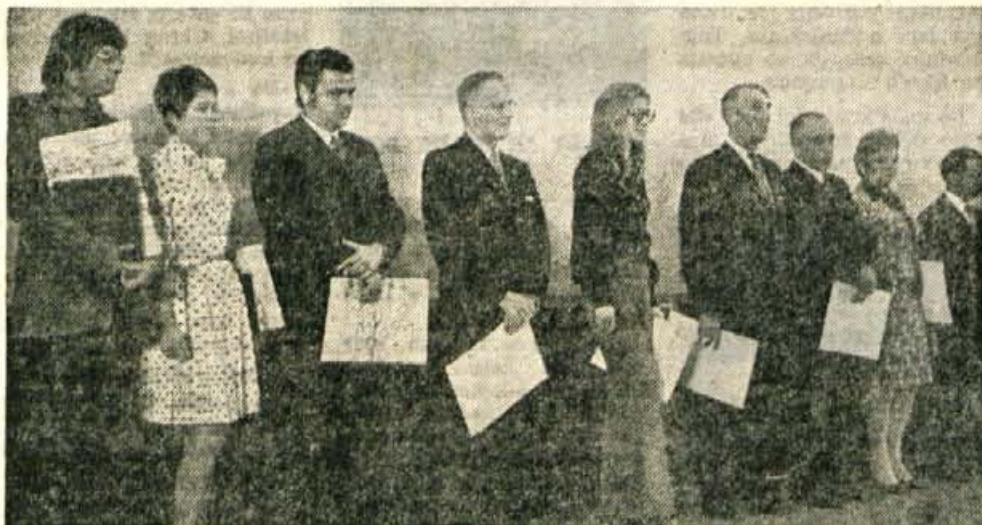
Š sklepne svečanosti IV. mednarodnega festivala športnih in turističnih filmov v Kranju.