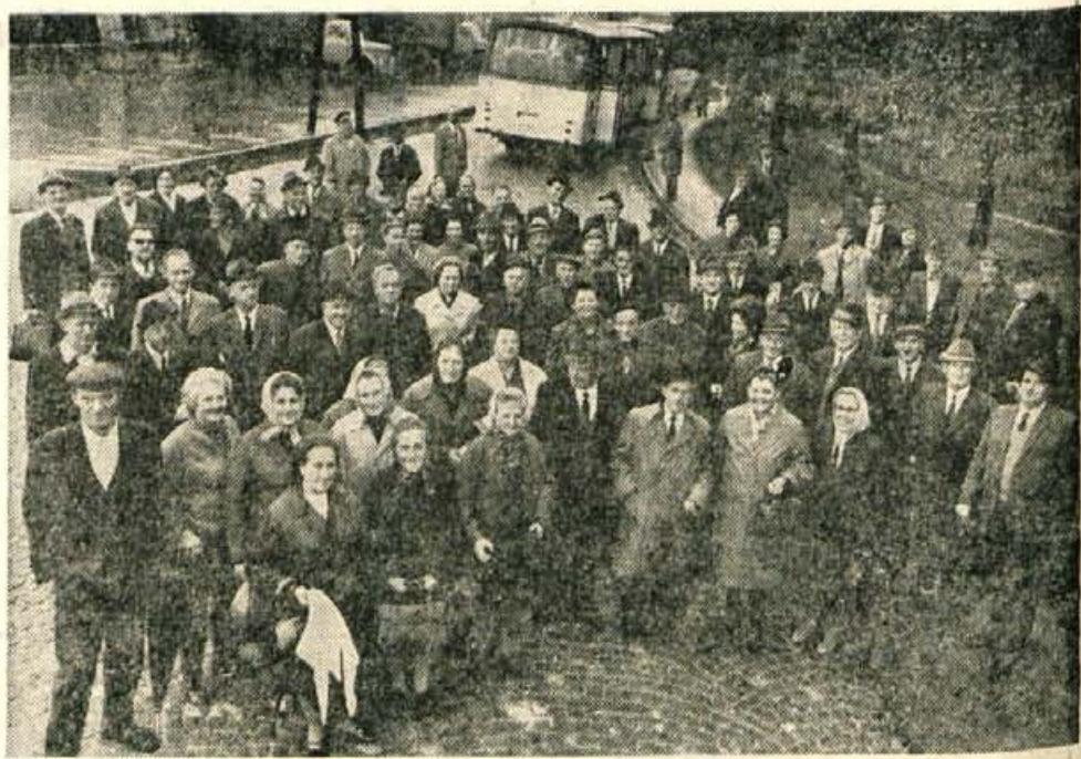
Upokojenci Jelovice iz Škofje Loke so v soboto obiskali rojake na Koroškem.