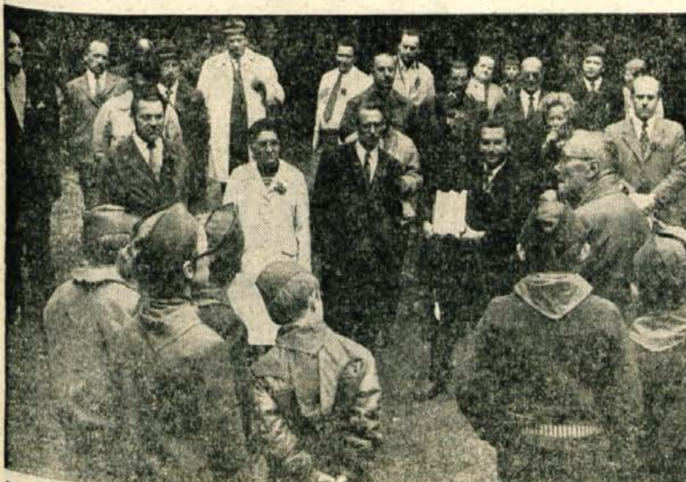
V petek so se pri spomeniku pod Storžičem že sedmič zapored srečali pionirji osnovne šole Lom pod Storžičem z nekdanjimi partizanskimi kurirji ter predstavniki delovnih organizacij, ki so pokrovitelji lomskega pionirskega odreda G-34. (Ik) (Več na 4. strani)

Modne novosti evropskih središč jesensko - zimske sezone