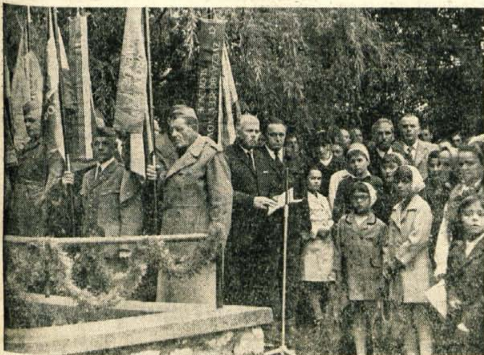
V nedeljo je bila v Strahinju pri Naklem pri spomeniku 22 padlih partizanov spominska svečanost ob 30-letnici borbe 2. bataljona kokrškega odreda v Udin borštu. (Več na 2. strani)

GLASILO SOCIALISTIČNE ZVEZE DELOVNEGA LJUDSTVA ZA GORENJSKO