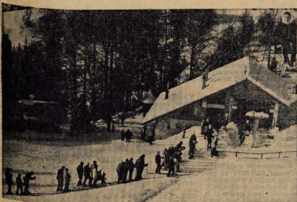
Spanov vrh je v zimskem času dobro obiskan. Na njegova smučišča še zlasti radi zahajajo Jeseničani. Člani smučarskega društva Jesenice imajo tu svoje redne treninge. Za pluzenje ceste do spodnje postaje žičnice dobro skrbi podjetje Kovinar.