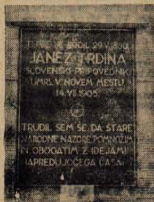
Spominska plošča na hiši, ki sedaj stoji na mestu nekdanjega pisateljevega rojstnega doma

Drmavovi so veljali v pisateljevih mladih letih za do-