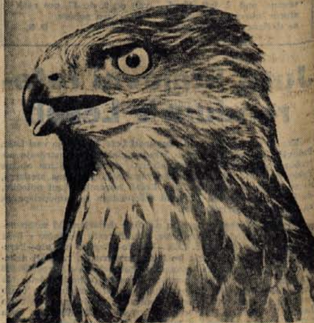
Do marca bo v veliki razstavnici dvorani Prirodoslovnega muzeja Slovenije v Ljubljani odprta prva republiška RAZSTAVA NARAVOSLOVNE FOTOGRAFIJE, ki jo prireja v sodelovanju z muzejem ob njegovi 150-letnici in s Foto-kino zvezo Prirodoslovno društvo Slovenije.

Da je osrednja knjižnica radovljiške občine končno dobila ustrezne prostore, je velika zasluga občinske skupščine, kulturne skupnosti in kolektiva knjižnice. Sredine otvoritve so se udeležili predstavniki kulturnih ustanov, družbenopolitičnih organizacij, občinske skupščine, gorenjski knjižničarji in predstavniki republiškega bibliotekarskega društva. A. Z.