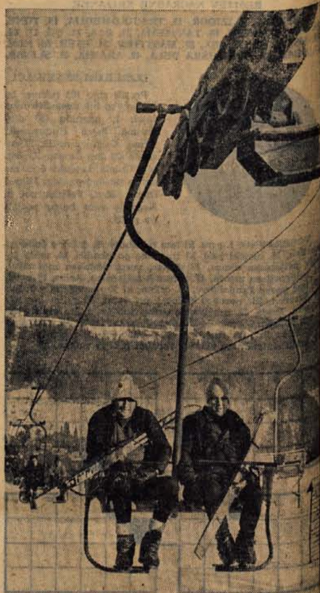
Na Starem vrhu je dovolj snega za odlično smuko.

Gostišče pri Čemažarju v Zapevalu še ni docela urejeno. Kljub temu pa podjetna »birtna« Mara rada postreže z domačimi specialitetami. Ko bo hiša urejena, bo lahko nudila penzijske storitve, v gostišču pa bodo gostje poleg jedil po naročilu dobili tudi pijače, ki jih na kmetijah ne točijo. Letos so v gorenji