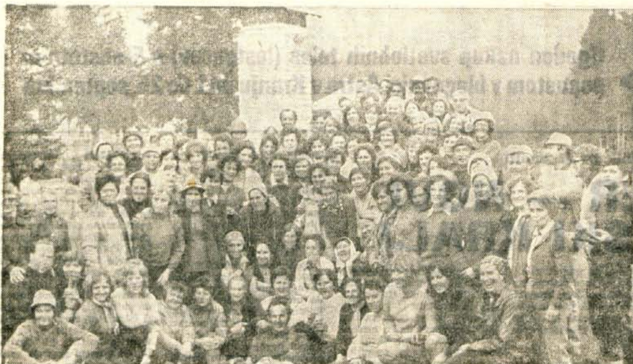
TT-jev sedmi pohod stotih žensk na Triglav se je končal v nedeljo pozno popoldne na Rudnem polju. Udeleženke odprave je od tu vodila pot na Dolcnijsko, Stajersko, Primorsko...