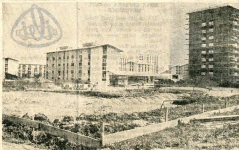
Podjetje Gorenjska oblačila gradi v severnem delu Kranja, ob cesti JLA nove proizvodne prostore. Končani bodo do konca prihodnjega leta.

Letos bodo izdelali za 50 milijonov dinarjev ženskih oblek. Pravijo, da s prodajo nimajo težav, saj je na primer letošnja japonska kolekcija že razprodana. Sicer pa s prodajo svojih izdelkov že nekaj let nimajo težav. In ko bodo imeli nove prostore, računajo, da bodo na leto izdelali za 80 do 100 milijonov novih dinarjev. Hkrati pa se bo tudi kolektiv povečal na okrog 400 zaposlenih. A. Zalar