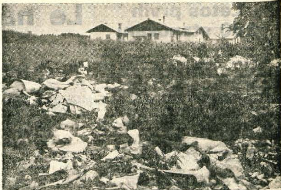
Bled sicer ni čisto brez »črnih smetišč«, a takšnega, kot je zraven gradbišča nove šole v Radovljici, bi v meki gorenjskega turizma težko našli. Ljudje kar javno, ob belem dnevu, prinašajo odpadke.

A slika ne bi bila popolna, če bi zamolčali ukrepe Vodne skupnosti Kranj, ki pospešeno pogloblja odtok jezernice. Ustrezno odtok bo preprečil nihanje vodne gladine (30 centimetrov!), nastalo zaradi občasnega spuščanja Radovne. Višji nivo jezera je namreč ogrozil stabilnost obrežja, ki so ga morali zato sistematično utrjevati. Vodstvi TD in KS poudarjata, da je Vodna skupnost dragocen zavezovalnik Blejcev, zaveznik, katerega pomoč in spoštovanje sprejetih obveznosti sta redek primer solidnega poslovanja, ki dan danes pri nas ni več ravno »v modi«. I. Guzelj