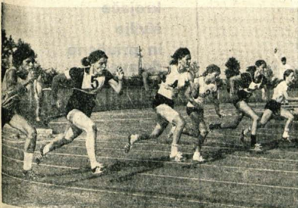
Prvi start žensk na 100 m na letošnjem atletskem tekmovanju »Kranj 72«. V tej najkrajši atletski disciplini so tekmovalke morale ponoviti start, saj so v finalni tekmi tri tekmovalke dosegle isti čas. Kljub fotofinišu niso mogli določiti zmagovalke. Zato so se podale na ponovno štartno mesto, kjer je bila najhitrejša predstavnica Avstrije.

Pulj 1972 - XIX. festival jugoslovanskega filma