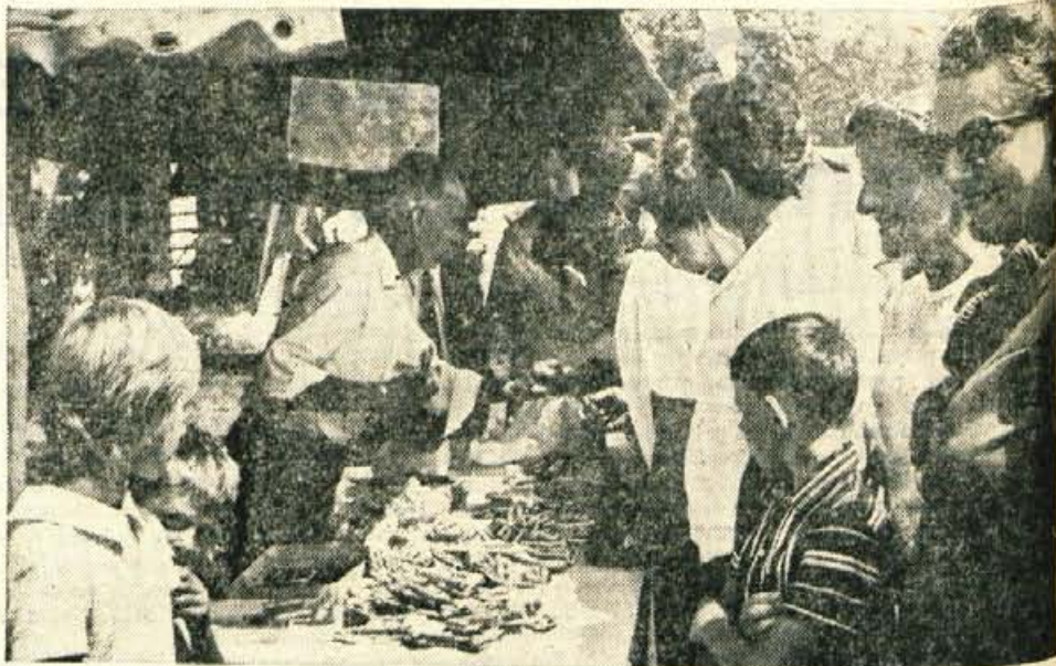
Lectova srca, bobni in slovanska medicina so »specialtete« hotaveljskega semanjskega dne.