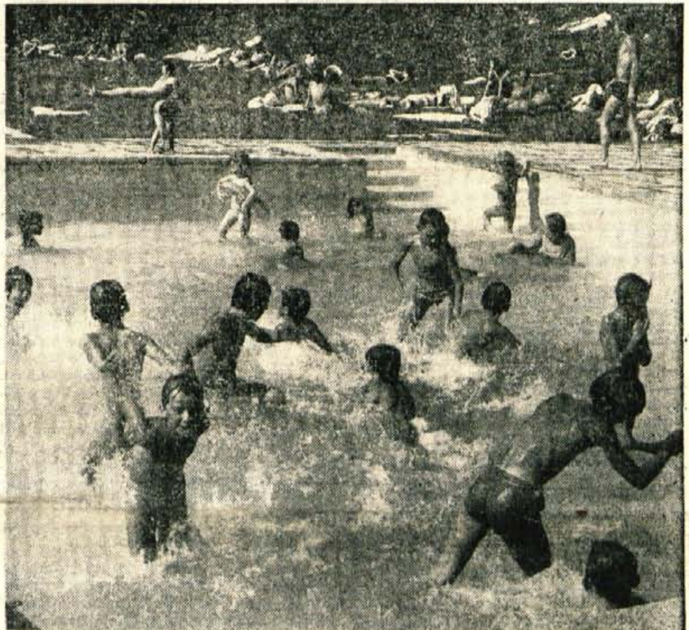
Prava afriška vročina je pregnala prebivalce mest, kjer je asfalt še posebno vroč, v prenapolnjena kopališča, kjer se skušajo v ne preveč mrzli in tudi ne preveč čisti vodi ohladiti.

Naslednji letošnji sejem bo od 14. do 22. oktobra, ko bo v Savskem logu v Kranju V. sejem obrti in opreme. Tudi na tem sejmu bodo letos prvič sodelovala podjetja iz tujine. A. Z.