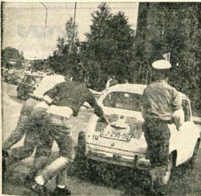
Kadar v križišču utihne motor, je treba avtomobil kar najhitreje odstraniti, da se promet ne ustavlja. V takih primerih pomagajo kar mimaldoč in tudi prometni miličniki.