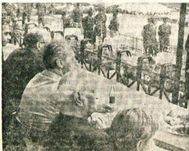
Predsednik Indijske republike na terasi hotela v Podvinu — Foto: F. Perdan