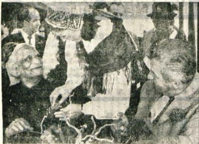
Varahagiri Venkato Giri in Stanko Kajdž na terasi Kazine Park hotela na Bledu