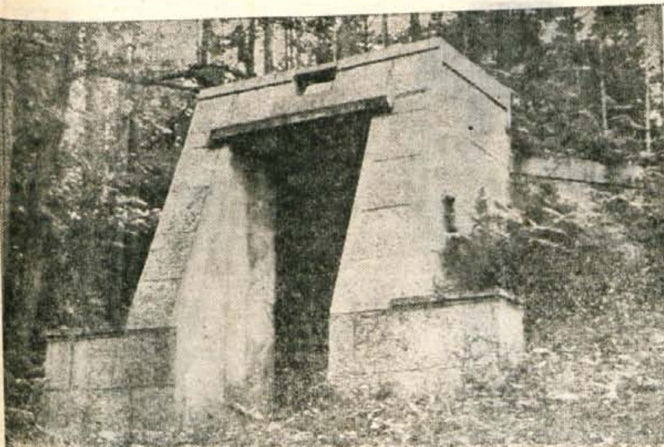
Gradnja novega vodovoda je bila ena največjih prostovoljnih delovnih akcij prebivalcev Naklega in okolice. Na fotografiji je zajetje v Strahinju.