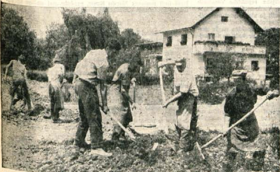
Podjetje Elektro Kranj bo v Vopovljah (krajevna skupnost Zalog) obnovilo električno omrežje. Z deli so začeli pred dobrim mesecem. V akcijo za obnovitev omrežja pa so se poleg krajevnih skupnosti vključili tudi prebivalci Vopovelj, ki so se odločili za prostovoljno delo in denarni prispevek. — A. Z. — Foto: F. Perdan

GLASILO SOCIALISTICNE ZVEZE DELOVNEGA LJUDSTVA ZA GORENJSKO