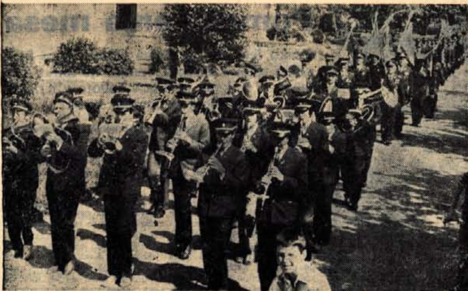
Ob krajevnem prazniku v Zirovnici je prostovoljno gasilsko društvo v Zabreznici dobilo nov gasilski avtomobil. Denar za nakup je prispevala deloma občinska gasilska zveza, nekaj denarja pa so zbrali gasilci tudi v nabiralni akciji med prebivalci teh krajev. Ob slovesni izročitvi novega avtomobila je bila parada čet gasilskih društev Zirovnice, Zabreznice, Jesenic, Planine pod Golico, Hrušice, Kranjske gore, Smokuča, Bleda in Brézij.