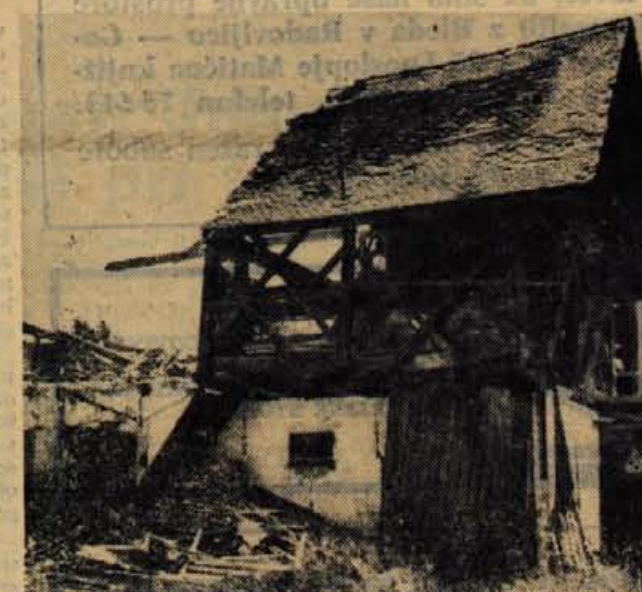
Zadrugi škedenj v Poljčah zaradi dotrajanosti letošnjo zimo ni zdržal teže snega. Stavbe po selitvi kmetijskega posestva v nove prostore na Blate nihče več ni popravil in zato ni bilo pričakovati drugega kot da se bo porušila. Čeprav je v Poljčah še nekaj podobnih kamnov spotike, je podrt hlev najbolj bodeč. Kot so nam povedali domačini, je stavbo nekdo že odkupil ter jo bo preuredil v stanovanjsko hišo. (Jk)