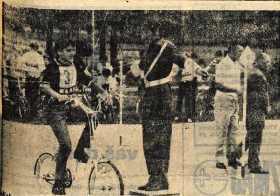
Kaj veš o prometu? — Tekmovanje osnovnošolcev v Križah.