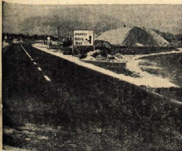
Celotno križišče bo uredilo Cestno podjetje iz Kranja. Pravkar urejajo drugi del — podvoz. Rok za dokončanje tega dela križišča je 15. avgust letos. Na Cestnem podjetju v Kranju smo izvedeli, da bodo sicer tudi ta del uredili do roka, čeprav se je pri gradnji zataknilo. Podvoz bi bil namreč lahko gotov mesec dni prej, če ne bi našli tal na talno vodo. Zato bodo morali urediti posebno kanalizacijo v smeri proti železniški progi, kar bo delno tudi povečalo prvotno predvidene stroške. — A. Z.