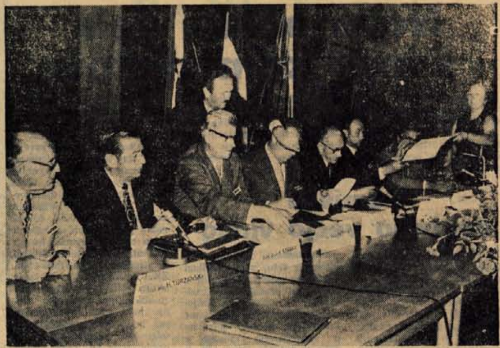
Predstavniki Save, Semperita in Mednarodne finančne korporacije IFC podpisujejo pogodbo o skupni gradnji nove tovarne avtopnevmatike v Kranju.