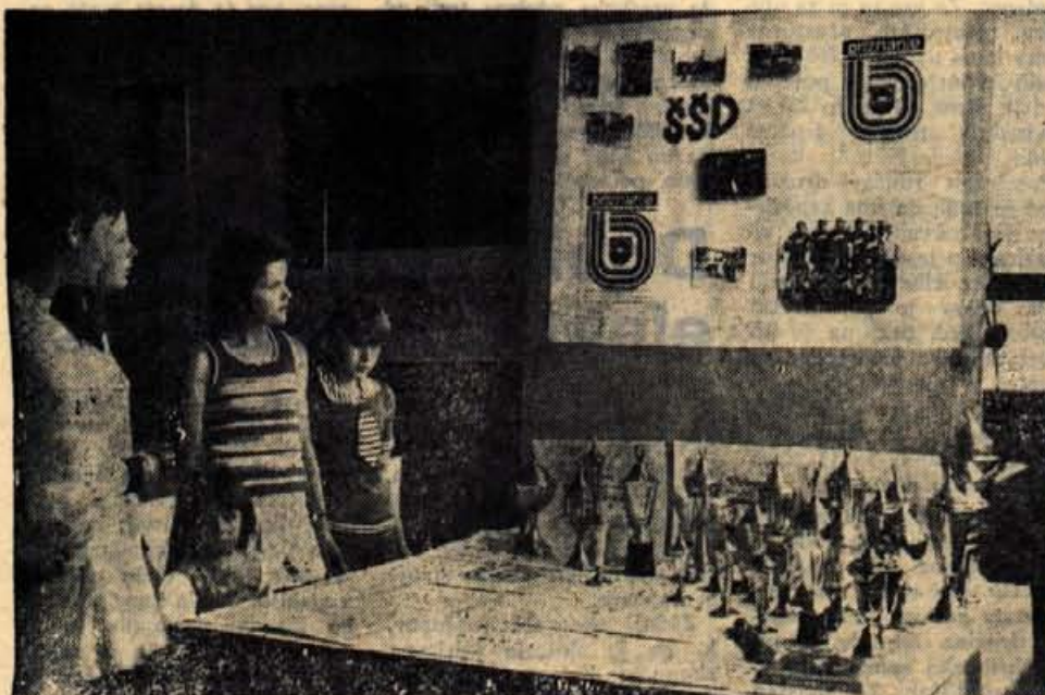
RAZSTAVE OB KONCU ŠOLSKEGA LETA — Domala v vseh osnovnih šolah na Gorenjskem so ob koncu šolskega leta vodstva in učenci šol pripravili razstave o enoletnem delu na šolah. Podobno razstavo so imeli v soboto in nedeljo tudi v osnovni šoli Lucijan Seljak v Stražišču pri Kranju. Na letošnji razstavi so dali poudarek 30-letnici dela pionirske organizacije na šoli. Hkrati pa je bila njihova razstava tudi prispevek vodstva in učencev šole k praznovanju krajevnega praznika. (A. 2.) — Foto: F. Perdan