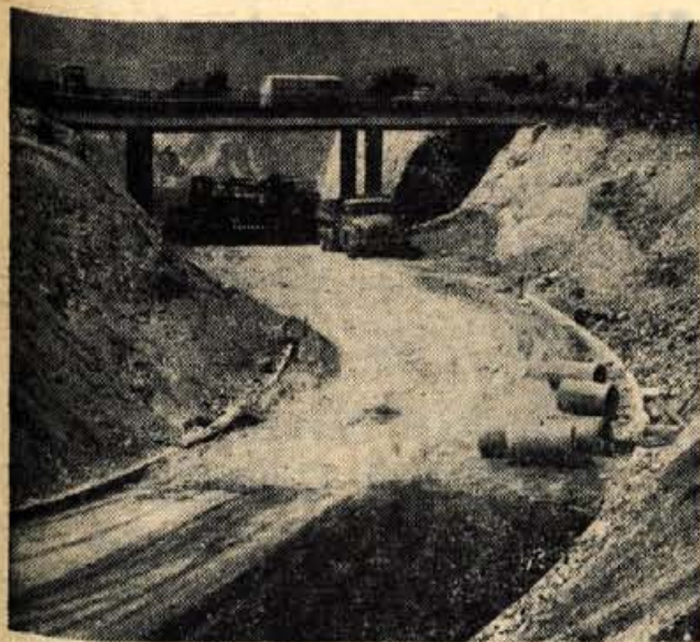
Prvi del urejanja križišča v Lescah je končan. Enota podjetja Gradis z Jesenic je zgradila most in tako je 15. junija že stekel promet po prenovljeni cesti v smeri iz Kranja proti Jesenicam.