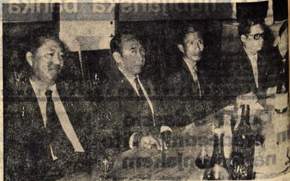
MINISTER ZA TRGOVINO BURMANSKE UNIJE V ISKRI — Kranj, 27. junija — Med dvo-dnevnim obiskom 4-članske delegacije Burmanske unije pod vodstvom ministra za trgovino dr. Maung Lwina v Sloveniji je delegacija malo po 12. uri obiskala tudi Iskro Elektronskega obratovanja Kranj. Po pogovorih s predstavniki vodstva kranjske tovarne so si člani delegacije ogledali tudi nekatere obrate v tovarni. Na sliki: Minister za trgovino Burmanske unije dr. Maung Lwin med pogovori s predstavniki Iskre (prvi z leve).