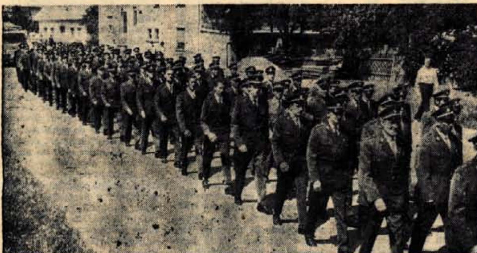
V okviru praznovanja krajevnega praznika Stražišča in 70. obletnice stražiškega gasilskega društva je bila v nedeljo v Stražišču velika gasilska parada po Delavski cesti do gasilskega doma, kjer je bila osrednja slovesnost. (Jk)