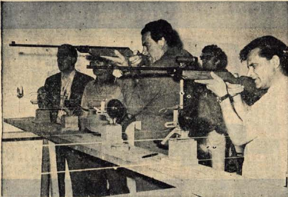
V soboto so se končale v Kranju VI. letne športne igre delavcev osnovnih sindikalnih organizacij zdravstvenega in pokojninskoinvalidskega zavarovanja v Sloveniji, na katerih je sodelovalo prek 200 športnikov. V vseh disciplinah so bili najuspešnejši predstavniki kranjskega Komunalnega zavoda za socialno zavarovanje. Drugi so bili predstavniki Murske Sobotice, tretji pa predstavniki direkcije z Ljubljane. (Jk)