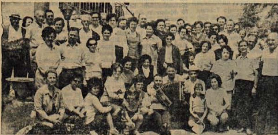
IZLET GORENJSKIH INVALIDOV — V nedeljo, 4. junija, je bilo okrog 250 invalidov iz Kranja, Tržiča, Škofje Loke in z Jesenic gost invalidov iz Nove Gorice. Med drugim so obiskali tudi bolnišnico Franja.

Tako je o podvigu svoje podmornice pripovedoval kapitanleutnant Prien novinarjem o potopitvi 'Royal Oak' in torpediranju 'Repulse' na sprejemu, ki ga je 18. oktobra priredil zanj in njegovo posadko Hitler.