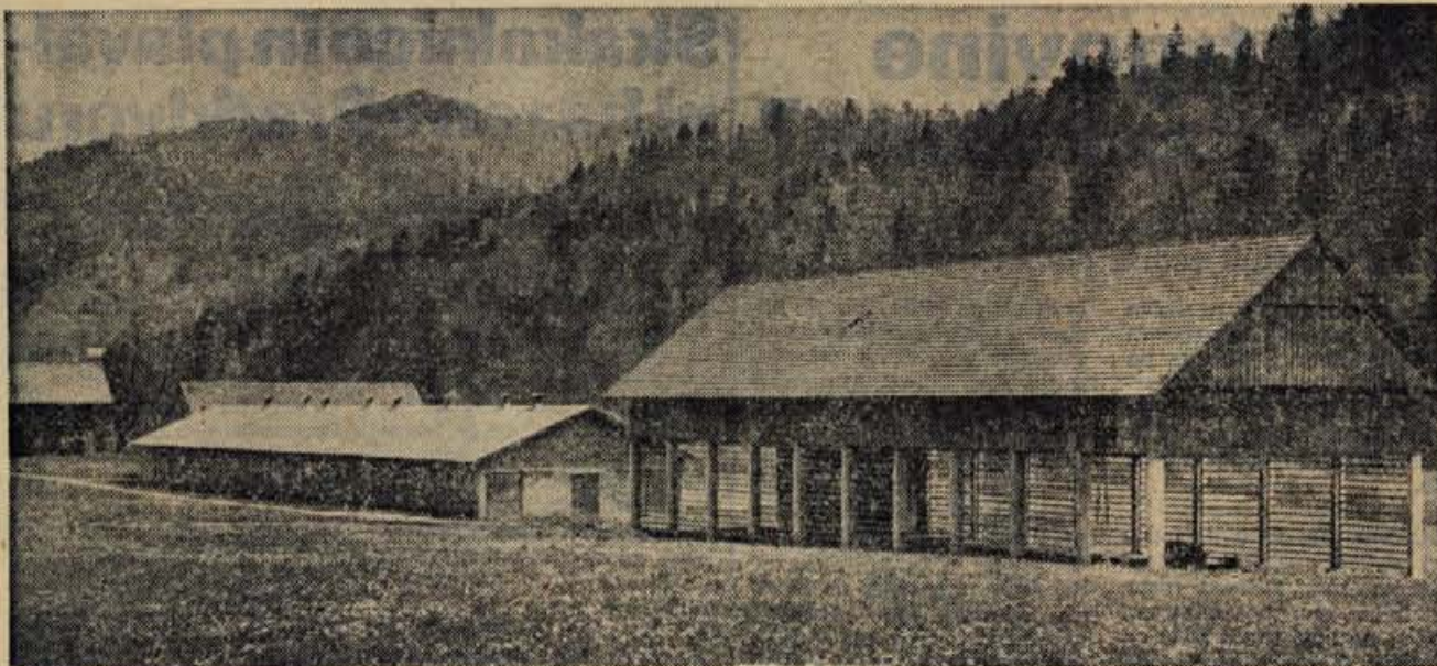
Bi se lahko hlev v Dobju uporabil za kaj bolj koristnega?