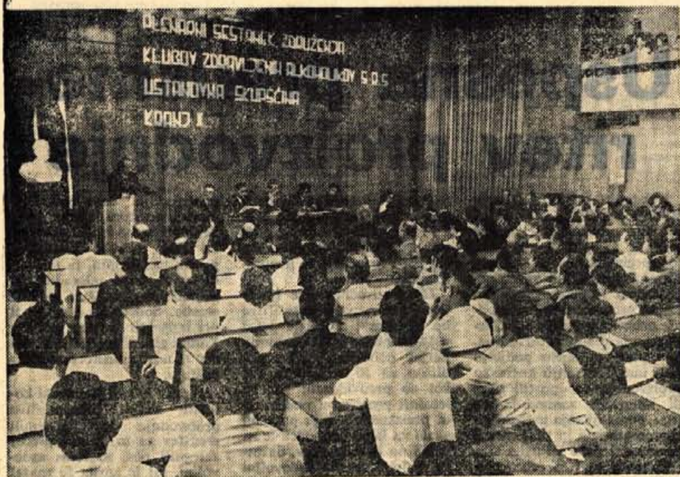
Prek 600 članov klubov zdravljenih alkoholikov iz tridesetih slovenskih klubov in okoli 30 gostov in predstavnikov družbeno-političnih organizacij republike in občin se je v soboto zbralo na plenarnem sestanku klubov zdravljenih alkoholikov v Kranju.