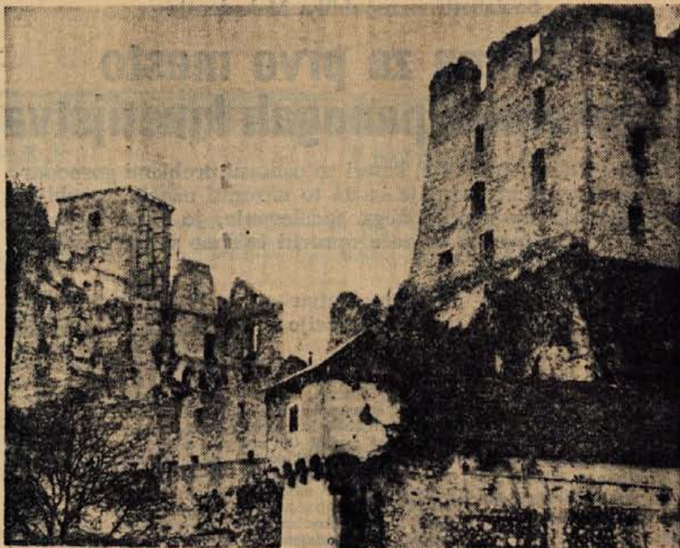
Gradu Kamen, ki stoji ob vhodu v dolino Drage, se obetajo boljši dnevi.