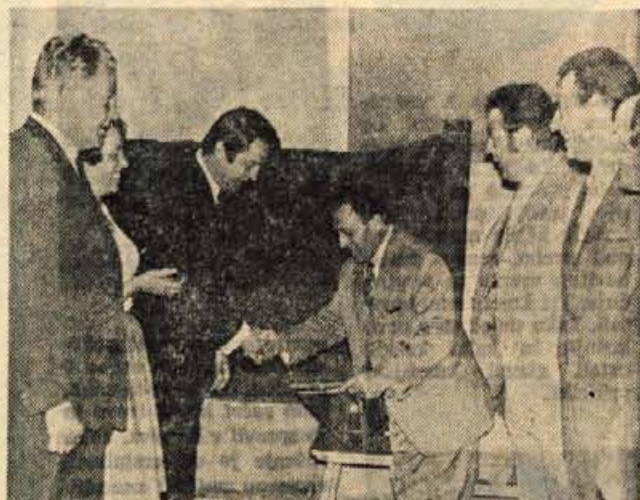
Predsednika strelskih zvez sta si izmenjala spominska darila pred začetkom tekmovanja.

3. Lombar (oba Kranj) 351, 4. Mitsche (Celovec) 346, 5. Frelih (Kranj) 345; pištola: 1. Frelih 357, 2. Prestor 357, 3. Malovrh (vsi Kranj) 345, 4. Stesl (Celovec) 336, 5. Černe (Kranj) 336. B. Malovrh