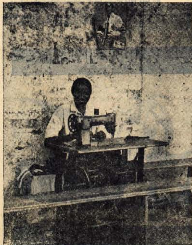
Krojač iz Maranga.

Razdalje so tu v primerjavi z domačimi gorami prav neznanske. Ura hoda je toliko kot nič v tem prostranstvu. Ze dolgo smo na poti, a vrhovi so na pogled enako oddaljeni kot jutraj, ko smo odšli na pot.