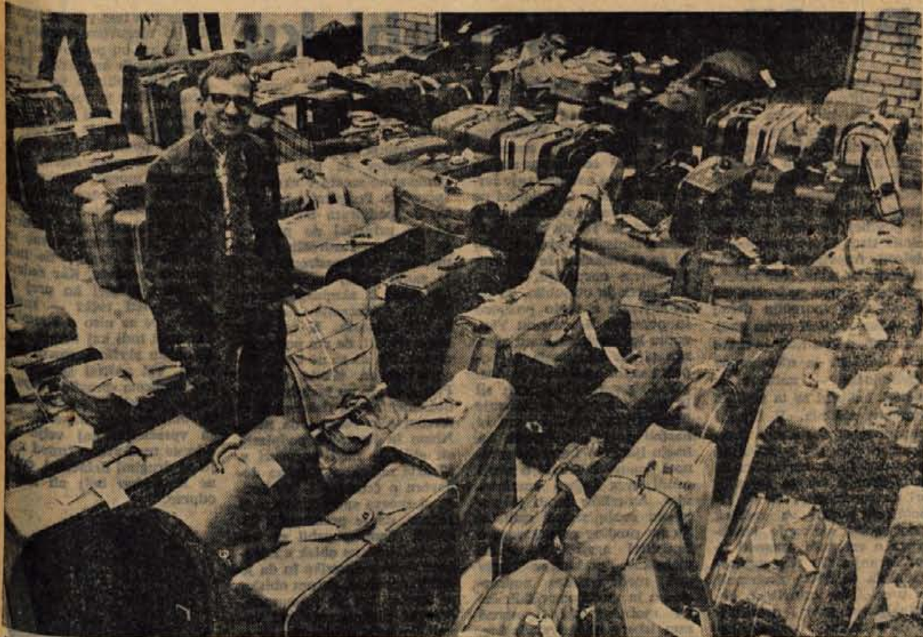
Med tolikimi kovčki je težko najti pravega!