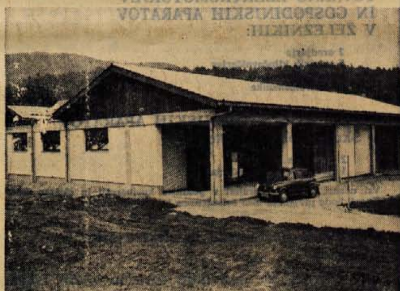
Samopostrežna trgovina v Gameljnah, ki jo bodo odprli še ta mesec, je samo droban kamenček v mozaku sodobnih prodajaln loškega trgovskega podjetja

tiko investiranja. Prav doledno spoštovanje omenjenih dveh zakonitosti pa je glavna značilnost veletrgovine LOKA Skofja Loka, o kateri bo govora o pričujočem zapisu.