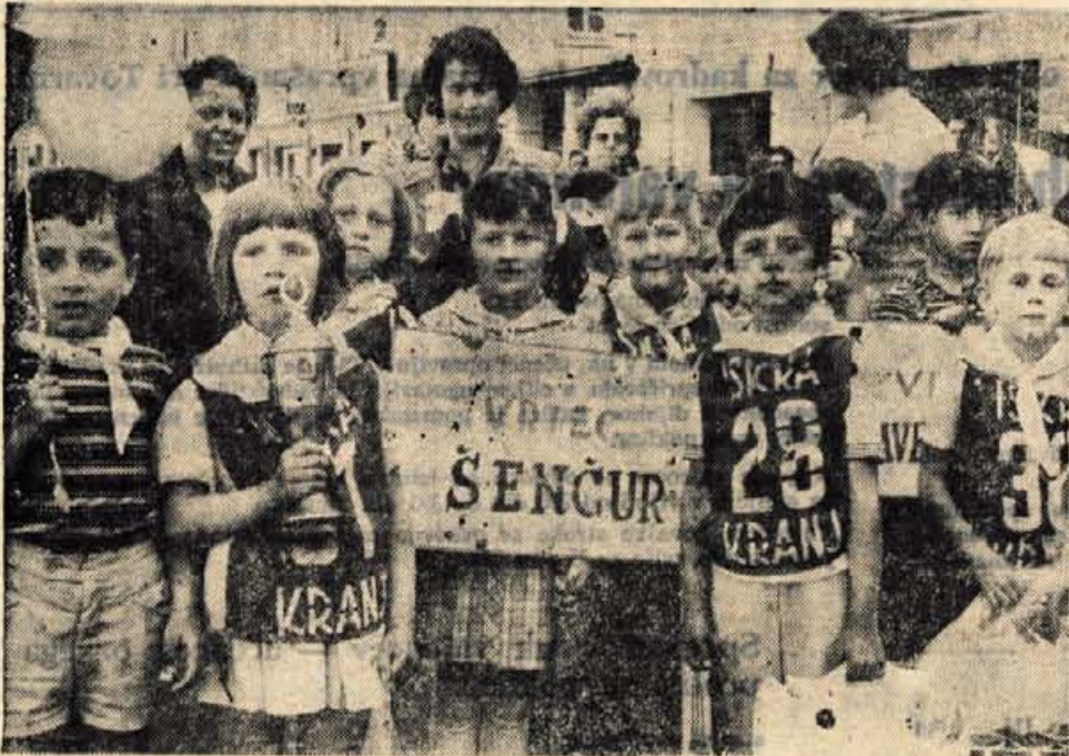
Otroci iz sedmih kranjskih vrtcev in iz šenčurskega vrta so v ponedeljek popoldne na Titovem trgu v Kranju tekmovali s skiroji. Prireditev sta pripravila kot že vrsto let doslej Avtomoto društvo v Kranju in pa komisija za varstvo v prometu pri skupščini občine Kranj. Med 40 tekmovalci so bili najboljši otroci iz vrta Šenčur. Posamezniki in ekipe so dobili nagrade in diplome, šenčurska ekipa pa tudi prehodni pokal. V sprevedu z balončki in prometnimi znaki je kasneje ob zaključku tekmovanja sodelovalo okoli 120 otrok.