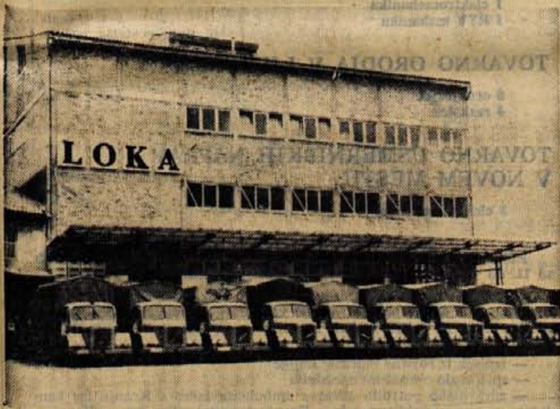
Novo, moderno skladišče in obsežen vozni park omogočata veletrgovini LOKA nagel pretok blaga in močno vzpodbujata razvoj grosistične dejavnosti