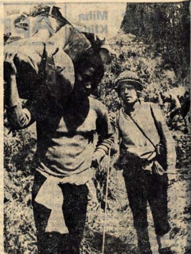
Nosač izpod Kilimandžara.

gram je nepogrešljiv. Pred temo smo zbrani na ravnici, kjer v višini 3700 m sameva nekaj svetlih aluminijastih koč zavetišča Harambo.