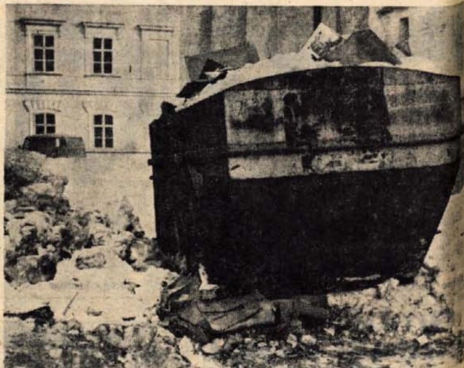
Kranj leta 1972 med cerkvijo in samopostrežno trgovino Pri Petriku: pred kratkim so na mestu odprli »podružnico« za smeti.

KRAJEVNA SKUPNOST PODLJUBELJ priredi 15. januarja ob 20. uri VESELICO . Igra ansambel METODA PRAPROTNIKA s PEVCEM . Vabljenil 118