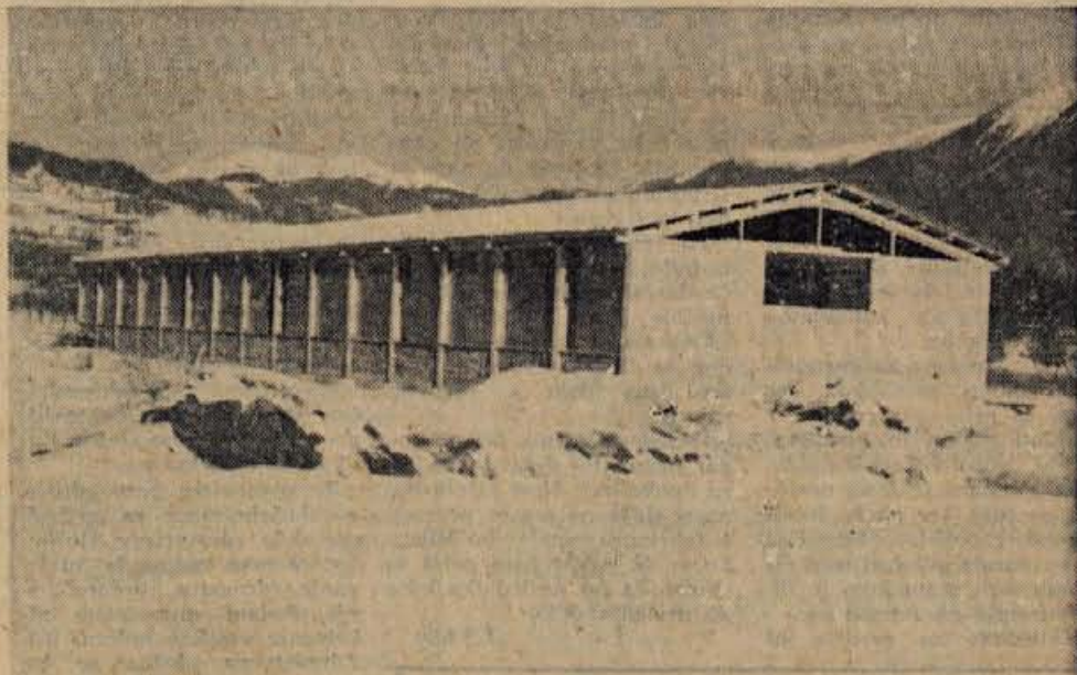
Podjetje Kovinska delavnica Bled je imelo doslej svoje prostore v bližini hotela Krim. Ker ti prostori niso več primerni, so že lani poleti začeli graditi v bližini tovarne Vezenine Bled nove prostore. Predvidevajo, da se bodo v nove prostore vselili že spomladl.