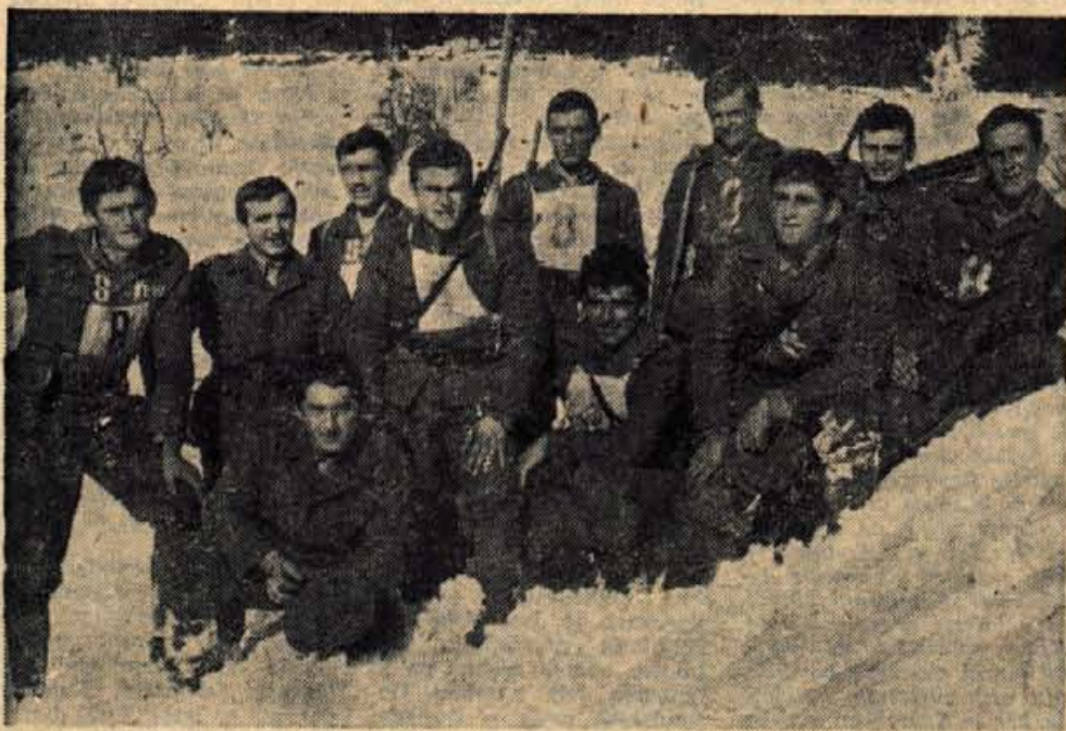
Najbolj uspešni na odprtem prvenstvu ljubljanske armadne oblasti so bili vojaki VP 1098/45 iz Kranja

v soboto je bilo v Selcih tekmovanje v sankanju s tekmovalnimi sankami, v nedeljo pa z navadnimj sanmi. V so