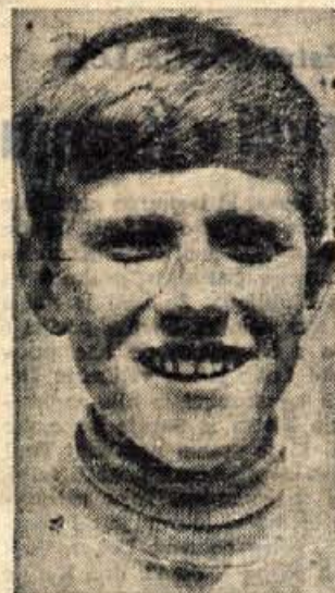
Jože Marn bo letos končal osemletko