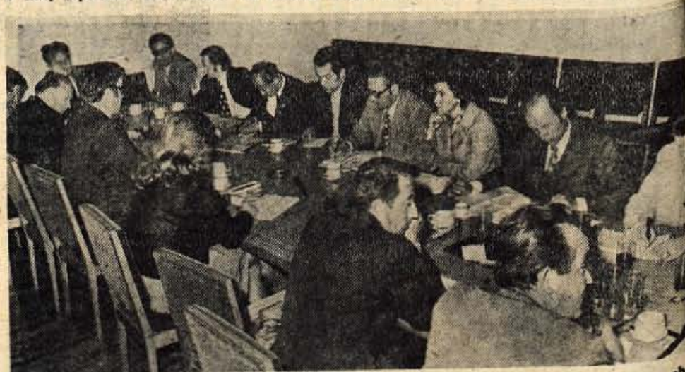
»OKROGLA MIZA« O PROGRAMU SOCIALNE POLITIKE — Časopis Komunist in komite občinske konference zveze komunistov Kranj sta v soboto dopoldne v prostorih kranjske občinske skupščine organizirala »okroglo mizo«, kjer so se pogovarjali o programu socialne politike v kranjski občini. Na razgovoru so sodelovali člani komiteja občinske konference ZK, predstavniki organizacij ZK in predstavniki nekaterih družbenih služb iz kranjske občine ter drugi. O zanimivem razgovoru bomo še pisali, objavljen pa bo tudi v časopisu Komunist. — A. Z. — Foto: F. Perdan

Štafeta se je nato poslovila od Gorenjske in se prek Crniva napotila v Gornji Grad, Mozirje, Sočanj in Velenje, kjer bo prenočila. Jutri bo nadaljevala pot po Štajerski. — J. Košnjek