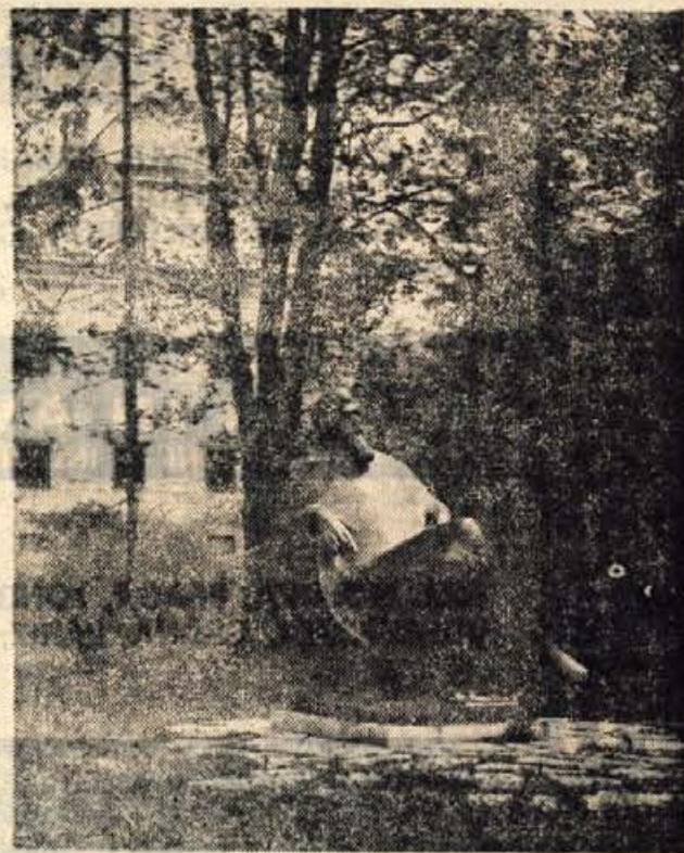
Tavčarjev spomenik pred graščino na Visokem; kip je delo kiparja Jake Savinška

Skofja Loka je eno naših najbolje ohranjenih starih mest, ki svojega videza, vsaj v jedru in zasnovi, še ni kaj dosti spremenilo. Lahko torej rečem, da je poleg Ptujja še najbolj ohranilo svoj srednjeveški vnanji značaj. Seveda bi ob naši poti skozi Skofjo Loko moralj še kaj