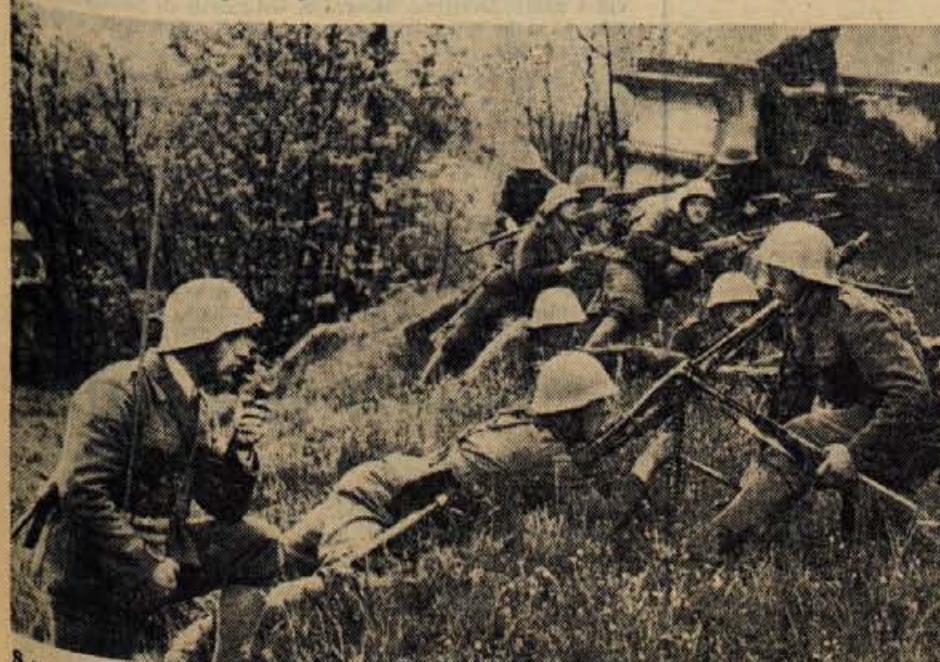
S sobotne vaje partizanskega odreda, obmejnih enot in planinske enote v radovljiški občini.