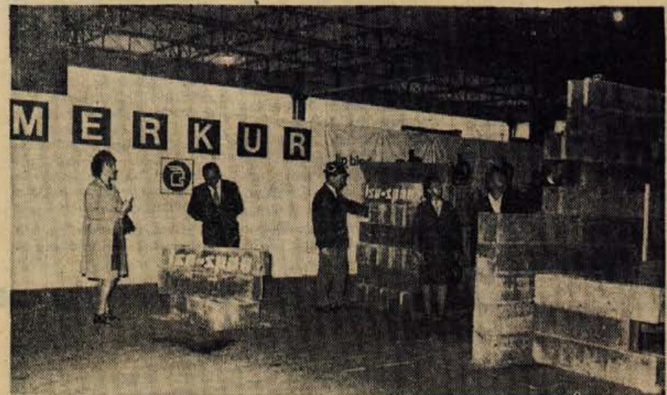
PRIKAZ NOVIH GRADBENIH MATERIALOV — Podjetje Merkur iz Kranja je v petek popoldne v sodelovanju s podjetji Lesonit Anhovo, LIP Bled, Glin Nazarje, Jugokeramika Zagreb in Dalmacija cement v prostorih Gorenjskega sejma v Kranju prikazalo nekatere manj znane oziroma nove gradbene materiale. Zanimanje je bilo veliko, saj se je prikaza udeležilo okrog tisoč obiskovalcev, med njimi okrog 130 predstavnikov gradbenih podjetij in nekateri gradbeni inšpektorji. Prikazan gradbeni material bo imelo podjetje Merkur v prihodnje na zalogi. — A. Z.