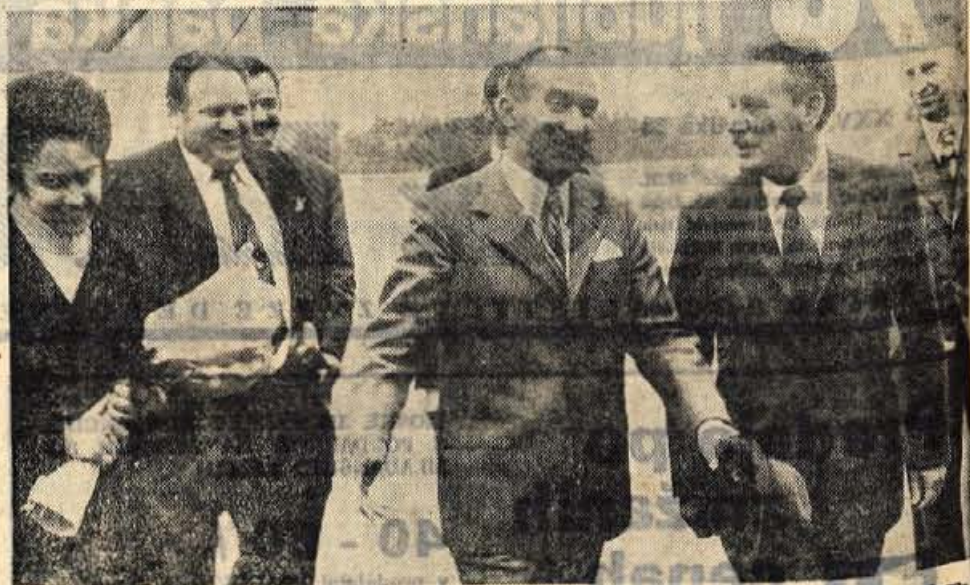
Po enotedenskem obisku v nekaterih zahodnonemških deželah se je v soboto vrnila delegacija republiškega izvršnega sveta pod vodstvom predsednika Staneta Kavčiča.

Istovrstno pa se bo sestalo tudi predsedstvo občinskega sindikalnega sveta. Na sejo so povabili predstavnike sindikalne organizacije v obratu Žita v Tržiču. Glavna tema razgovora bo redna preskrba s kruhom v občini in reševanje problemov delavcev, ki so zaposleni v tržiški pekarski industriji. —jk