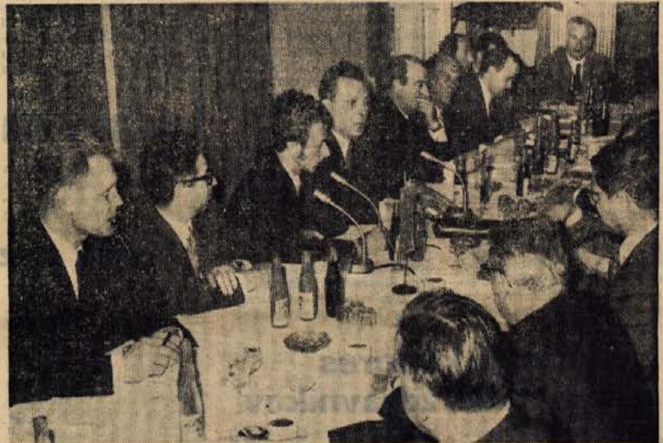
KADROVSKI DIREKTORJI IZ FRANCIJE V ISKRI — Okrog 40 kadrovske direktorjev iz večjih francoskih podjetij, ki so na obisku v naši državi, je v ponedeljek dopoldne obiskalo kranjsko Iskro. S predstavnikmi Elektromehanik e so se pogovarjali o nagrajevanju, kadrovanju in o drugih vprašanjih v tem kranjskem podjetju. — A. Z.