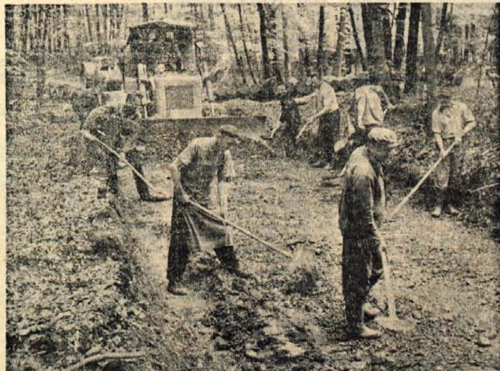
Vaščani so opravili že prek 3000 prostovoljnih delovnih ur.