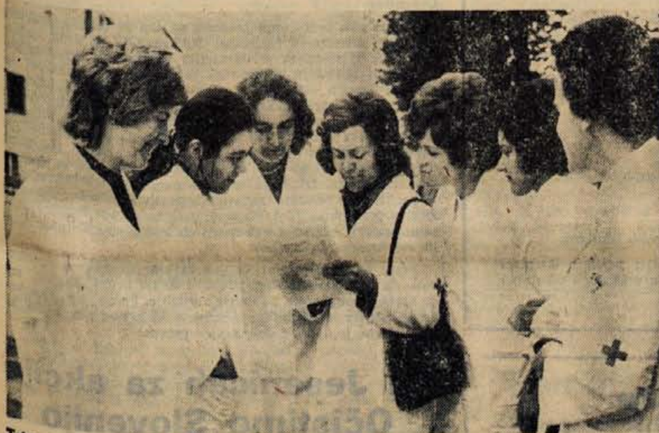
Tekmovanje ekip prve pomoči je bilo v soboto tudi v Radovljici. Na sliki: Med številnimi ekipami, je bila tudi ekipa Ver'ge Lesce.