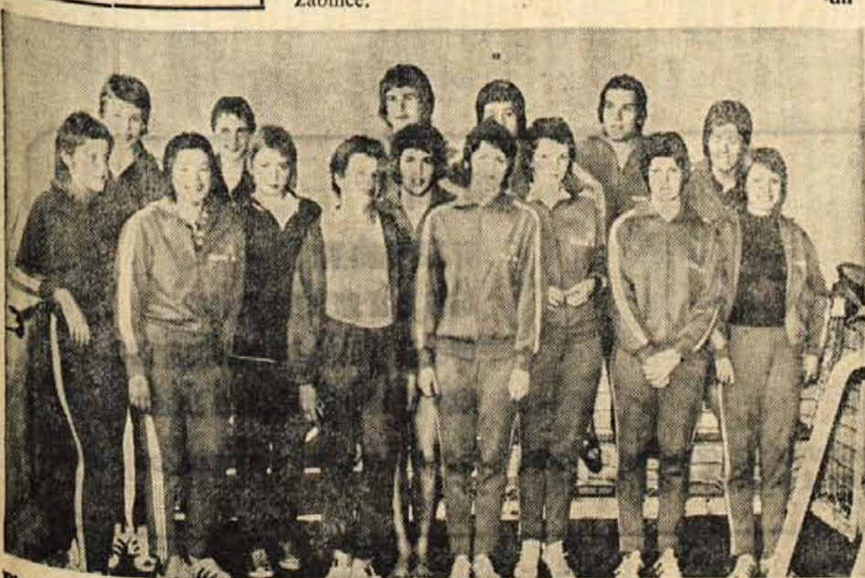
Plavalci in plavalke kranjskega Triglava so na nedavnem republiškem prvenstvu v zimskem bazenu v Kranju za posameznike in moštveni naslov z veliko prednostjo osvojili ekipni naslov. Izkazale so se plavalke, ki so v posameznikih disciplinah osvojile vsa prva mesta.

Na tradicionalnem tekmovanju smučarjev v Železni Kapli so nastopili tudi trije Kranjčani. Vsi trije so se zelo dobro uvrstili. V konkurenci članov je Leben zasedel 2. mesto, med starejšimi mladinci pa je bil Blažič drugi. Skok pa tretji. J. J.