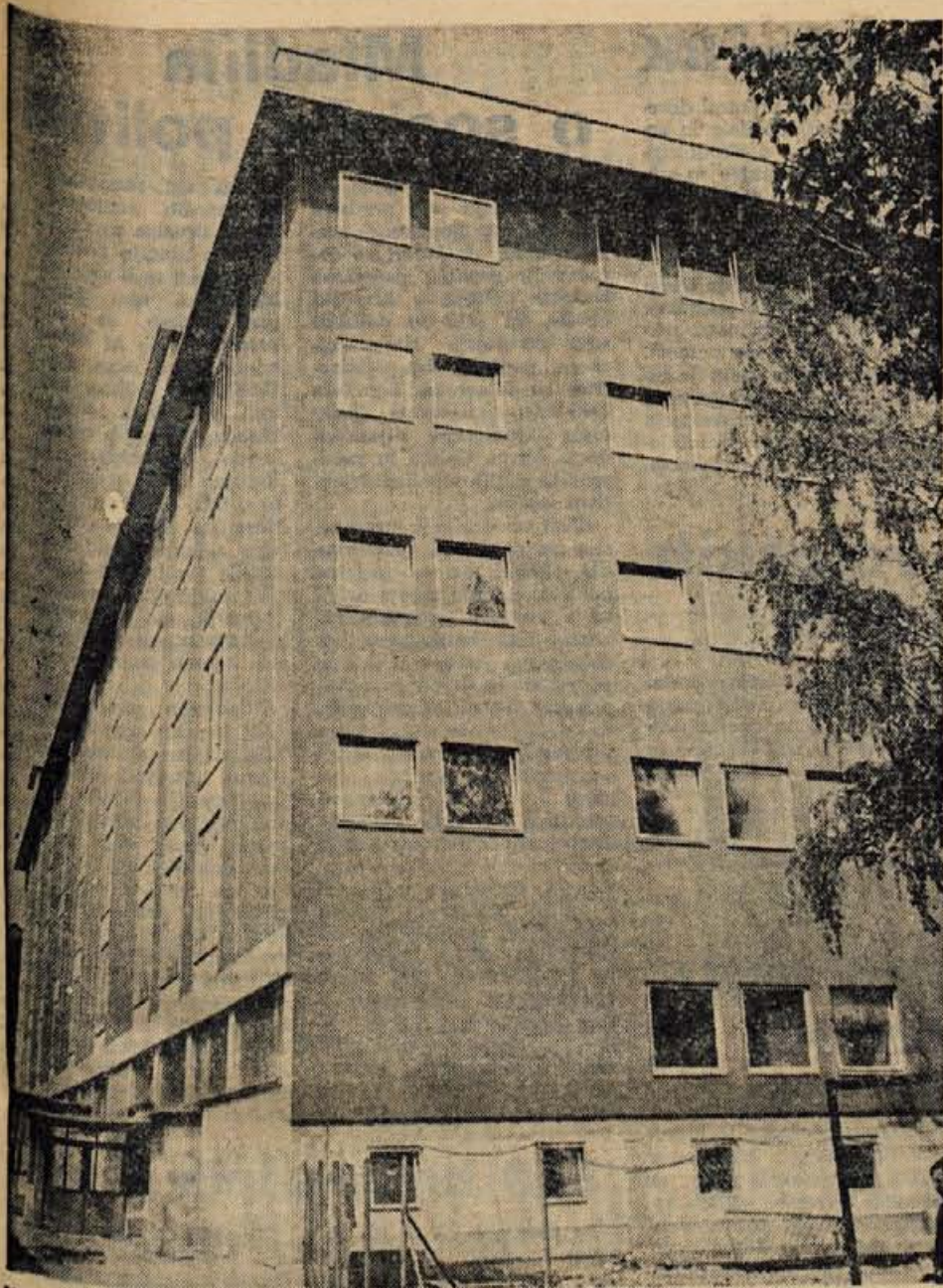
V novo Iskrino stavbo v Savskem logu so se pred dobrim mesecem začeli seliti nekateri oddelki iz stare stavbe. V novi stavbi bodo oddelki za naviljanje tuljav, montaža relejev, montaža enot telefonskih central, razvojni oddelek in skladišče. Preselitev bo končana do konca maja.