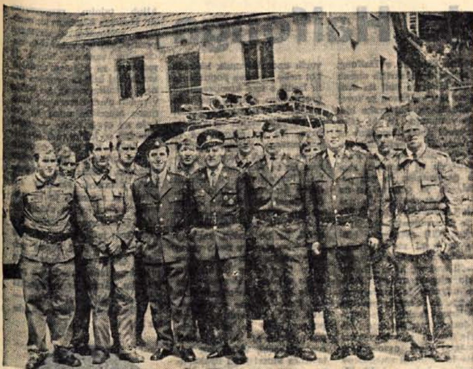
V nedeljo, 23. aprila, je bilo v Železnikih sektorsko gasilsko tekmovanje, katerega so se udeležila vsa gasilska društva v Seiški dolini. Na sliki: desetina PGD Železniki je dosegla prvo mesto.