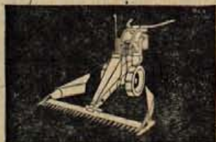
Kosilnik kombi naprave WIESEL