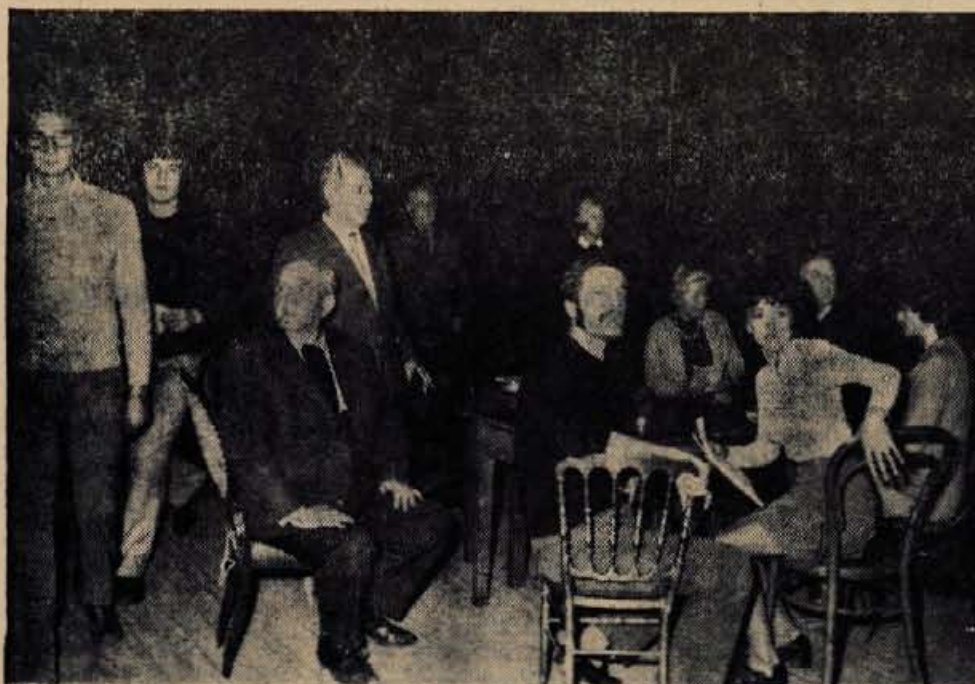
Skušnje so dostikrat napornejše kot sama predstava. Posamezne gibe je treba ponavljati in pliti vse dokler nastopajočim ne predejo v meso in kri. (-lg)

Pred premiero Cankarjeve komedije Za narodov blagor