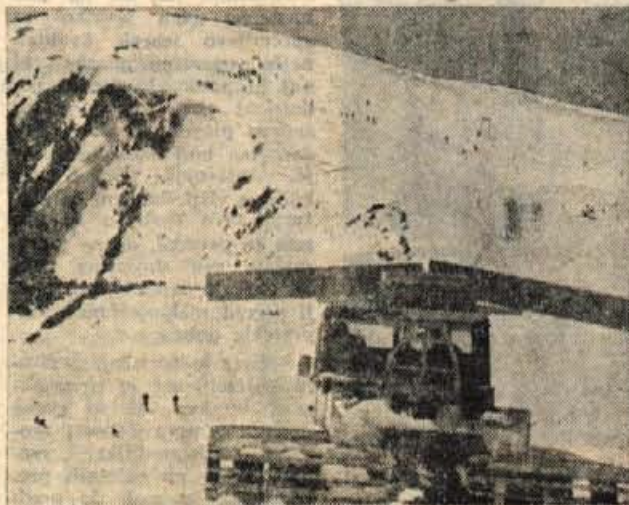
Teptalni stroj pisten bully na Zvohu.