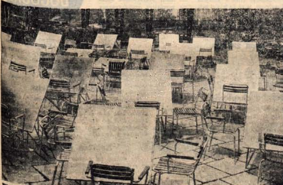
BLED PRED SEZONO — Vse je pripravljeno

V smislu samoupravnih načel je delovna skupnost vzela predlog v kritičen pretres ter ugotovila, da so piščoči