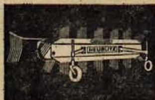
Traktorski obračalnik — zgrabljajnik