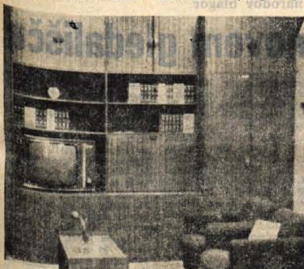
V podjetju Alples v Železnikih so v sredo odprli razstavní prostor in prodajalno pohištva. Prodajalno bo odprta vsak dan, tudi ob nedeljah

Pristojni zvezni organi bodo še ta mesec poslali ZIS svoje predloge in stališča glede načel o oblikovanju cen. Ker bo zakon o družbenem nadzorstvu cen najbrž sprejet konec tega meseca, lahko pričakujemo najnujnejše popravke cen že maja.