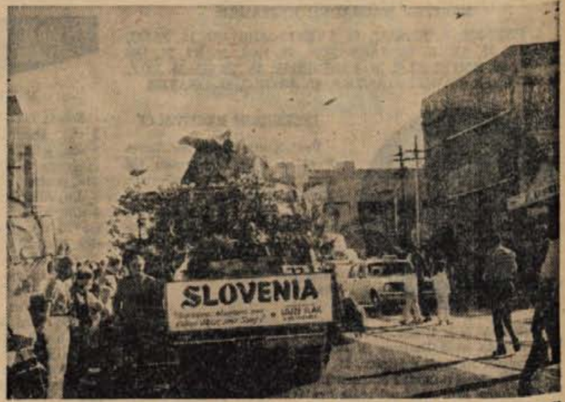
Praznovanju mumba — avstralskega delavskega praznika — se je pridružil tudi ansambel Lojzeta Slaka