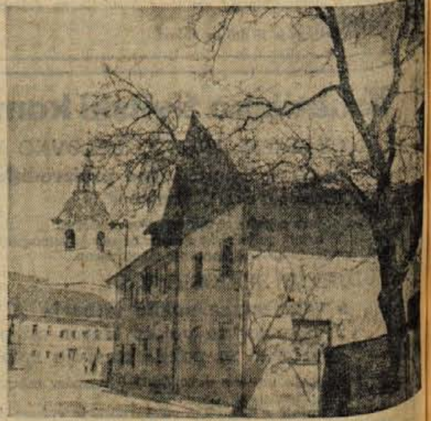
Mengš — dom glasbenikov Liparjev