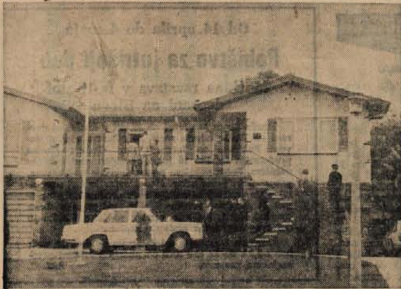
Jugoslovanska ambasada v Canberru