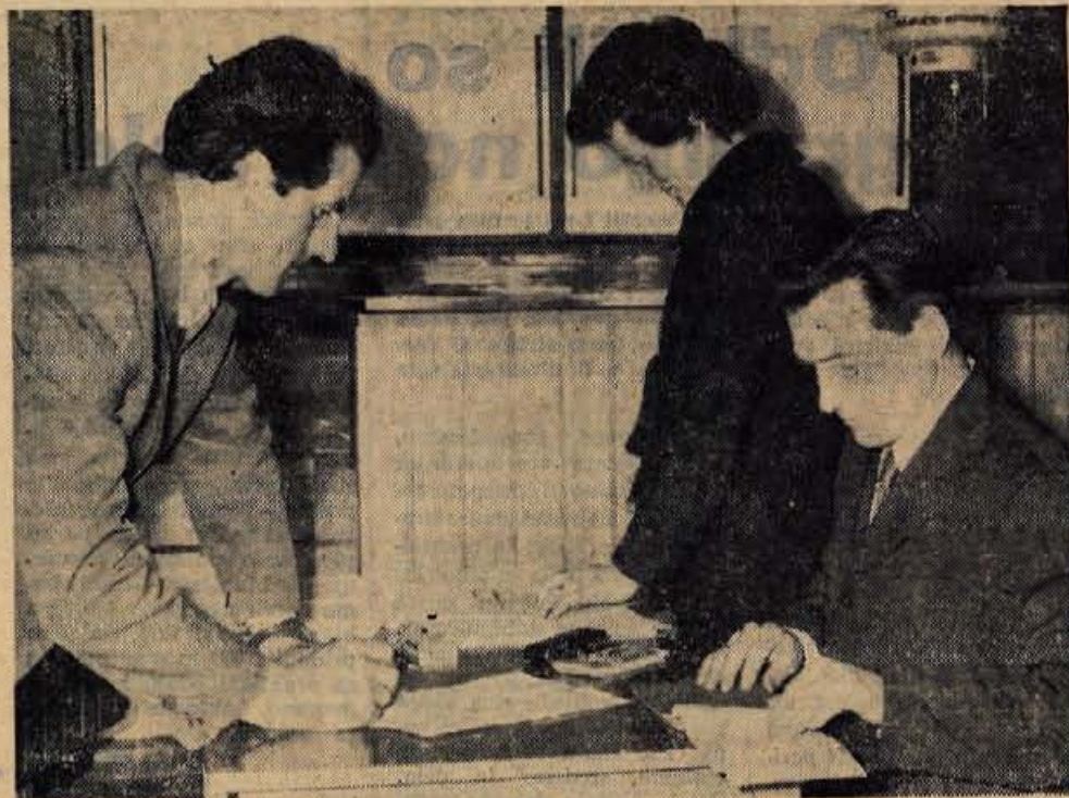
V ponedeljek so kmetje-lastniki gozdov v prostorih Gozdnega gospodarstva Bled podpisovali pogodbe o srednjeročnih posojilih za pospeševanje kmetijstva in razvoja kmečkega turizma v zgornjem delu Gorenjske.