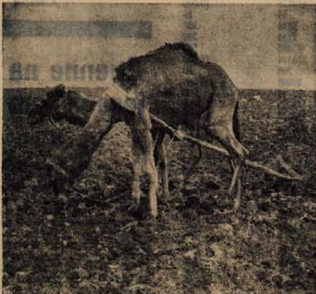
Beduin in velblod sta nerazdružljiva zaveznika, Arabci pa grbavo žival manj spoštujejo in ji desetkrat vsilijo ne spoštljivo vlogo vola-orača.

Potujoč navzdol, stisnjeni v notranjost zoltega »furgona«, ki mukoma gloda razdrapano cestišče in mimo ilovnatih kolib, čepečih pod terasasto obdelanimi polji, mimo idilično primitivnega mlina, mimo skromnih njivic komaj vzklilega žita, zaščitenega pred čredami ovac, hropeč premaguje kilometre, obujamo spomine na prestani trud. Spredej, zraven šoferja v sivi kaftanasti tuniki, ždi častna izjerna šestčlanska švicarske klope, ki ji je sobotno neurje vzelo pogum, da ni upala dalje. Planinci so se obrnili ter zbežali nazaj, v udobno oskrbo Madžarskega hotela. Samo eden je vztrajal in, ohrabren od naše neuklonljivosti, celo dosegel vrh Toubkala. A glej smolo! Med jahanjem v Imelil — nikdar poprej še ni tičal v sedlu — je zdrknil raz sedla in si poškodoval rebra. Nič resnega ni, so ugotovili zdravniki. Ko nato priropotamo v Asni, ga razposajeni žiriški prijatelji, katerih vir joličasti nosovi in krvave oči dokazujejo, da jim gosto maroško vino presneto prija, potegnejo k točilni mizi in naročijo novo »rundo«. Seveda ne manjka zbadljivih namigovanj, češ, mar bi ostal tule in spil kakšen kozarček — hribi očitno niso zate.