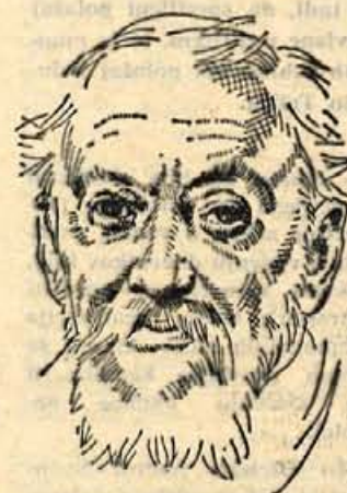
Portretna risba s tušem kot ilustracija v članku (delo slikarja L. Pengova)

Eden najboljših slovenskih risarjev je bil prav gotovo zdaj žal že pokojni akad. slikar Ladislav Pengov. Po dovršeni ljubljanski realki se je likovno izobraževal na zagrebški in dunajski umetniški akademiji. V letih pred smrtjo je bil profesor na ljubljanski likovni akademiji. Je pa po rodu izvirjal iz slo-