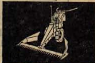
Kosilnik kombi naprave WIESEL