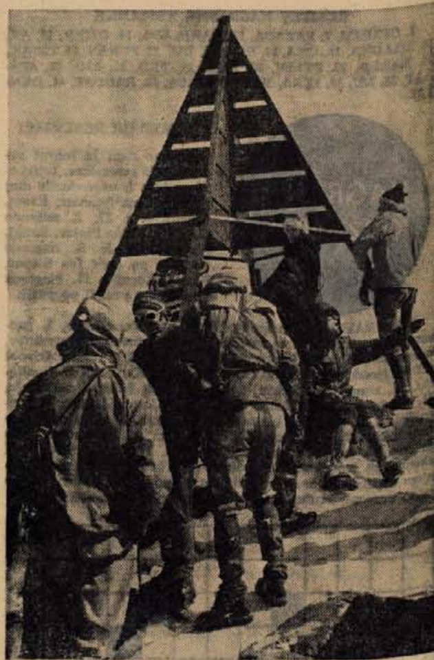
Vražje mrzlo je bilo na vrhu, a vendarle nihče ni hotel kar takoj zapustiti teško osvojljive piramide.

Spričo vnetega žulja je dve in polurni spust do točke,