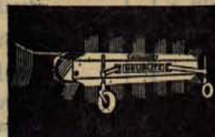
Traktorski obračalnik — zgrabljajnik