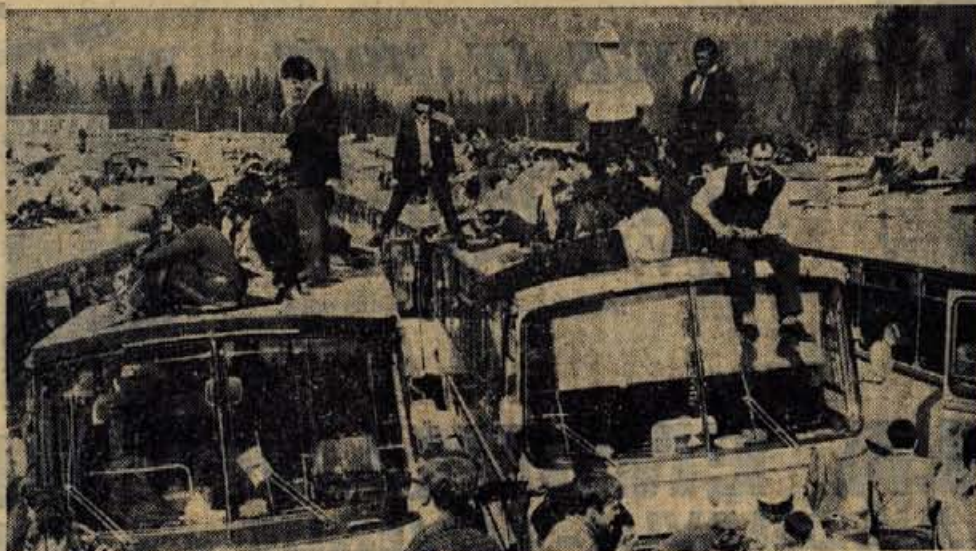
Tisoči in tisoči gledalcev so si ogledali polete na prvem svetovnem prvenstvu. Po nestrokovnih ocenah jih je bilo v vseh treh dneh prek 120 tisoč. Bili so povsod, celo na strehah avtobusov.