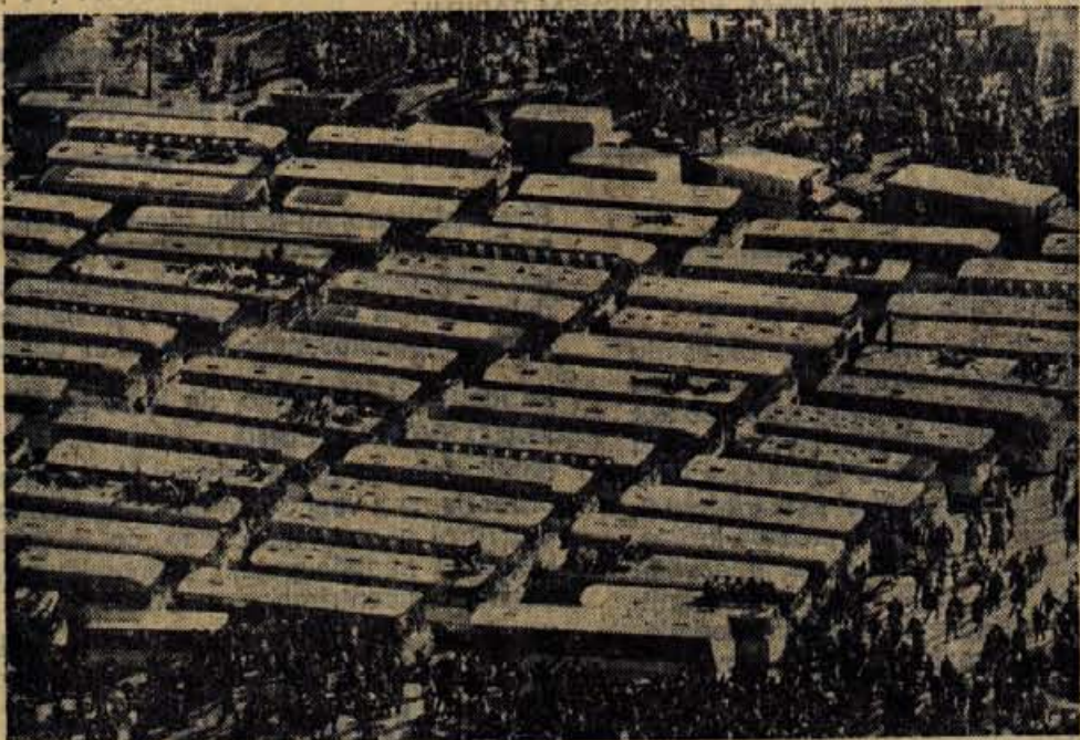
V vseh treh dneh prvenstva je pripeljalo v Planico okrog tisoč avtobusov