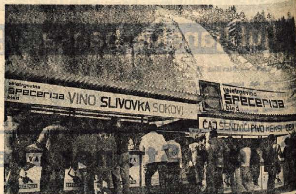
ŠPECERIJA BLEED — stojnica na I. svetovnem prvenstvu v smučarskih poletih v Planici

Za potrošnike so pripravili svojevrstno presenečenje. V posebno jubilejno kavino me-