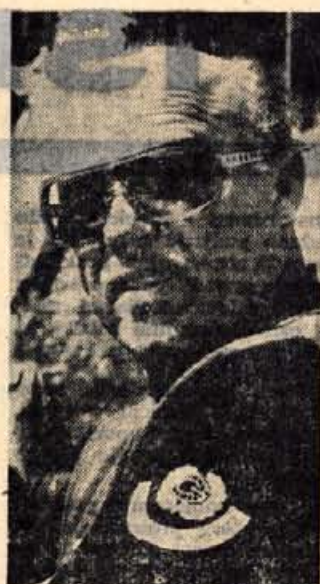
Sepp Bradl: 1936. leta prvič čez 100 metrov