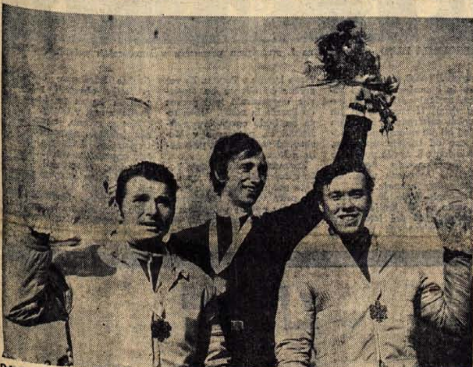
Od leve proti desni: 3. mesto Jih Raška (Češkoslovaška), 1. mesto Walter Steiner (Švica) in 2. mesto Heinz Wospiwo (Nemška demokratična republika).

Od naših najboljši Štefančič — deseti, najdaljši Norčič 131 metrov