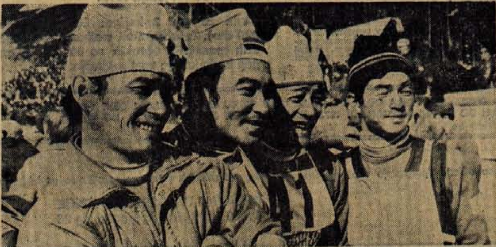
Japonskim tekmovalcem Konnu, Aochiju, Kasayi ter Mazuki ni šla v račun letalnica konstruktorjev bratov Lada in Janera Goriška. V vseh treh dneh poletov so se zaskrbljeno ozirali na njen hrbet.