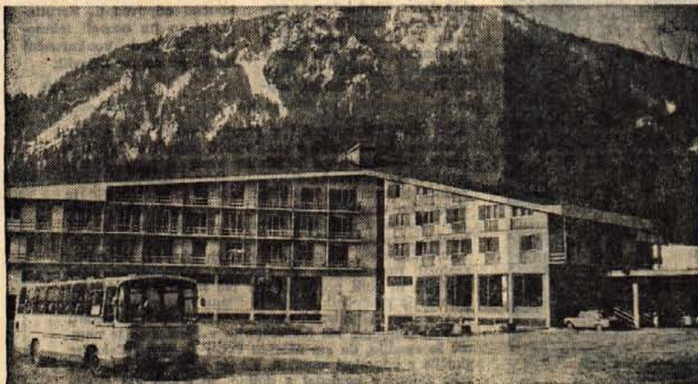
Hotel Larix v Kranjski gorl.

s svojimi hotelskimi in gostinskimi obrati: