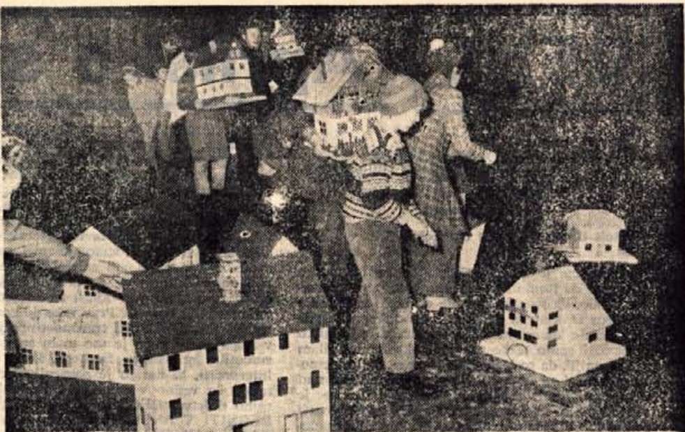
Na narasli Tržiški Bistrici so se v soju velikega kresa pozibavali »gregorčki«.

Danes ne spuščajo več plentih košev z odpadki usnja, temveč izdelajo otroci različne hišice iz lepenke ali lesa, v njih prižgejo sveče ter hišice privezane na vrvice spustijo po reki. Letošnje leto so se tega lotili v vseh treh