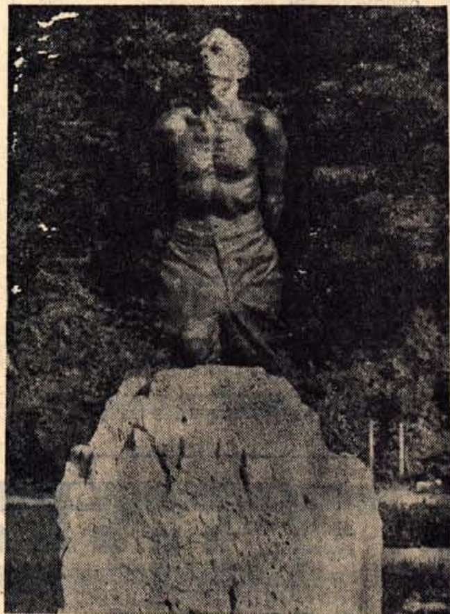
Spomenik mengeškim talcem na mestu, kjer so Nemci 8. januarja 1944 ustrelili trideset Mengšanov in okoličanov. Spomenik je izdelal pokojni kipar Jaka Savinšek.

Organizacija rdečega križa pričakuje, da bodo naši občani tudi tokrat pokazali polno razumevanje pri tej humani solidarnostni akciji. J. C.