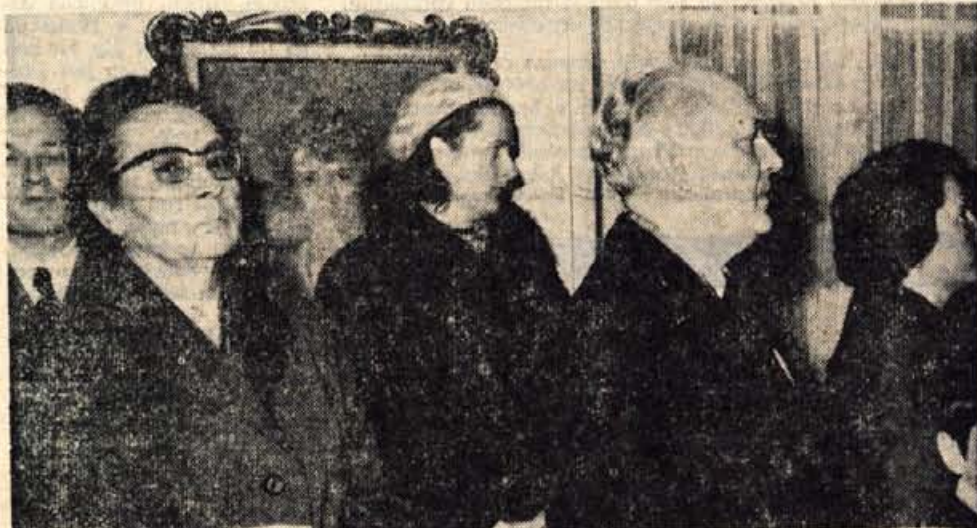
V počastitev dneva žena so v torek ob 17. uri v Gorenjskem muzeju v Kranju odprli razstavo del slikarke Ivane Kobilice. Slovesne otvoritve se je med drugim udeležil tudi predsednik slovenske skupščine Sergej Kraigher z ženo.

v Prešernovi ulici 14 (veža poleg Galanterije)