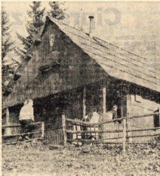
Lovska družina Dovje praznuje letos 25-letnico obstoja, zato bodo ob tej priložnosti pripravili posebno svečanost s programom in razvitjem svojega prapora. Lovska družina šteje 29 članov, njihova lovišča so na območju od Save do Karavank in od Hrušice do Belce, zelo skrbijo za gojitev divjadi v svojem lovišču, ob 25-letnici pa obljublajo, da bodo skrbeli tudi za nekatera spominska obeležja. V 25-letnem obdobju so si postavili tudi dve koči: eno imajo na Visokem, druga (na sliki) pa je postavljena na Brvogih pod dovško Babo.