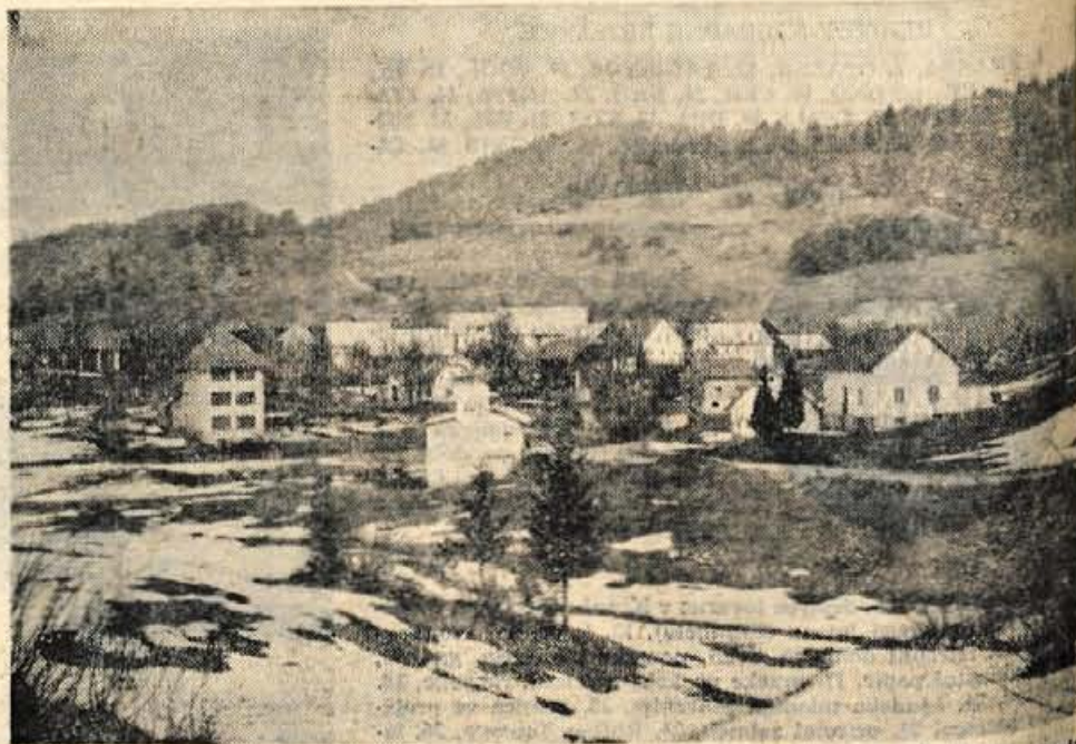
Letošnja zima je tudi prebivalcem Lučin prizanesla. Vaščani pa se še prav dobro spominjajo časov, ko so bili tudi po več dni odrezani od sveta.