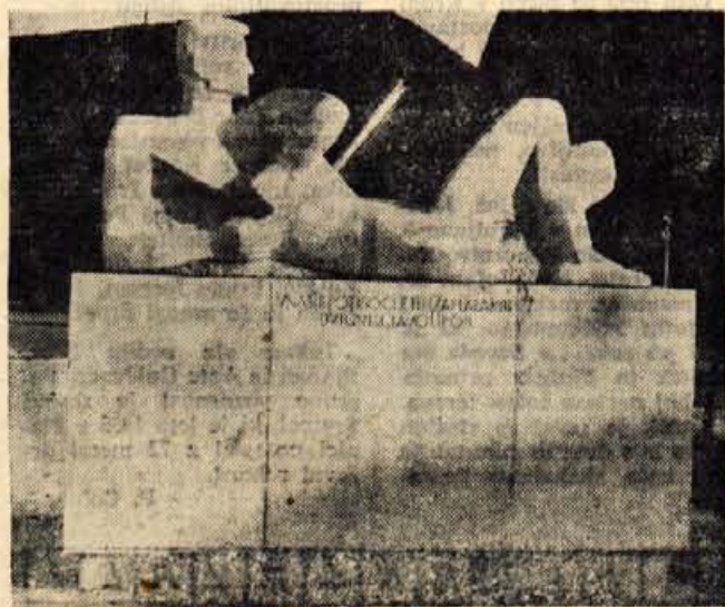
Osrednji spomenik NOB na trgu v Mengšu (delo kiparja Vekoslava Bombača). Na podstavku je vklesano: V nas je po tisoč letih zaplala kri, dvignil glavo upor.