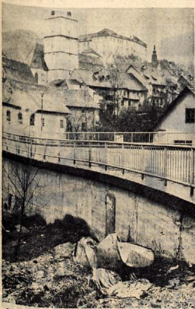
Ce bo Sava narasla, pa bo odnesla.