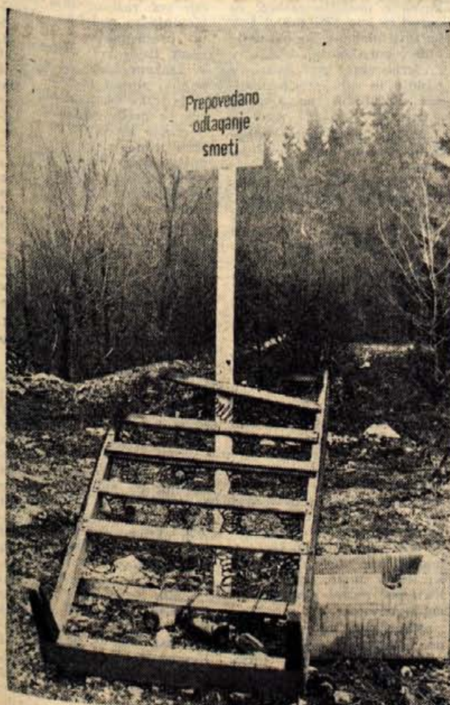
Podpis ni potreben.