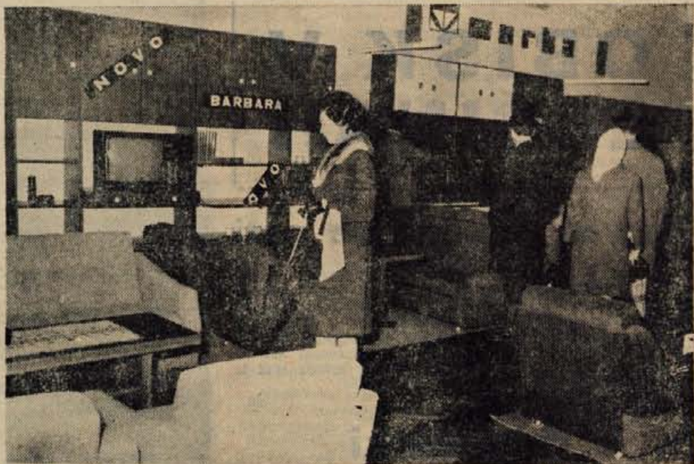
Murka Lesce je v četrtek v delavskem domu v Kranju odprla razstavo pohištva in tehnične opreme. Na razstavi, ki bo odprta do 3. aprila, so prvič predstavili tudi nov proizvodni program tovarne pohištva Brest iz Cerknice. Na sliki: letošnja novost Bresta — dnevna soba barbara. — A. Z. — Foto: F. Perdan

V organizaciji smučarskega društva Jesenice bo danes in jutri v Kranjski gori letošnje državno prvenstvo v veleslalomu in slalomu za člane in članice. V soboto bo na sporedu veleslalom, v nedeljo pa slalom. V obeh dneh se bo pričelo tekmovanje ob 9. uri. J. J.