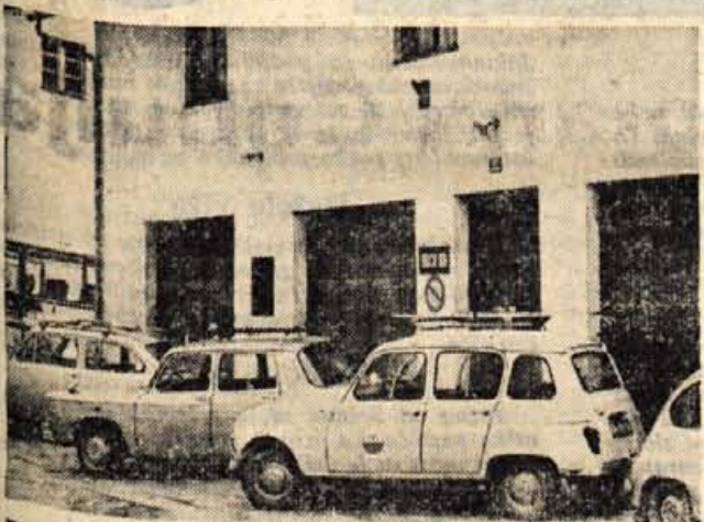
Pred gasilskim domom v Mojstrani: prometni znak sicer prepoveduje parkiranje, toda kdo bi se menil zanj. Kaj, če bi začelo kje goreti?