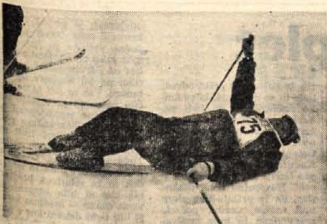
»Presneto, noge kar same od sebe zlezajo narazen. Spet sem na tleh. Kako se človek muči, da se pobere. No ja, smučam pa vseeno rad.«