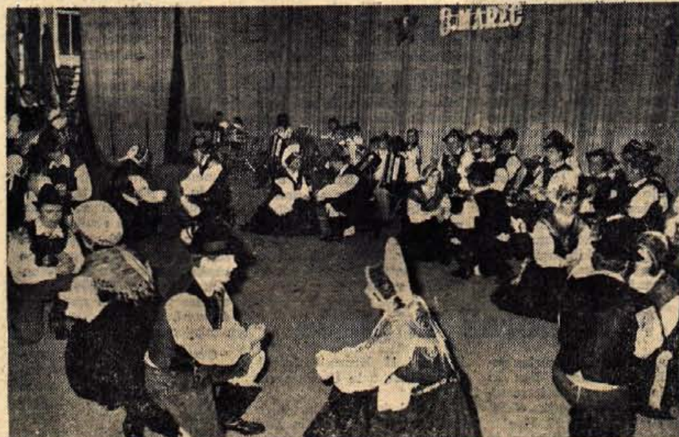
V zanimivem in kvalitetnem programu je sodelovala tudi folklorna skupina iz Gorij pri Bledu.

Osrednja gorenjska proslava ob dnevu žena