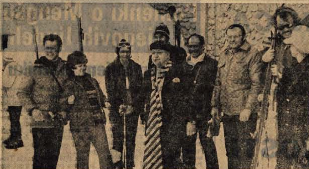
AMERICANI NA VOGLU: »Se bomo prišli!«