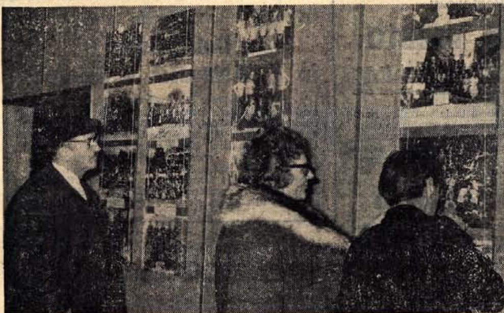
Pred začetkom proslave so v avli festivalne dvorane na Bledu odprli tudi razstavo Gorenjske žene v borbi in svobodi