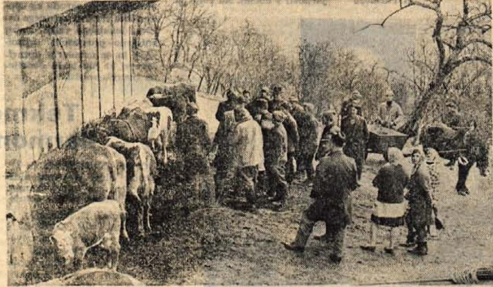
Odkupne cene živine so občutno prenizke, tarnajo kmetje