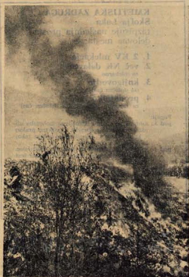
»Dimno nasilje« v naravi.