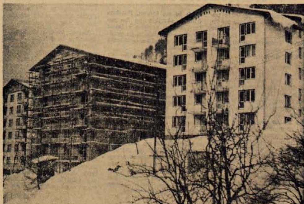
Splošno gradbeno podjetje Sava z Jesenic je pred dvema letoma zgradilo prvi stanovanjski stolpič v bližini končne avtobusne postaje na Tomšičevi cesti. Pri tem stolpiču pa bosta kmalu zrasla še dva nova. V vsakem bo dvajset stanovanj. Prvi bo kmalu gotov in se bodo stanovalci lahko vselili še ta mesec. (jk)