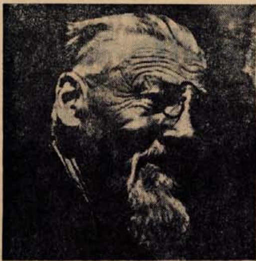
Arhitekt Jože Plečnik 23. 1. 1872 — 9. 1. 1957

Danes bo poteklo natanko sto let od dne, ko je ugledal v Ljubljani luč sveta Josip Plečnik. Bilo je to 23. februarja 1872. Srečen dan! Rodil se je tretji slovenski genij! Prvi je bil Primož Trubar, drugi France Prešeren, tretji pa vsekakor Jože Plečnik!