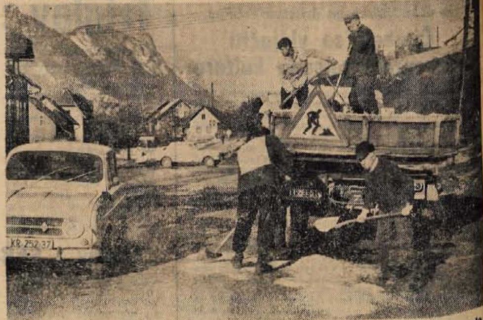
Tudi letošnja zmrzal in odjuga sta močno načeli naše ceste. Da bi razdejanje vsaj malo ublažili, so cestna podjetja začela zasipati večje luknje. Za obnovitvena dela je še prezgodaj.