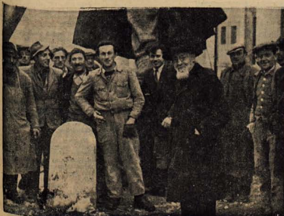
Arhitekt med kranjskimi delavci v jeseni leta 1932