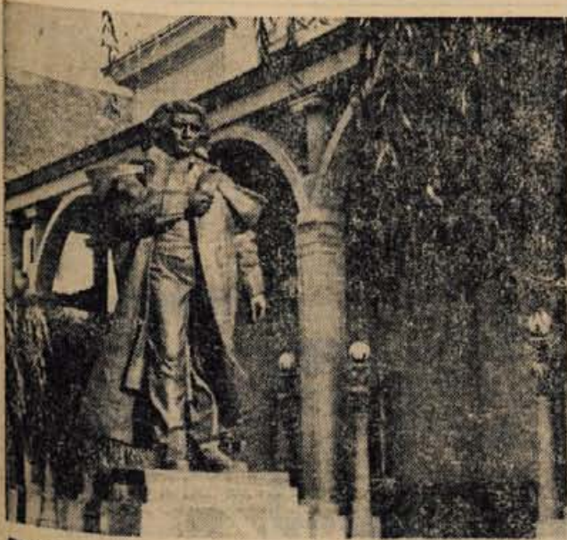
Plečnikova zamisel: vkomponiranje Prešernovega spomenika v gledališko fasado. Zdej zelenja ni več...

omenimo vodilo, ki je vse življenje spremljalo arhitekta Plečnika: