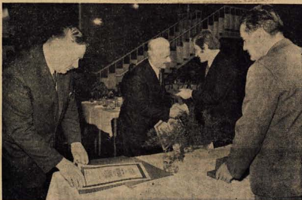
Eden od dožgoletnih članov kolektiva Cestnega podjetja Kranj sprejema priznanje na slovesnosti, ki je bila v soboto v hotelu Creina.