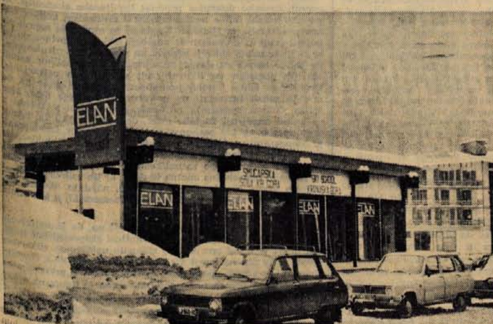
V Kranjski gori si lahko izposodite smuči in smučarsko opremo na spodnji postaji žičnice, v hotelih ali v paviljonu smučarske šole Kranjska gora, ki so ga postavili nasproti Emone. Za izposojene smuči je treba odšteti 15 din na dan, za smučarske čevlje 10 din. V smučarski šoli imajo več učiteljev smučanja, ki vas bodo za 195 din na teden učili smučarskih veščin šestkrat po štiri ure, za 120 din vas bodo vsak dan v tednu učili po dve uri itd. Tako za smučarsko opremo kot za smučarsko šolo pa velja, da skupinam nudijo znaten popust. — D. S.

»Tako imam rad to kmečko zemljo. Naši predniki so se trudili na vse načine, samo da je grunt ostal cel, da ni bilo treba prodati niti pedi. Našim in mojim otrokom pa zemlja ni mar. Meni pomeni vse, moji otroci pa samo zmi-gujejo z rameni. Le tovarno