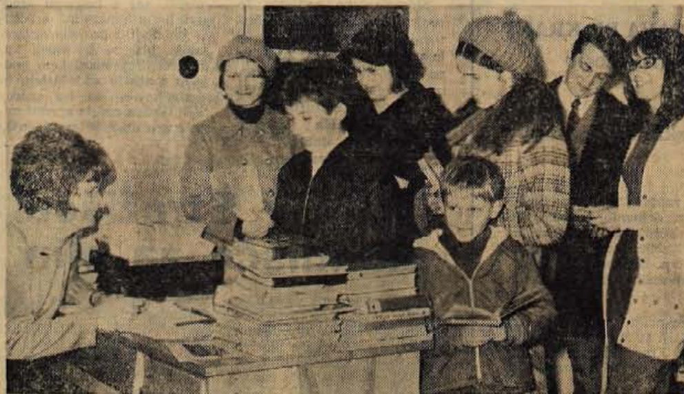
Ob nedeljah obiše knjižnico v Naklem največ ljudi.