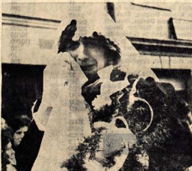
Lomska nevesta je letošnji predpust zaman čakala na ženina. Ostala je sama in zato potočila marsikatero solzo.