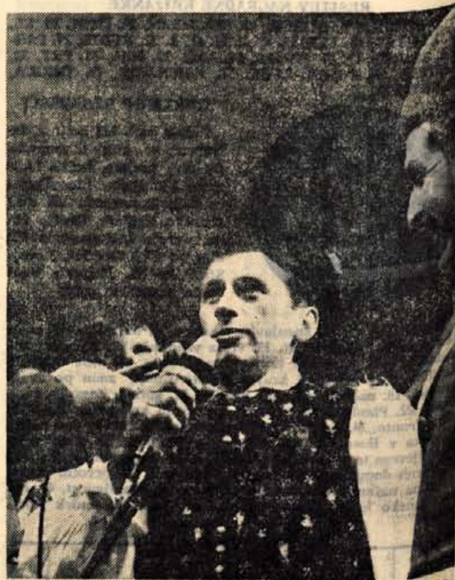
Tisočglavo množico na Trgu svobode v Trziču je najprej pozdravil predstavnik lomskih fantov in ji zaželel obilo zabave.

Povorka se je med množico stezka prerinila do Trga svobode v Trziču. Tam so lomskie fante že čakali kupci, ki bi radi ploh odkupili. Mislili so, da jih čaka lahko delo, vendar se Lomljani niso