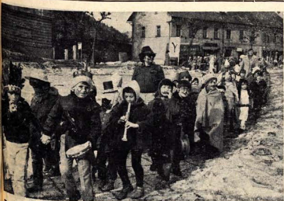
Trg revolucije v Kranju je bil na pustni torek poln indijancev, kavbojev, princesk, medvedkov, smuck in kdo ve česa še. Otroci iz kranjskih vrtcev so v lepem in vetrovnem vremenu prav gotovo s svojo prireditvijo pripomogli k preganjanju zime.