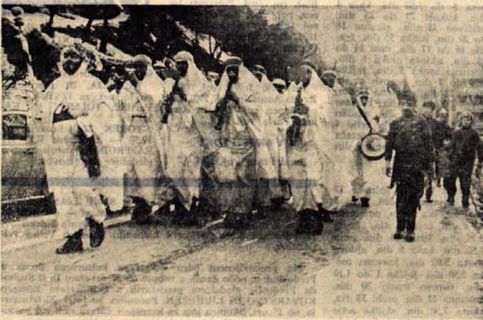
Na čelu sprevoda je korakala trziška godba na pihala, preoblečena v prava turška oblačila.