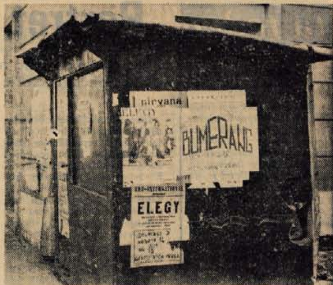
Na Titovem trgu v Kranju stoji precej razmajana baraka, v kateri vsako leto pečejo kostanj. Baraka pa je dobrodošla tudi divjim plakaterjem, ki brez pravega reda obešajo in lepajo lepake, kjer je le količak prostora. Tudi na tem področju bo treba enkrat narediti red. Sicer so pristojni to že nekajkrat poskušali, vendar kaže, da niso imeli kaj prida uspeha.