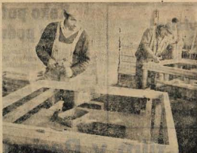
V obratu Jelovice na Sovodnju izdelujejo manjše serije okvirjev za okna in vrata.