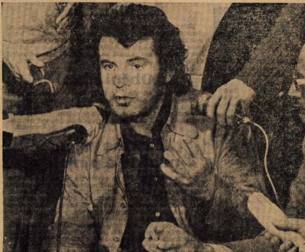
Miloš Forman, češki režiser, ki je posnel film Slačenje v Ameriki in ki je imel na letošnjem Festu zagotovo največ uspeha. Forman pravi: »V Ameriki je panika! Velika panika. Nihče več ne ve, kaj bi lahko zagotovilo uspeh in polno blagajno producentom!«

Beograjski festival festivalov — FEST 72