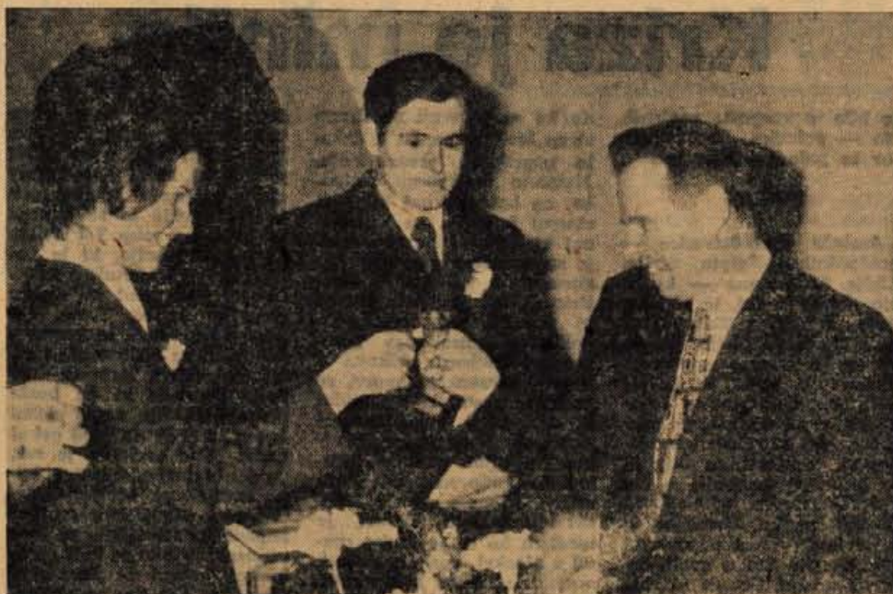
Ravnatelj-matičar in njegova dijakinja-nevesta sta nazdravila po sklonjeni zakonski zvezi!

Se to: voznika »katrce« dogodek ni streznil. Pobral je jokajočega otroka izpod sedeža in ga spet posadil na prvi sedež.