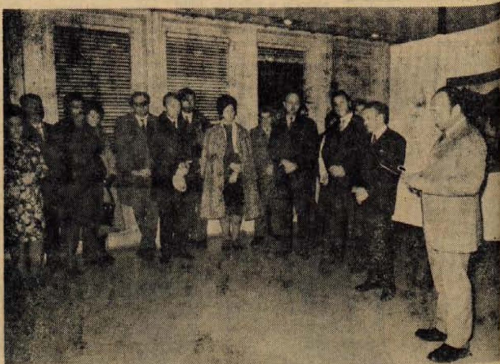
V okviru praznovanja slovenskega kulturnega praznika je bila v ponedeljek v Murski Soboti odprta likovna razstava del enajstih slikarjev gorenjske skupine 72, medtem ko likovna skupina DHLM iz Murske Sobotice razstavlja v kranjski mestni hiši. Na sliki: z otvoritve razstave v razstavnem paviljonu arh. Franca Novaka v Murski Soboti.

V petek, 11. februarja, so v dvorani amaterskega gledališča Tone Čufar na Jesenicah ponovili dramo Eugena O'Neillja Strast pod brestji, s katero so se že predstavili jeseniškemu občinstvu, in s katero so gostovali tudi po drugih krajih Gorenjske. Predstavo so namenili upokojujencem in drugim. Za vstopnico je bilo treba odšteti le dinar. D. S.