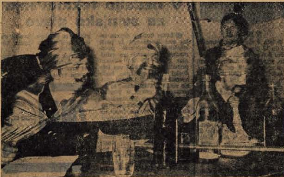
Gospod veliki Zeleni car — stara bajta strojnštva, prvi vezir iz teheranskega dvora — stara bajta ekonomije in imam — takisto stara bajta ekonomije: »Krote zelene, nič ne znajo!«