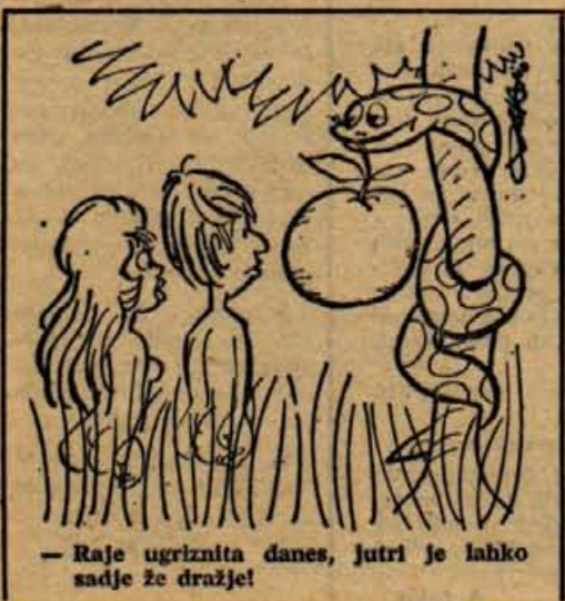
— Raje ugriznita danes, jutri je lahko sadje že dražje!

● V Mariboru pa tudi ponekod drugod so se pojavili ponarejeni 5-dinarski kovanci. Ponareddki so zelo podobni originalnemu kovancu,