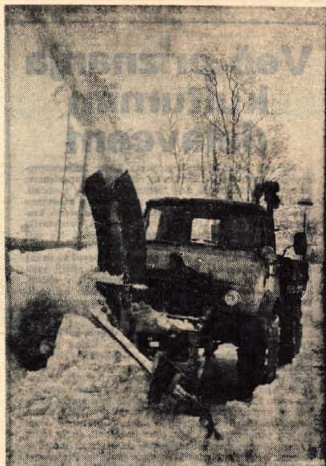
Takle unimog z napravo za čiščenje snega in drugimi priključki bo kmalu dobilo komunalno podjetje Bohinjska Bistrica

nih posebnosti. Predstavnika dveh podcentrov komune, Zeleznikov in Gorenje vasi, ki naj bi v tekočem letu dobila manj denarja kot običajno, sta opozorila, da gre za zelo razsežni območji, katerih potrebe zares ni moč primerjati s potrebami manjših, komunalno neopremljenih regij. Predsednik Zdravko Krvič na je nato obsodil nedelavnost posebne komisije, ustanovljene 24. novembra lani. Le-ta bi namreč morala izdelati natančen ključ razdeljevanja sredstev, namenjenih krajevnim skupnostim, ter vanj zajeti tudi posebnosti krajev, zlasti pa dolžino in stanje cest. Toda komisija je spričo kronične nesklepnosti imela samo en sestanek. Tvorci osnutka so bili zategadelj prisiljeni uporabiti zgolj star, neizpopolnjen sistem standardnih podatkov (število prebivalcev, površina, kilometri poti, gostota naprav splošnega družbenega standarda itd.). Skupščina je nazadnje članom komisije izbrala 25. februar kot skrajni rok, do katerega naj nadoknadijo zamujeno in pristojni službi izročijo svoje predloge. I. Guzelj