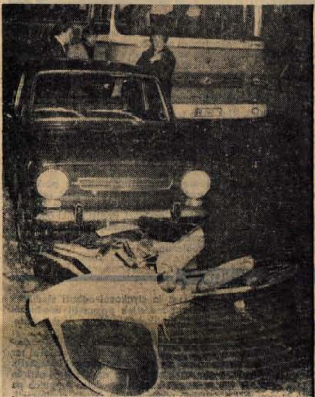
Poledica na Koroški cesti v Kranju je sredi tega tedna botrovala težje prometni nezgodi. Za mopedistom, ki je na spozkl cesti padel, je pravočasno ustavila voznica osebnega avtomobila. Za njo pa je prišel avtobus, ki ni mogel ustaviti in je avtomobil potisnil naprej v moped. Zvita pločevina je povzročila manj hude krvi kot pa dolgotrajni zastoj prometa na tej glavni cesti.