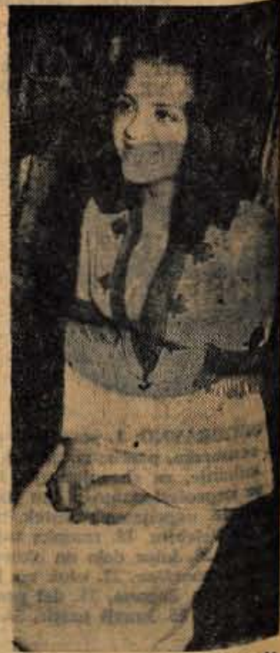
»Tale brucka me pa vznemirja,« je priznal sam Zeleni car