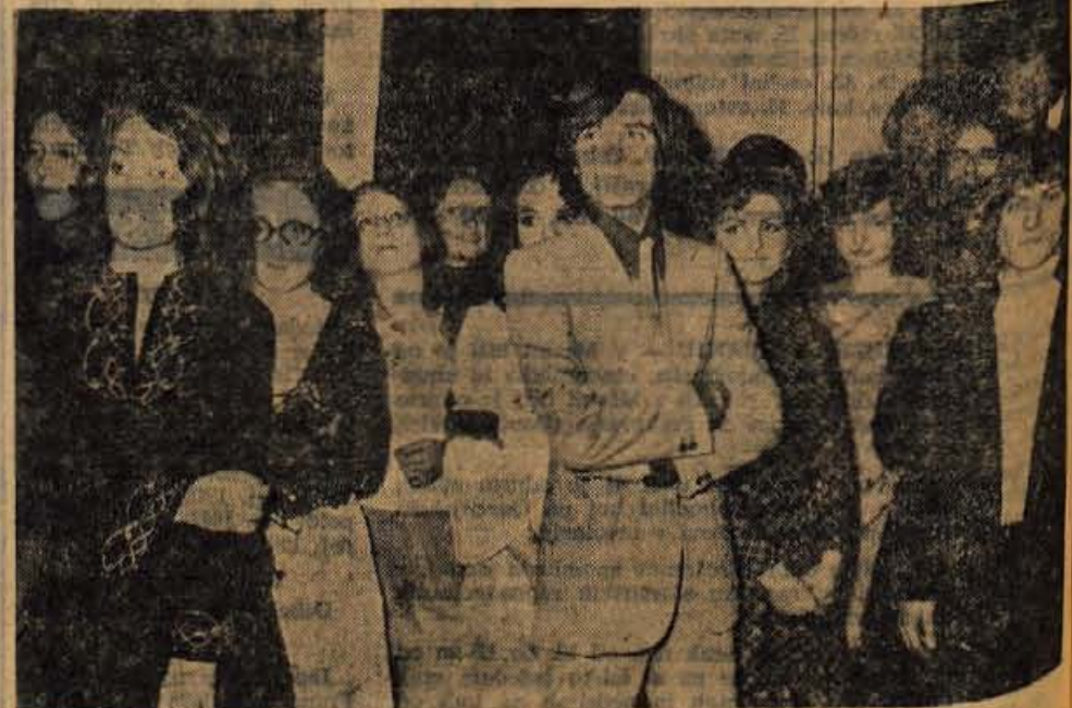
Bruc major je dobro ukrotil »čredo divjih konj« — brucevnamreč