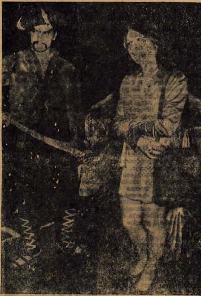
Bruci zeleni. Ampak priznajte, najdejo se pa tudi dobri primerki.