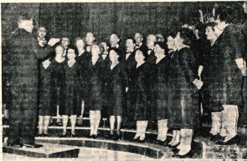
KUD Sforzič na Kokrici je v nedeljo, 12. decembra, ob 15.45 pripravil v kulturnem domu na Kokrici srečanje pevskih zborov. Nastopil je mešani pevski zbor KUD Tine Rožane iz Ljubljane in moški pevski zbor ZB iz Zgoranje Siske. Na sliki mešani pevski zbor KUD Tine Rožane iz Ljubljane.