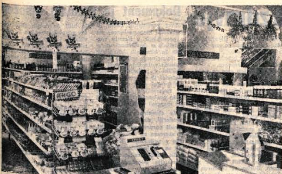
OBNOVLJENA TRGOVINA PRI PETERČKU — Veletrgovina Zivila Kranj je v soboto dopoldne v Kranju odprta prenovljeno samopostrežno trgovino pri Peterčku. V trgovini so zamenjali opremo in uredili delikatesni oddelek. Povečali pa so tudi hladilni prostor. Trgovina je zdaj enkrat večja kot je bila, ker so v prodajni prostor preuredili tudi polovico skladišnega prostora. — A. Z.