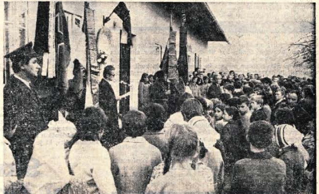
Minulo soboto in nedeljo so bile povsod na Gorenjskem žalne svečanosti. Ne le v Begunjah in Dragi, tudi drugje so grobove in spominska obeležja okrasili s cvetjem. Na sliki: žalna svečanost pred Hafnerjevo hišo v Stražišču.

V novembru bodo pomaknjene tudi meje najnižje pokojnine navzgor na 680 din, nekoliko bo tudi spremenjena meja najvišjih pokojnin. Upokojencem z varstvenim dodatkom se bo pokojnina z dodatkom vred povečala za 24 odstotkov. Pokojnine naj bi povečali že s 1. januarjem 1972. Upokojencem, ki so bili upokojeni v letošnjem letu in se jim je v osnovo že štel dohodek iz letošnjega leta, se pokojnine ne bodo povečale.