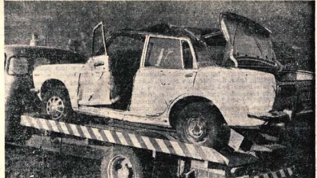
V petek popoldne se je blizu vasi Vrba na Gorenjskem zgodila huda prometna nesreča. Smrtno se je ponesrečil Milica Mlekuš iz Lesc.

VDANAŠNJI ŠTEVILKI POSEBNA KULTURNA RUBRIKA SNOVANJA