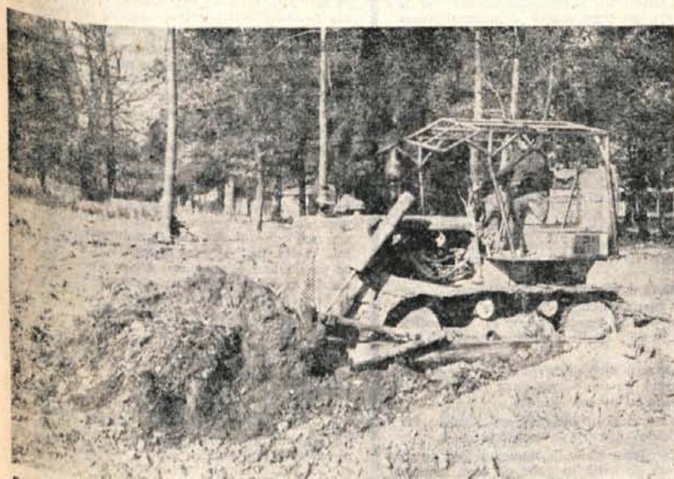
Pri osnovni šoli Cvetko Golar na Trati pri Skofji Loki so začeli graditi otroški vrtec. Vseljivo bo prihodnjo jesen in bo lahko sprejel v varstvo okrog 130 otrok.